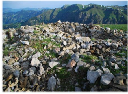
Sazgirel(Bazgireti) Kilisesi (URL-8)

Köyün yeni adı Maden Köyü' dür. Eski ismi olan "Bazgiret" adını Gürcüce Badzgareti' den türemiş olan "Diken yapraklı çalı" anlamına gelen bir isimden almaktadır. Bazgiret köyü üç tarafı dağ ve ormanlarla çevrili bir vadi içerisinde yer almaktadır. Bu zorlu coğrafik yapısı ve ulaşım zorlukları nedeniyle ilginç folklorik yapısını bozulmadan günümüze kadar taşımıştır. Köy kendine has Gürcüce- Türkçe şarkıları, manileri, atışma türküleri, halk oyunları, şenlikleri, ahşap mimarisi, yaşam tarzı ve kültürel öğeleri ile göze çarpmaktadır ve bu otantik kültürü günümüze kadar taşıyıp sürdürmektedir.