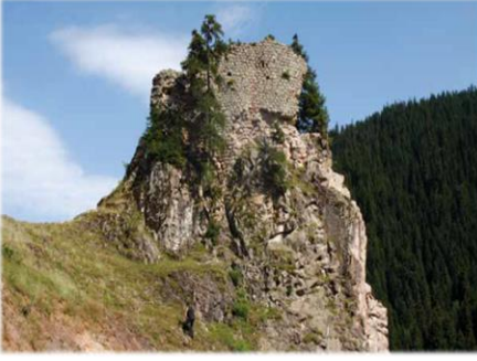
Hevsrul Kalesi (URL-7)