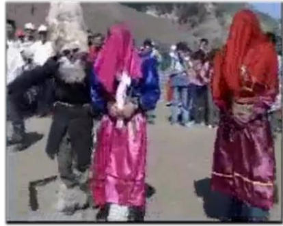
Berobana Oyunundaki Beri ve gelinler (URL-5)

Berobana oyununu geçmişin ayrı olaylarını yansıtmaktadır. Olayla bağlantılı olarak Berobana oyununun dinsel yönü olarak bilinen keçi maskesi toprak kültüne bağlıdır ve bolluk bereketi simgeler. Berobana oyunu o yılın bolluk, bereket getirmesi, doğanın canlanması ve doğacak hayvan sayısının çok olması gibi inanış ve ritüellere dayanarak oynanmaktadır. Oyun içerisindeki ölüp dirilme ritüeli doğanın tekrar canlanıp bereketin çok olması amacına dayanmaktadır. Anadolu insanı tarım kültürüne geçtiği çok eski dönemlerden itibaren günümüze kadar mevsim geçişlerine, ekim-dikim ve hasat zamanlarına özel bir önem vermiş, bu zamanları tören ve şenliklerle kutsamıştır. Anadolu insanının o dönemlerde yaşadığı kıtlık ve bolluk dönemleri Ak-Kara (iyi-kötü) ya da Ölüp-Dirilme (eskiden) ile özdeşleşmiştir. Dönemler arasındaki bu ak-kara çatışması da köy seyirlik oyunların temel yapısını belirlemiştir (Özdinçer, 2011: 11). Berobana oyununda da kız kaçırma ve ölüp dirilme ritüelleri olup geçmişe ait izler görülmektedir. Anadolu Türk Köylüsü bu oyunları oynarken, daha önce aynı topraklar üzerinde yaşamış olan toplulukların yaptığı gibi doğayı büyüleyerek tarlasının ve bağının bereketini artırmaya çalışmaktadır (Çetin, 2017: 203).