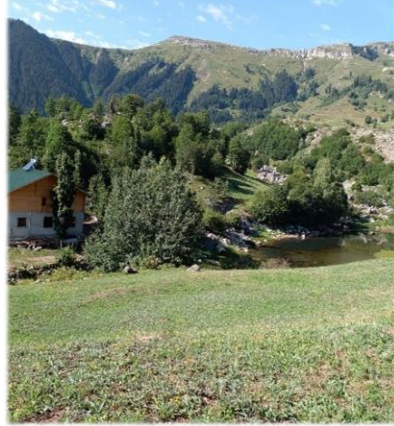
Sakednia Gölü Marioba festival alanı ve otel