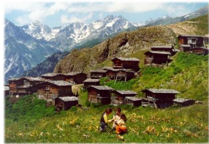
Maden (Bazgiret) Köyü Cancir yaylası ahşap mimarisıyla de dikkat çeker. Marioba şenliği Cancir yaylasına çıkıldıktan sonra da devam etmektedir. (URL-2)