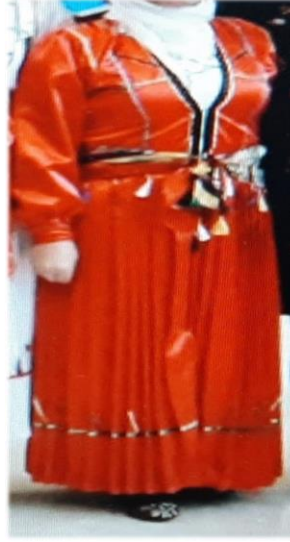
Marioba şenliği boyunca kadınların giydiği yöresel kıyafet Buzma