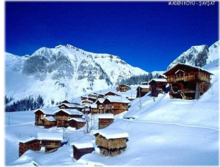
Maden (Bazgiret) Köyü (URL-9)

Bu kültürel yaşam, içerisinde birçok folklorik öge barındırır. Bu öğelerden biri de Marioba'dır. Marioba; ilk çıkış tarihi bilinmemekle birlikte kökleri çok eski dönemlere kadar uzandığı düşünülen, içerisinde birçok inanış, eğlence, kostüm ve ritüeller barındıran, yaylaya çıkış ve yayladan iniş zamanlarında yapılan halk şenliğidir.