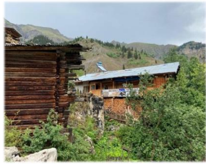
Pansiyona dönüştürülmüş köy evleri