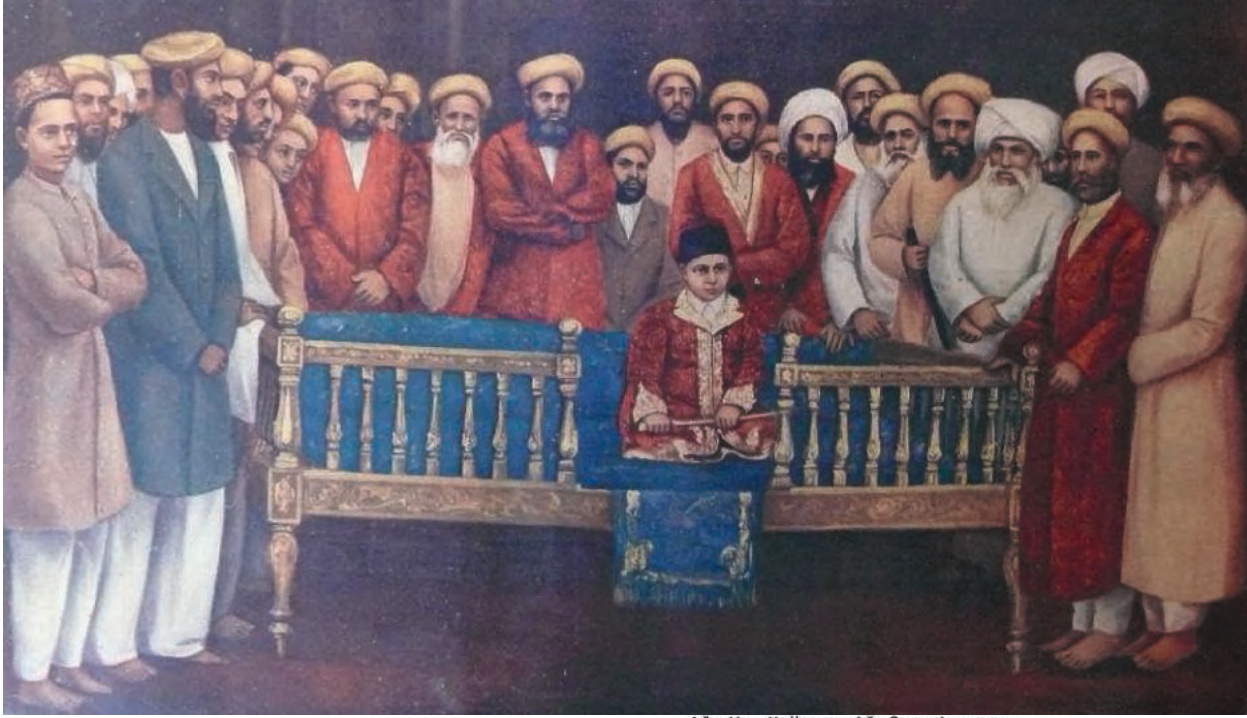
Ağa Han Kalkınma Ağı Organizasyonu

Ortaçağ'da Nizari İsmâillîği propagandalarını muhaliflik, suikast düzeleme, alternatif yönetim oluşturma, alternatif şehir ve mabed inşa etme üzerine kurmuştu. XIX. ve XX. Yüzyılda Nizârî İsmâillîği Ağahanlar dönemiyle farklı bir strateji ile faaliyetlerini yürüttükleri görülmektedir. Bu stratejinin ana gövdesini Ağa Han Kalkınma Ağı, ilk, orta, akademi, enstitü ve üniversitelerden oluşan Ağa Han Eğitim Kurumları ile sanayi sektörü ve kültür-sanat faaliyetlerinde aktif rol oynadılar.