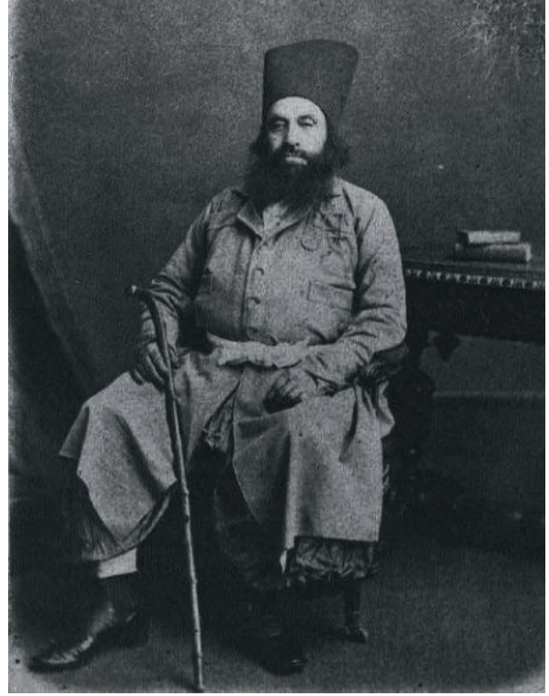
Ağa Han I

olarak göstermeye çalışmıştır. Safeviler'in yıkılışından sonra Nâdir Şah zamanında Mahallât'ta İsmâilî hâkimiyetinin devam etmesine rağmen kırk ikinci imam Seyyid Hasan döneminde imamın ikametgâhı Şehribâbek'e taşındı. Kerim Han Zend'le iyi ilişkiler kuran kırk dördüncü imam Ebü'l-Hasan Şah 1756 yılında beylerbeyi unvanıyla Kirman valiliğine tayin edildi. Ebü'l-Hasan'ın 1780'de vefatı üzerine imam olan oğlu Halilullah Ali, Kaçar Hükümdarı Feth Ali Şah'la iyi münasebetler tesis etti. İmâmet merkezini önce Mahallât yakınındaki Kâhâk'a, ardından Hindistan'dan gelen mensuplarıyla daha iyi irtibat kurabileceği Yezd'e nakletti. 1817'de imamın mensupları ile Yezd'deki İsnâaşeriler arasında mezhep tartışmasından çıkan kavgada Halilullah öldürülünce oğlu Hasan Ali Şah, Nizâriyye'nin kırk altıncı imamı oldu. Yeni imam, Feth Ali Şah'ın kızı Serv-i Cihân Begüm ile evlenip saraya intisap ettikten sonra kendisine "Ağa Han" unvanı verildi. Bu unvan, Hasan Ali Şah'tan sonra gelen üç Nizârî imamının da unvanı oldu. Hasan Ali Şah'ın 1881 yılında Bombay'da ölümünün ardından oğlu Ali Şah imam oldu. 1885'te sekiz yaşında imâmet mevkiine gelen Sultan Muhammed Şah bu görevi 1957 yılına kadar sürdürdü.