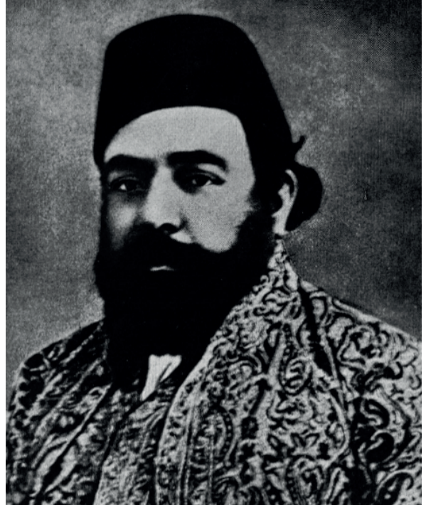
Ağa Han II

IX. yüzyılda Sünni İslam dünyası ile isna aşere'den ayrılan İsmaililer başlangıçta alternatif bir gündelik hayat, mekanlar ve yönetimler kurdular. Hedeflerine ulaşmak için suikastler ve savaşlar yaptılar. Ağa Han İsmailiği döneminde ise amaçlarına ulaşmak için Hristiyan dünyasıyla barışık, başta eğitim sektöründe olmak üzere sağlık, sanayi, medya vb. sektörlerde faaliyet gösterdiler.