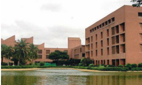
Aga Khan University

Ağa Hanların sağlık faaliyetleri 4 kuruluşun işbirliği ile gerçekleştirilmektedir. Bunlar; Ağa Han Sağlık Servisleri (AKHS), Ağa Han Planlama ve İnşaat Hizmetleri (AKPBS), Ağa Han Üniversitesi (AKU), Ağa Han Vakfı (AKF). Bu dört kurumdan birisi olan Ağa Han Üniversitesinin faaliyetlerini eğitim faaliyetleri başlığı altında işlemiştik. Ağa Han Sağlık Servisleri İsmailîlerin sağlık faaliyetlerinde ana rolü oynamakta, diğer kurumlar tali olarak bu kurumun destekçisi konumunda bulunmaktadır. AKHS bünyesinde bulunan 200'den fazla sağlık kuruluşu bulunmakta