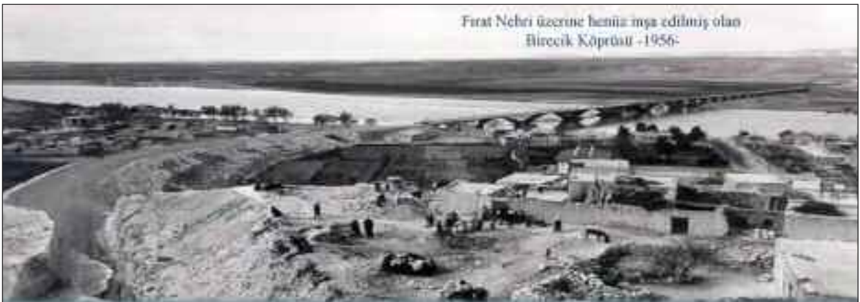
Fırat Nehri üzerine henüz inşa edilmiş olan Birecik Köprüsü -1956-