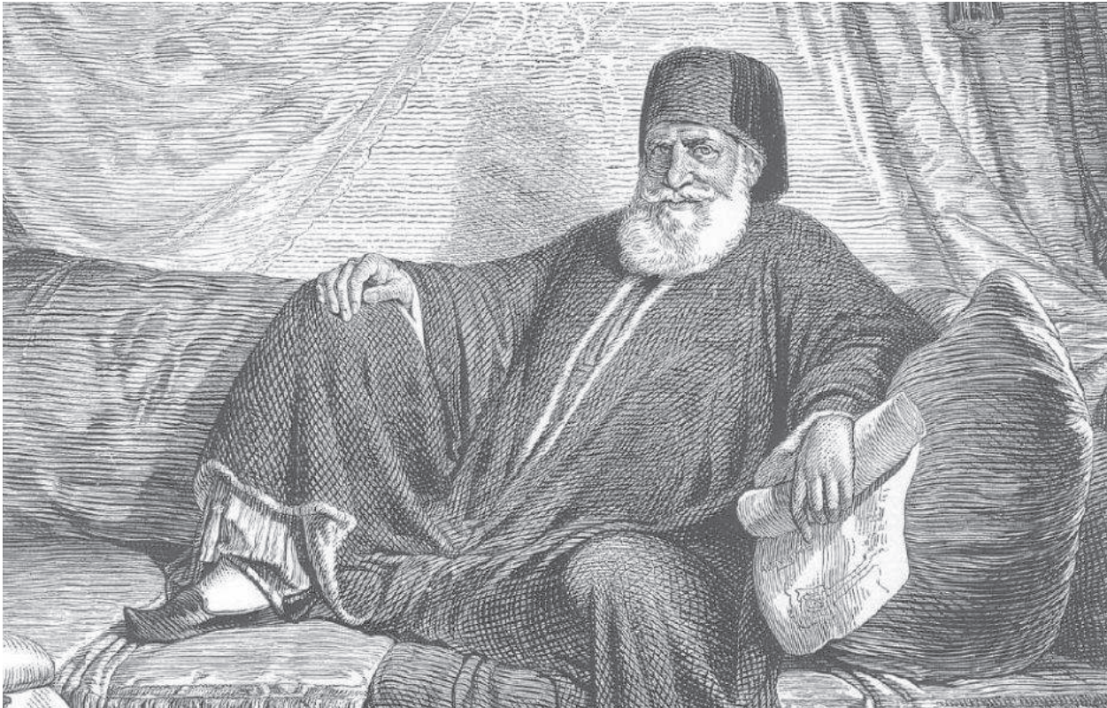
Kavalalı Mehmed Ali Paşa

Askerlik mesleğindeki modernleşme sadece askeri teknikler konusunda değil, aynı zamanda askerin zihniyet yapısında da büyük değişimler yaşanmasını sağladı. Bundan sonra Batı'nın tekniği yanında "düşünme" ve "yaşam biçimi" de Osmanlı ordusunda görülmeye başlandı. Askeri mekteplere Batılı zihniyetin girmesi, askeri mekteplerde Pozitivist, Materyalist ve Natüralist görüşlerin yaygınlaşmasına zemin hazırladı. 19. Yüzyılın ortalarında Mekteb-i Harbiye sadece taktik ve teknik olarak değil aynı zamanda zihniyet olarak da yeni bir anlayışı temsil eder hale geldi. Yeni zihniyette subaylar yetişmeye başlayınca, iki farklı subay tipi görülmeye başlandı. Bunlar alaylardan yetişen ve geleneği temsil eden alaylı subaylar ile yeni açılan okullardan yetişen mektepli subaylardı. Bu subay sınıfları arasında ister istemez çatışma başladı. Alaylılar kazandıkları mevzileri ellerinden kaçırmak istemiyor, mektepliler ise zamanın şartlarında eğitim aldıklarından kendilerini "üstün" görüyorlardı. 19. Yüzyılın ortalarına kadar