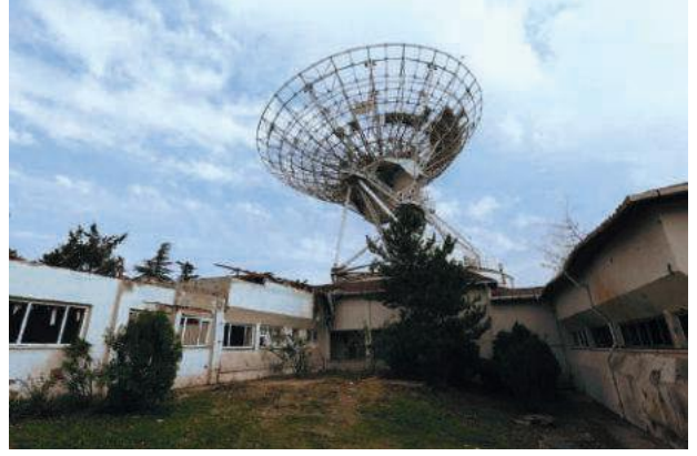
Darbeciler, TRT yayınlarını kesmek için TÜRKSAT tesislerine helikopterlerle saldırdı.