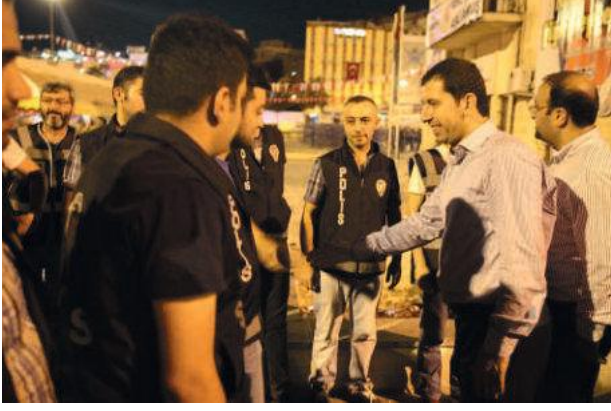
Türkiye bu tür ucuz ayaklanmalarla satılacak ülke değildir. Recep Tayyip Erdoğan T.C. Cumhurbaşkanı