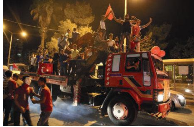
15 Temmuz zaferi kutlu bir destandır. Siz de dedelerinize layık oldunuz. Büyük bir destan yazdınız. Binalı Yıldırım Başbakan