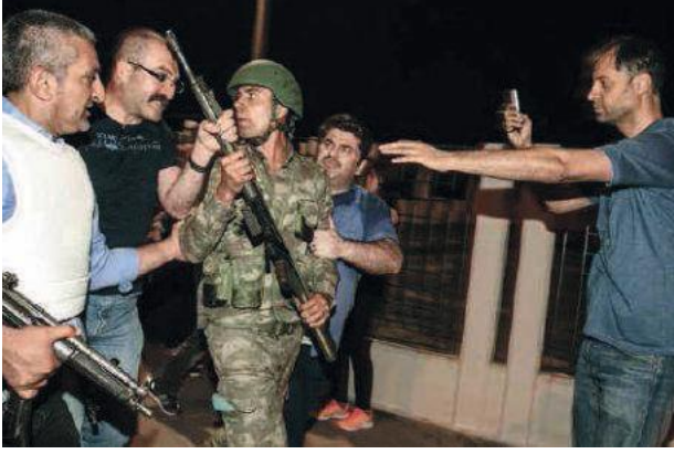
Darbe girişiminde bulunuan FETÖ mensubu askerler gözaltına alınmaya başlandı.