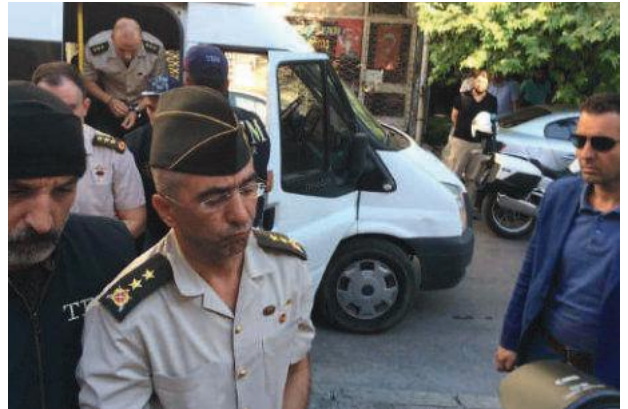
Darbeci Tümgeneral ve Albaylar görevden uzaklaştırılarak gözaltına alındılar.