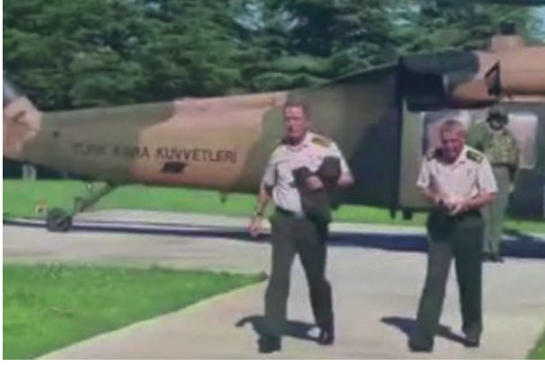
4. Ana Jet Üs Komutanlığına operasyon düzenlenerek Genelkurmay Başkanı güvenli bölgeye getirildi.