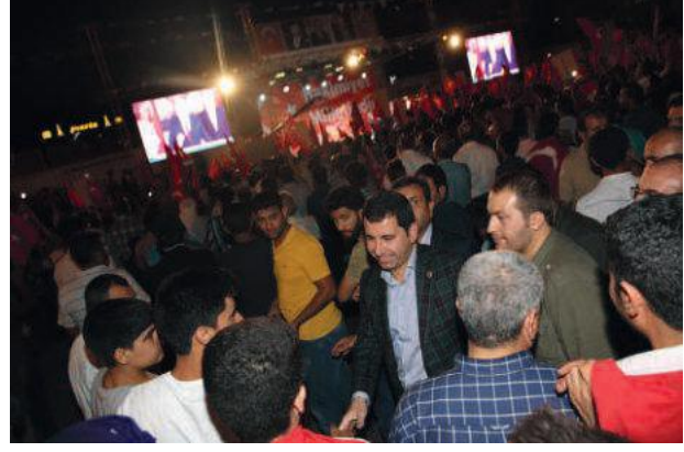
Bu geceler, gündüzler olacaktır. Recep Tayyip Erdoğan T.C. Cumhurbaşkanı