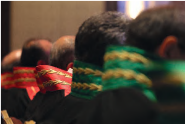
Ankara Cumhuriyet Başsavcılığı FETÖ irtibatlı yargı görevlileri ve sözde Yurtta Sulh Komitesi mensupları hakkında gözaltı kararı verdi.