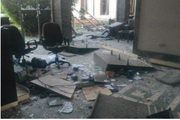
TBMM, kalkışmacı askerler tarafından bombalandı.