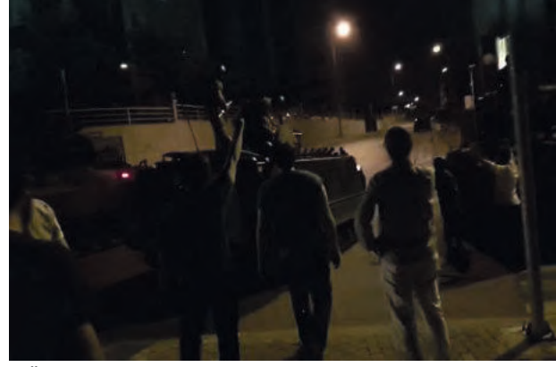
TÜRKSAT'ı bombalayan helikopter düşürüldü ve Jandarma Genel Komutanlığı Özel Hareket polislerince ele geçirildi.