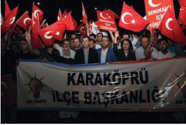
Şehirlerimizin meydanlarında halkımızla el ele olacağız. Recep Tayyip Erdoğan T.C. Cumhurbaşkanı