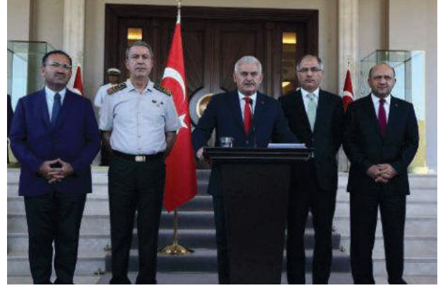
Başbakan Yıldırım: Bu kalkışma bastırılmıştır.