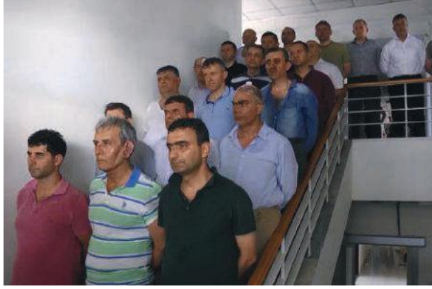
Eski Hava Kuvvetleri Komutanı Orgeneral Akın Öztürk ve Korgeneral Metin İyidil hakkında, vatana ihanet suçundan işlem başlatıldı.