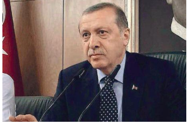
Cumhurbaşkanı Erdoğan, havaalanında açıklamalarda bulundu.