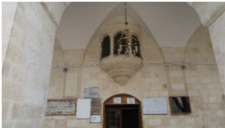
Dabakhane Cami Son Cemaat Yerinde Bulunan İki Çini Karo