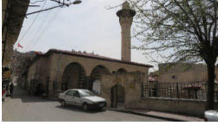
Bostancı Cami Genel Görünüş