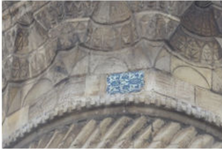
Ağa Cami Minaresi Şerefe Altındaki Çini Karo