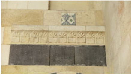
Bostancı Cami Minare Kapısı Üzerindeki Çini