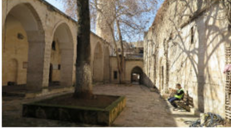
Dabakhane Cami Avlu ve Son Cemaat Yeri Genel Görünüş