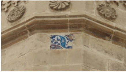
Handan Bey Cami Minaresindeki Çini