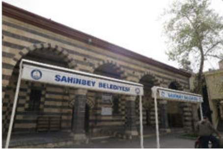
Gaziantep Ağa Cami Genel Görünüşü