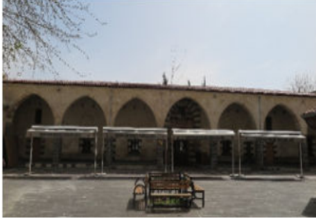
Ali Nacar Cami Kuzey Cephe Genel Görünüş