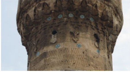
Dabakhane Cami Minare Şerefe Altındaki Çiniler