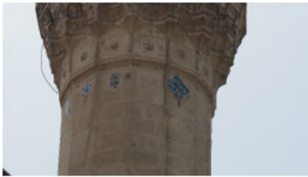
Bostancı Cami Minare Kuzey ve Kuzeybatı Yöndeki Çiniler