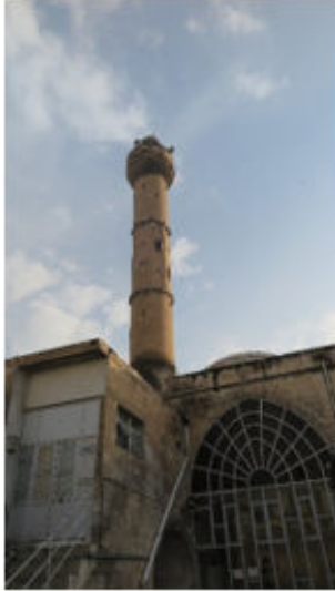
Yusuf Paşa Cami Kuzeyden Görünüş