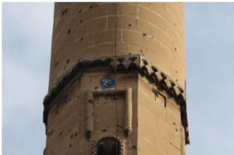
Yusuf Paşa Cami Minare Gövdesindeki Çini Yuvaları ve Bacini