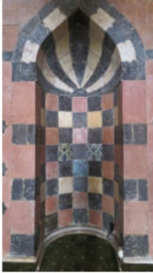
Ali Nacar Cami Mihrap Çinileri