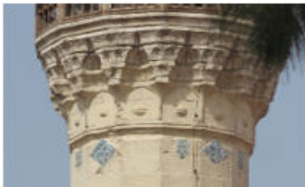
Bostancı Cami Minare Güney ve Güneydoğu Yöndeki Çiniler