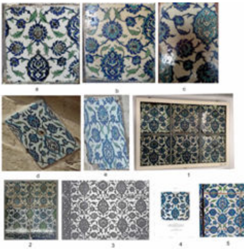
a-b: Ali Nacar Cami Mihrap Çinileri; c: Handan Bey Cami Mihrap Çinisi; d: Bostancı Cami Minare Çinileri; e: Ağa Cami Minare Çinisi

f: V&A Müzesi'nde Bulunan Şam Üretimi Çinileri; g: Metropolitan Müzesi'nde Bulunan Şam Üretimi Çinileri; h: Şam Süleymaniye Cami Harim Çinileri; i: Şam Selimiye Medresesi Çinileri (Mihrap'tan); j: Leighton House "Arab Hall" Bölümü Çinileri (Mihrap'tan); k: Şam Üretimi Çinileri