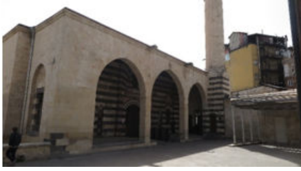
Handan Bey Cami Genel Görünüşü