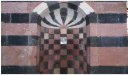
Handan Bey Cami Mihrabı ve Çini Karo