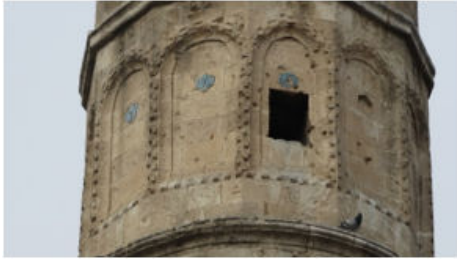
Dabakhane Cami Minaresinin İkinci Bölümündeki Çiniler