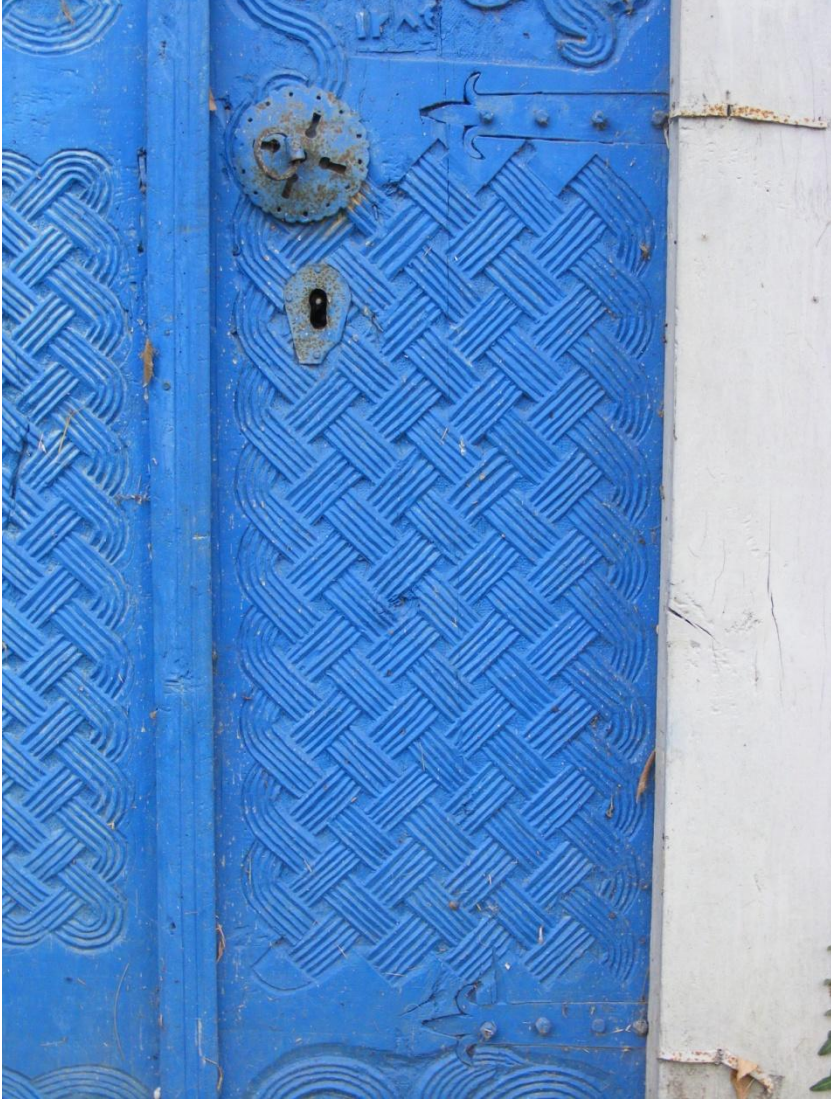
Resim 6: Ayvacık/Tiryakioğlu Camii'nin kuzey cephedeki giriş kapısından detay.