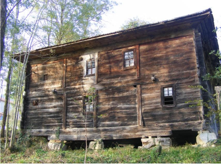
Resim 3: Ayvacık/Tiryakiođlu Camii'nin güney cepheden görünümü.