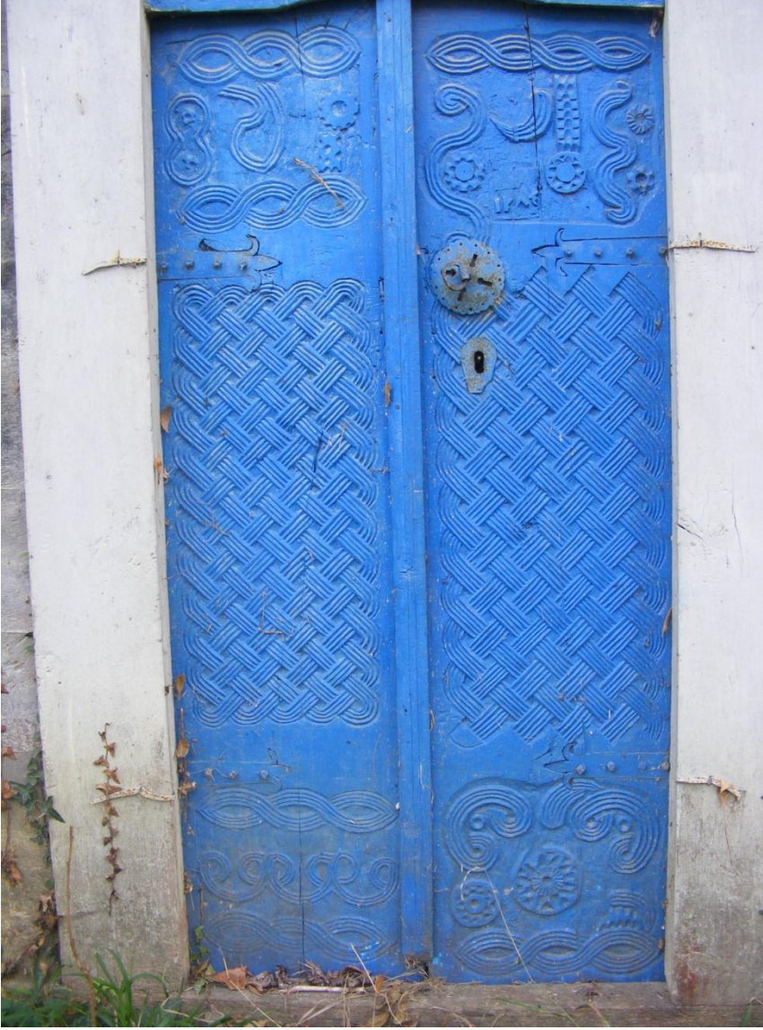
Resim 4: Ayvacık/Tiryakioğlu Camii'nin kuzey cephedeki süslemeli giriş kapısı.