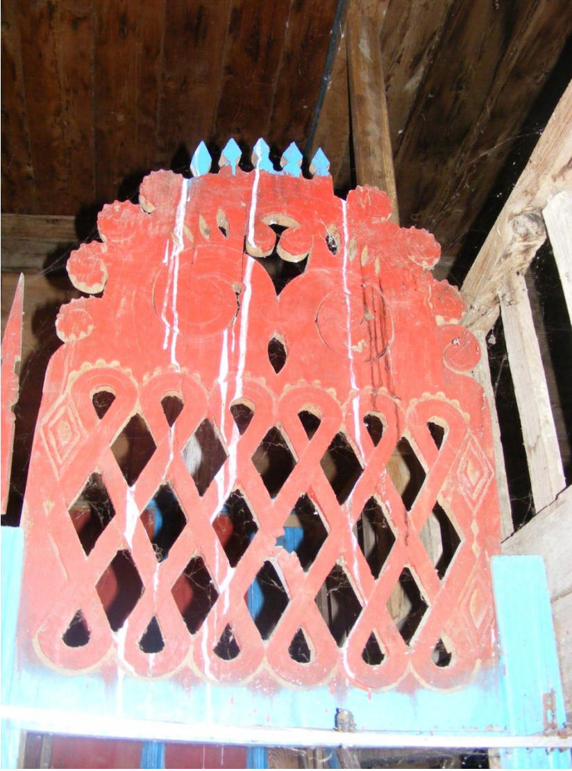
Resim 9: Ayvacık/Tiryakioğlu Camii'nin minber kapı tacındaki.