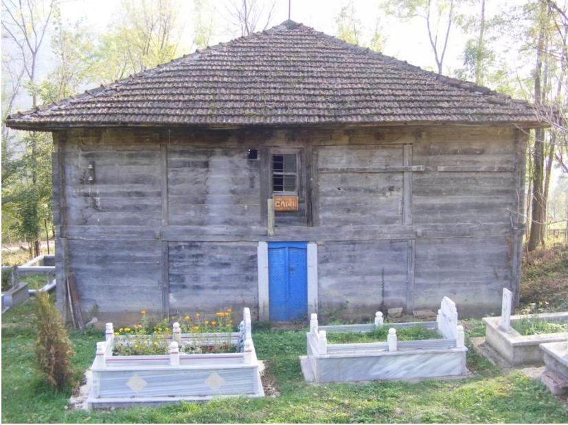
Resim 1: Ayvacık/Tiryakioğlu Camii'nin kuzey cepheden görünümü.