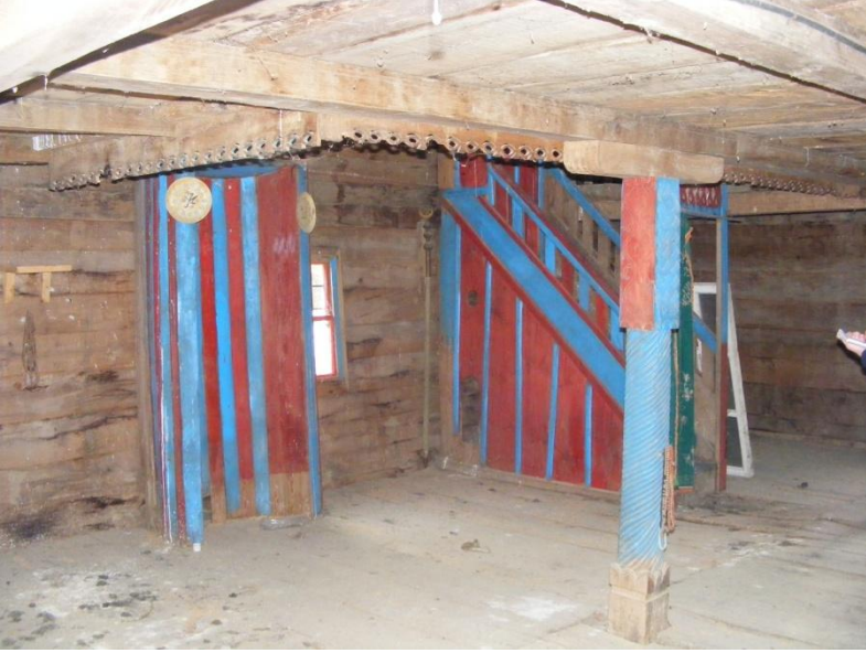
Resim 8: Ayvacık/Tiryakioğlu Camii'nin harimden görünümü.