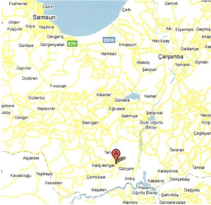
Harita 1: Google Maps'ten Tiryakioğlu Köyü