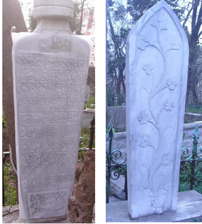
Resim 13- Kefeli-zade Hafız Ahmet Efendi'ye ait mezardaki baş ve ayak taşı şahidesi