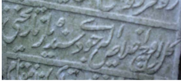
Resim 10- Muallim İbrahim Cdİ'nin mahlasından detay