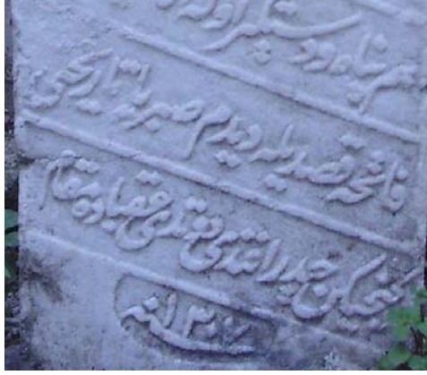
Resim 6- Sabri'nin kullandıđı mahlastan detay