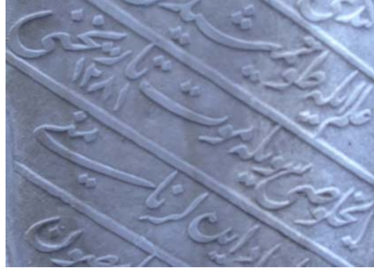
Resim 2- Hulusi'nin kullandığı mahlastan detay