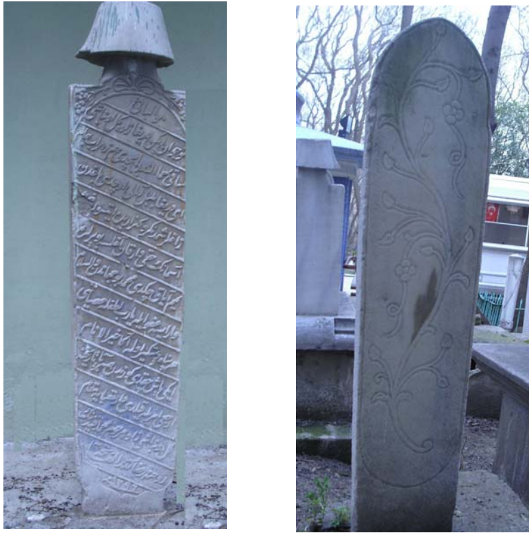
Resim 3- Kitabesi Sabri tarafından yazılan Kel OnbaŐı'ya ait mezarın baŐ ve ayak taŐı Őahideleri