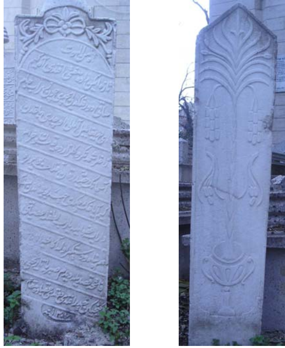
Resim 5- Kitabesi Sabri tarafından yazılan Müftü-zade Haydar Efendi'ye ait baş ve ayak taşı şahidesi