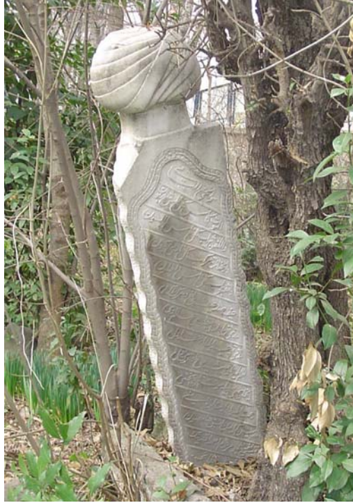
Resim 1- Kitabesi Hulusi tarafından yazılan Samsun Müftüsü Ahmet Efendi'ye' ait mezar taşı

la ehemmiyet gösterilmeden yer verilmiş olması, bu durumun bir göstergesi olarak değerlendirilebilir. Özellikle hat sanatı açısından mükemmel bir kitabe olarak telakki ettiğimiz Kefeli-zade'ye ait son örnekte, baş taşı şahidesi üzerinde, süslemeye hemen hiç yer verilmemiştir. Öyle görünüyör ki mezar taşı yapımında zamanla kitabe hattı ve muhtevası, süslemenin önüne geçmeye başlamış olmalıdır. Bu durumda kitabeyi yazan şairler de isimlerini, eserlerinde zikretmeye değer görmeye başlamıştır.