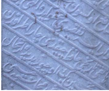
Resim 8- Tayyip-zade Hafız Zühdi Efendi'nin mahlasından detay