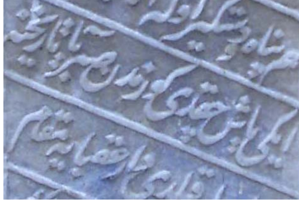
Resim 4- Sabri'nin kullandığı mahlastan detay