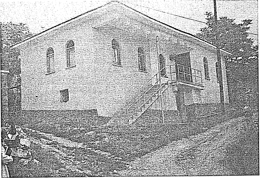
Res. 4. Hacıođlu Odası