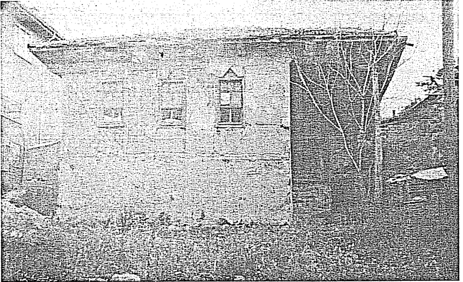
Res. 1. Yukarı Oda (Restorasyondan önce)

Yeđin, Abdullah, Yeni Lûgat , IV.Bsk., İstanbul 1983.