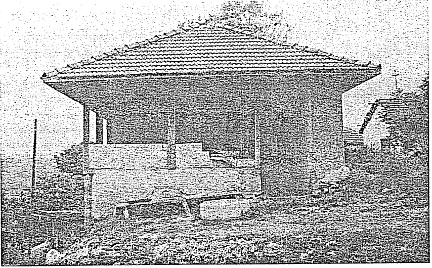
Res. 3. Aliğagilin Odası