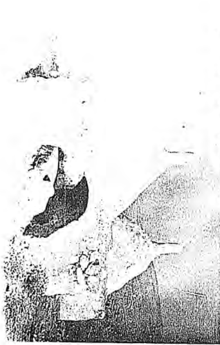
III -Hasan Bey Mezarlığında başka bir mezar tipi.Çilesiz,Nusaybin.