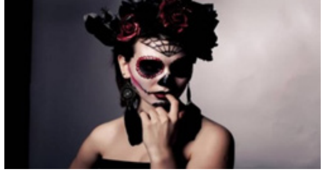
Şekil 5: Frida Kahlo