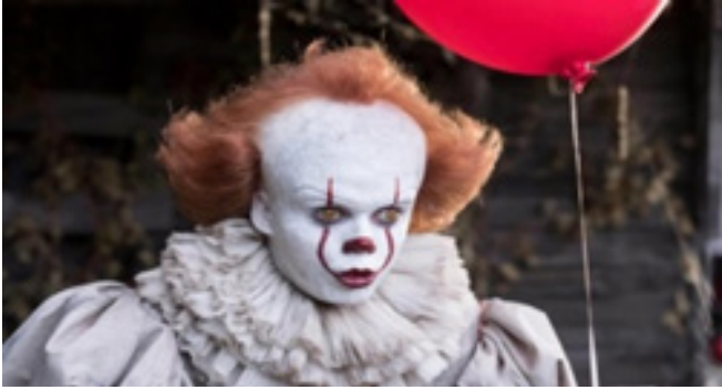
Şekil 3: Pennywise