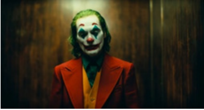
Şekil 2: Joker Kaynak: White, 2021