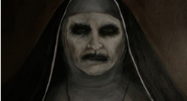
Şekil 4: Valac