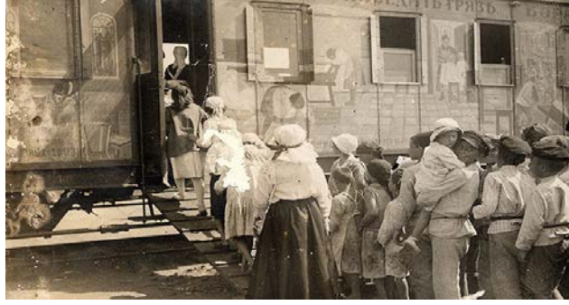
Şekil 1: “Oktyabrskaya Revolyutsiya” propaganda trenine ait bir fotoğraf, 1920 53

Ajit-trenler çeşitli seksiyonlardan oluşmaktaydı. Bunlar arasında en önemlisi, Kenez'in ajit-trenlerin “aklı ve kalbi” olarak tanımladığı siyasi seksiyondur. Çünkü bu seksiyon, ajit-trenin yürüteceği çalışmaları belirleyen ve gerekli iş dağılımını yapan birimdir. Seksiyonun başında aynı zamanda trenin de yöneticisi olan bir Siyasi Komiser bulunuyordu. 54 Trenin Siyasi Komiseri, Tüm Rusya Merkez Yürütme Komitesi tarafından atanıyor ve bu kişiler, Sovyet örgütlerinin çalışmalarına hâkim olan isimler arasından seçiliyordu. 55 Kenez, bu seksiyonda Parti Merkez Komitesi ve diğer komiserliklerden, Komsomol ve Çeka'dan 56 çok sayıda görevlinin yer alması sayesinde, acil kararlar alınıp uygulanabildiğine vurgu yapmıştır. Seksiyonun bir diğer vazifesi de yerel yöneticilere ihtiyaç duydukları yardımın sağlanmasıydı. 57 Wolmar, bu trenlerin, yıllarca hatta on yıllarca polis ve ordudan başka resmi bir temsilci görmemiş olan insanlar tarafından iktidarın doğrudan temsilcileri olarak görüldüklerini söylemiştir. 58 Gerçekten de devrimin henüz emekleme aşamasında olduğu ve henüz başkentte bile yönetim kadrosunun çekişme halinde olduğu, panik havasının kol gezdiği İç Savaş koşullarında devlet temsilcilerinin ajit-trenler vasıtasıyla sıradan halkın ayağına taşınması, büyük bir memnuniyetle karşılanmıştı. Yüzyıllar boyunca Sovyetler Birliği'nin en ücra köşelerinde toprak sahiplerinin kölesi olarak yaşamış, ihmal edilmiş ve hatta yok sayılmış olan halk,