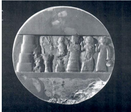
Figür 2: Enheduanna diski. 46