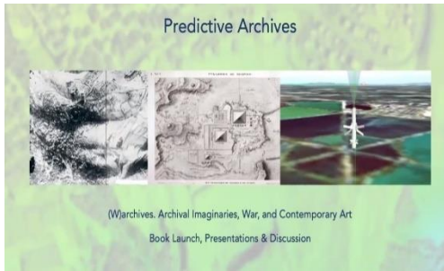
Görsel 1. Çevrim içi lansmana ait sunum görselinden bir örnek (Mozaik Odalar, 2021).

Kitabın en değerli tarafı ise, devletlerin ve halkların kendilerini adadıkları hatta çok ağır bedeller ödedikleri birçok savaşa yönelik arşivlerin yeniden sorgulanmaya ihtiyacı olduklarını özetleyen, özgün ve gerçekçi sanatçı üretimleri diye düşünüyorum. Özellikle de savaşın arşivlenmesi gibi -yani durağan bir yapı olmayıp arşivlemenin o sırada da devam etmekte olduğu- “canlı” bir arşivleme pratiğinin özgünlük, gerçekçilik ve hatta yeterlilik kavramları sorgulanıyor. Arşivsel uygulamaların ve de savaş arşivlerinin birçok yönden algısı ile ilgili de soru işaretleri yaratmayı başarıyor. Son olarak bir savaşı arşivlemede, savaş rejimlerinin boşluklarını ve sınırlılıklarını nasıl zorladıklarına dair sanatsal çalışmalarla hatta bizzat savaşa ait arşivsel malzemeye radikal denebilecek çalışmalara imza atıldığı ifade edilebilir.