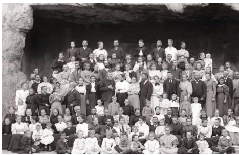
Görsel 2. Çevrim içi lansmanda Heba Y. Amin'e ait sunum görselinden bir örnek (Mozaik Odalar, 2021).