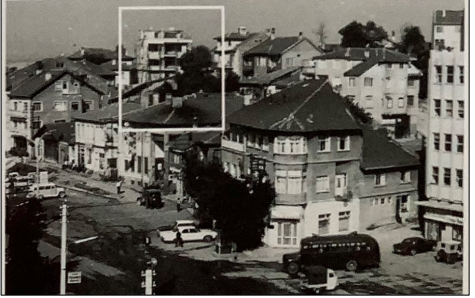
Fotoğraf 5. 1944 Depreminin Sonra Yıkılan Mescidin Yerine İnşa Edilen Apartmanın Görünümü. 1944 Yılı Sonrası.