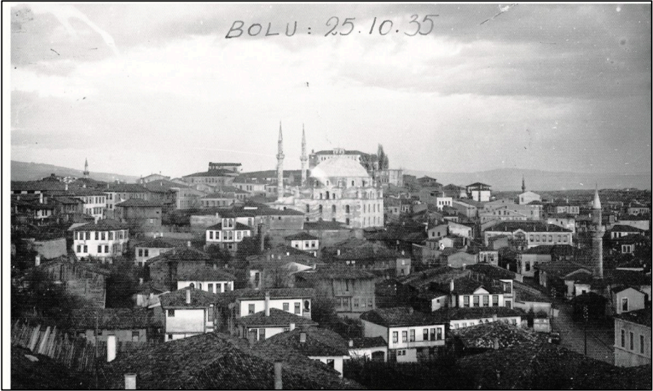
Fotoğraf 4. 1935 Yılı, Leylekler Camii Minaresinden Şehrin Doğusuna Bakış. Karşıda Yıldırım Bayezid Camii Görülmektedir. 25.10.1935.