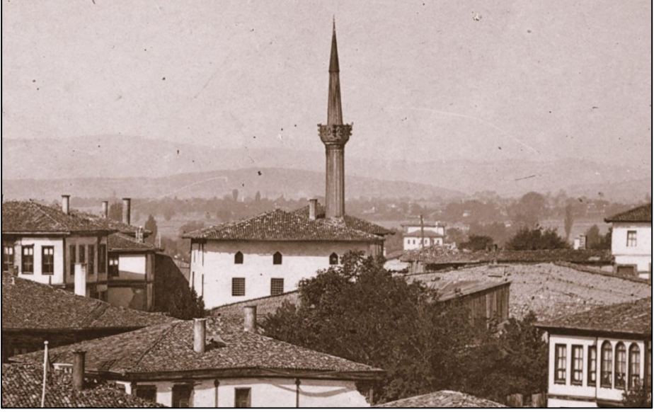
Fotoğraf 1. Ak Mescid'in Görünümü. 1944 Yılı Öncesi.