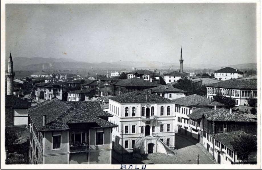
Fotoğraf 3. Sarayhane Camii Minaresinden Batıya Doğru Çekilmiş Fotoğraf. Önde Ortada Eski Belediye Binası, Sağda Üstte Ak Mescid (Leylekler Camii). 1937 Yılı.