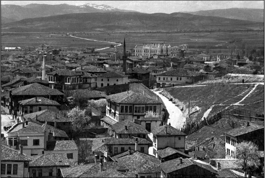
Fotoğraf 2. Ak Mescid Mahallesi ve Mescid'in Görünümü. 1944 Yılı Öncesi.