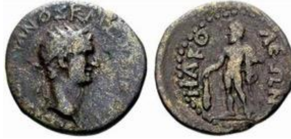
Resim 3: Ön yüzde taç takmış imparator Domitianus'un başı (solda), arka yüzde sol elinde aslan postu, sağ elinde sopasını tutan çıplak Herakles

( https://www.acsearch.info/search.html?id=225288 (Erişim: 02.07.2021))