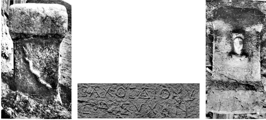
Resim 4: Olasılıkla bir Dionysos kültü rahibini gösteren stel.

olduğu ya da bu tespitin en azından Dionysos kültü için geçerli olduğu söylenebilmektedir. Üstelik aynı yazıtlarda bu rahiplerin bir çeşit lonca liderliği yaptıkları da görülmektedir ki bu durum, basit de olsa köylerdeki ekonomik örgütlenmenin din adamları çevresinde gerçekleşmiş olma olasılığını ortaya çıkarmaktadır. Dionysos'un kendisinin, loncanın lideri olarak ἀρχήβακχος unvanına sahip şekilde belirtilmesi bu düşüncüyü daha da güçlendirmektedir. 102