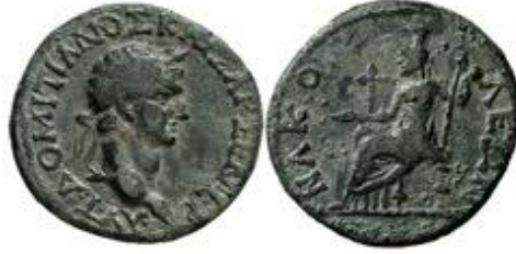
Resim 1: Ön yüzünde başında defneli tacı ile imparator Domitianus'un arka yüzde Nacolea adı ile birlikte elinde asasıyla tahtta oturan Demeter (ya da Hera)

Ağırlıklı olarak epigrafik malzemenin değerlendirileceği kaynaklar yanında, yeri geldiğinde, numizmatik buluntular ve (sınırlı da olsa) filolojik eserler de tartışmaya dahil edilecektir. Öncelikle filolojik eserlerin konu ile ilgili neredeyse hiç veri sağlamadığını belirtmek gerekmektedir. Bunun yanında sikkeler de yazıtlarla hemen hemen aynı yüzyılları kapsayan bir dönemde ortaya çıkmışlardır. Sikkeler açısından bakıldığında şu anki veriler ışığında en erken Dorylaion sikkeleri imparator Vespasianus döneminde (MS 69-79) görülmeye başlamış ve I. Philippus dönemine (MS 244-249) kadar sürmüştür. Nacolea sikkeleri ise, Domitianus (MS 81-96) ile başlayıp Gallienus döneminde (MS 253-268) sonlanmıştır. (Resim 1)