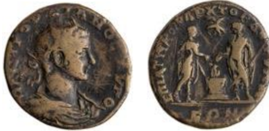
Resim 2: Ön yüzde (solda) Taç takmış imparator III. Gordianus'un başı, arka yüzde Dorylaion'un kurucuları Dorylaos ve Akamas'ın sunaktaki sunu törenleri

( http://numismatics.org/search/results?q=mint_facet:%22Dorylaeum%22 (Erişim: 02.07.2021))