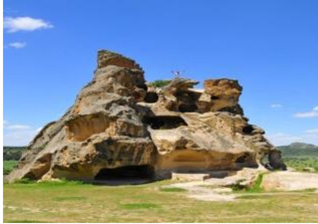
Resim 6: Kırkgöz kaya mezarı, Midas Kent (Yazılıkaya).