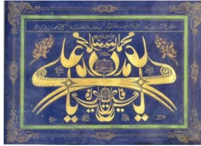
Görsel 18: Âl-i abâ adları ile oluşturulmuş levha, Seyid Ali, H. 1304 (M. 1886/1887), Nika Müzayedede A.Ş. Osmanlı ve Karma Sanat Eserleri Müzayedesi .