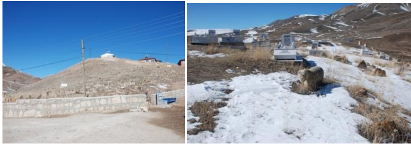
Görsel 1-2: Başköy Köyü mezarlığı genel görünüşü (sol: kuzey, sağ: güney) (Orijinal).

Başköy'de mezarlık ortadan geçen bir yolun böldüğü, kuzey-güney yönlerinde uzanan iki tepelik alan üzerinde yer almaktadır (Görsel 1-2). Bunlardan kuzeydeki daha küçüktür ve içindeki mezarlar oldukça harap durumdadır. Köylülerce 'Eski Mezarlık' olarak adlandırılan bu mezarlık diğerine göre daha dik uzanan bir tepelik şeklindedir. Güneydeki mezarlık ise daha geniş bir alana yayılmakta ve içinde çok sayıda mezar yapısını barındırmaktadır. Bu mezarlığın hemen üst tarafında Seyyid Hasan Efendi'nin türbesi yer almaktadır. Sonradan inşa edilen bu türbe bir ziyaretgâha dönüşmüş, özellikle şifa bulmak isteyen hastaların uğrak yeri olmuştur (Bezgin, 2019: 74-77, 147).