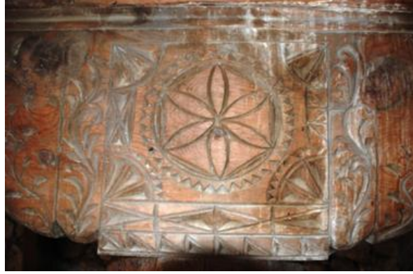
Görsel 28: Tüteklikli örtü sistemine sahip evde bir sütun başlığı (Orijinal).