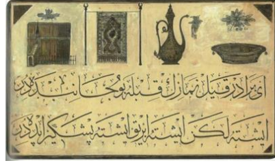
Görsel 15: İbrik, seccade, leğen gibi motifleri bir arada veren taşbaskı resim, Taşbaskısı Halk Resimleri Sergisi Resim ve Heykel Müzesinde (1958).

özellikle geç dönem Osmanlı dünyasında ibriklerin hem dini yapıların duvarlarında bir bezeme ögesi olarak kullanılması hem de camaltı, levha gibi el sanatları örneklerinde ve bazı matbuu eserlerde sıklıkla yapılmaları bunların bu devirde neredeyse sanatın her alanına sirayet ettiğini göstermektedir. Bunun başlıca nedeni ise ibrik ve leğenin Hz. Muhammed'den geriye kalan önemli eşyalar arasında yer almasıdır (Khomehyar, 2016, 407-412). Bu nedenle genellikle ibrikler cami, seccade ve leğenlerle birlikte yan yana veya tek başına yapılmışlardır (Görsel 15) 10 . Bazı örneklerde bunların içine "Allah" yazısı eklenmiştir 11 . Bu da ibriğin çoklu anlamlarla yüklendiğini ve halk tarafından kabul gördüğünü göstermektedir. Başköy Köyü mezarlarında ibriğin tek başına yapılmadığı ve daha çok leğen ya da mutfak gereçleri ile bir arada verildiği göz önüne alındığında bu motifin dönemsel bezeme anlayışı doğrultusunda üretildiği söylenebilir.