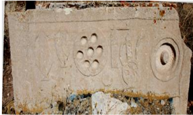
Görsel 19: Başköy Köyü mezarlığında yer alan bir mezar yapısı (Orijinal)

Bezemde tercih edilen motifler, bölgedeki mezar yapılarında sıkça gözlenen; bardaklı ve fincanlı tepsi, sürahiler (bazen biri küçük olmak üzere 2 tane), kahve değirmeni, tabancalar (bazı örneklerde birbirine paralel yerleştirilmiş 2 tane), leğen ve ibrik gibi muhtemelen sembolik nitelikli objelerdir. Objelerin farklı bakış açıları ile betimlendiği (muhtemelen en kolay şekilde tanımlanabilecekleri bakış açısı ile) görülmektedir. Örneğin; sürahi, ibrik gibi objeler cepheden, bardaklı tepsi ve leğen ise kuş bakışı bir görünümle betimlenmişlerdir. Tepsi üzerindeki fincanların ve leğenin derin oymalar şeklinde işlenmiş olması ilginçtir. Diğer önemli bir nokta ise bu betimleme anlayışının hemen hemen aynı dönemdeki matbu eserlerde de karşımıza çıkmasıdır (Görsel 20).