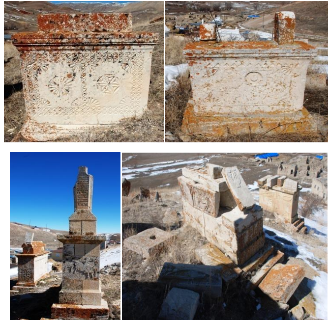
Görsel 5-6-7-8: Çeşitli bezemelere sahip mezar yapıları (Orijinal).

Üzerinde herhangi bir süsleme unsurunun görülmediği koç/koyun biçimindeki mezar yapısı dışında, diğer mezar yapılarında yoğun bir bezeme göze çarpmaktadır. Bezemelerde; silah, fişeklik, hançer, kılıç, ibrik, tarak, mızrak, leğen, tepside fincanlar veya bardaklar, binicili/binicisiz ve genellikle hareket halinde at, çarkıfelek, bitkisel ve geometrik bezemeler (ağaç, daire içinde çok kollu yıldızlar), çaydanlık, ay yıldız, Bektaşî yazı resimleri, mimari öğeler (konak, ev) gibi zengin bir motif dünyasına yer verilmiştir. Bunların terkinde ise belli bir şemanın izlendiği ve dönemsel olarak farklı uygulamalara gidildiği görülmektedir (Görsel 5-6-7-8).