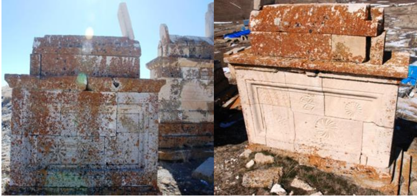
Görsel 22-23: Başköy Köyü mezarlığında yer alan mezar yapıları (Orijinal)

Başköy’de TİP-2 mezarlar arasında yer alan bir örnek ise özellikle bezemeye yaklaşım konusunda farklı bir eğilimi ortaya koymaktadır. Bu mezar yapısında da gövde kısmı farklı boyutlardaki kesme taş bloklardan oluşmakla birlikte, kullanılan taş bloklar diğer örneklere nazaran daha büyük ve az sayıdadır. Aynı zamanda, kuzey ve güney yüzlerinde kaval silmelerle kuşatılan göçertmeler oluşturulduğu ve böylelikle bütünlüklü bir betimleme alanı yaratılmaya çalışıldığı gözden kaçmamaktadır (Görsel 22-23).