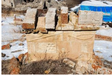
Görsel 21: Başköy Köyü mezarlığında yer alan bir mezar yapısı (Orijinal)

TİP-2’de süsleme ve motif çeşitliliği artmıştır. TİP-1’de karşımıza çıkan objeler yanında motif repertuarına binicili ya da binicisiz at ve bitkisel ya da geometrik dekoratif bazı unsurlar da eklenmiştir. TİP-2’de süsleme açısından en dikkat çekici gelişme ise silah betimlemelerinin sayıca ve çeşit olarak belirgin bir artış göstermesidir. Tabancaların yanında; hançerler, kılıçlar, tüfek, mızrak ve fişeklikler sıklıkla tercih edilen betimlemeler olarak karşımıza çıkmaktadır.