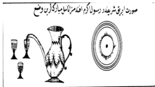
Görsel 20: Hz. Muhammed'in eşyaları arasında yer alan ibrik ve leğen, Muhammediye , 19. yüzyıl, SK Basma Bağışlar 3293.

TİP-2: Başköy'de bu tipolojideki mezarların tamamı güneydeki mezarlık alanında yer almaktadır. TİP-2 mezar tipolojisi; farklı boyutlardaki düzgün kesme taş blokların uzun bir kütle oluşturacak şekilde örülmüş olduğu bir yapı gösterir. Gövde kısmı bir veya birkaç sıra halindeki kaideler üzerine oturmuştur. Kaideler üzerinde genelde 3 sıra kesme taştan oluşan bir gövde ve bunun üzerinde de gövdeden çıkıntı yapan bir tabla yer alır. Tabla üzerinde ise yine kesme taş bloklardan sanduka formu bir kısım bulunmaktadır. Sandukanın batı ve doğu uçlarındaki oyuklara şahideler yerleştirilmiştir.