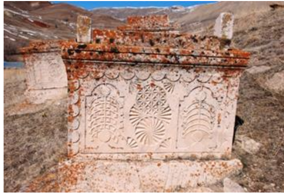
Görsel 13: Başköy Köyü mezarlığında yer alan bir mezar yapısı örneği (Orijinal).

Osmanlı'da mezar taşlarında servi, gül, nar ve hurma ağacı en sık karşımıza çıkan öğelerdir (Laqueur,1997: 130). Servi hem mezarlık ağacı oluşu hem de sembolik anlamlar barındırması bakımından doğrudan ölüm kültü ile ilgili bir ağaçtır (Cimilli, 2004: 225-235). Gül ise Hz. Muhammed ile ilişkili olduğu için mezar taşlarında sıklıkla kullanılmıştır (Laqueur,1997: 130). Yaşam ve ölüm sembolü olan hurma bol meyveleri ile yapınca bereketi bolluğu, nar ise üremeyi sembolize etmektedir (Laqueur,1997: 131). Başköy Köyü mezarlığında türü belli olmayan ağaçlar sıklıkla karşımıza çıkar. Nar ise bir mezarda yer almaktadır. Söz konusu ağaçlar meyvelerinin cinsi anlaşılmayacak bir biçimde oldukça stilize yapılmışlardır. Ancak bunların geç dönem matbu eserler içerisinde yer alan bazı cennet ağaçlarına benzerliği yine bunların kimi mezar taşlarında çifte yapıları da gözden kaçmamaktadır (Görsel 13-14). 8 Bu nedenlerle stilize edilmiş ağaçların ahiret yaşantısının bir izdüşümü olarak mezarlara konuldukları söylemek yanlış olmayacaktır. 9