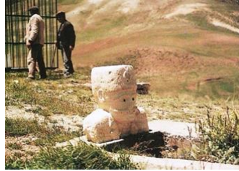
Görsel 4: Başköy Köyü mezarlığında yer alan insan biçimli şâhideye sahip mezar (Gündoğdu, 1997, 138).

Üzerinde herhangi bir süsleme unsurunun görülmediği koç/koyun biçimindeki mezar yapısı dışında, diğer mezar yapılarında yoğun bir bezeme göze çarpmaktadır. Bezemelerde; silah, fişeklik, hançer, kılıç, ibrik, tarak, mızrak, leğen, tepside fincanlar veya bardaklar, binicili/binicisiz ve genellikle hareket halinde at, çarkıfelek, bitkisel ve geometrik bezemeler (ağaç, daire içinde çok kollu yıldızlar), çaydanlık, ay yıldız, Bektaşî yazı resimleri, mimari öğeler (konak, ev) gibi zengin bir motif dünyasına yer verilmiştir. Bunların terkinde ise belli bir şemanın izlendiği ve dönemsel olarak farklı uygulamalara gidildiği görülmektedir (Görsel 5-6-7-8).