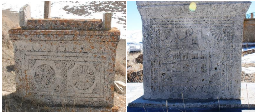
Görsel 26-27: Başköy Köyü mezarlığında yer alan TİP-3-A ve TİP-3-B mezar yapıları (Orijinal).

Bu iki alt grup arasında kullanılan taşın yapısı ve işçilik açısından da oldukça açık farklılıklar gözlenmektedir. Bu da, kronolojik farklılıkla birlikte yukarıda da değindiğimiz gibi farklı atölye-usta pratikleri çerçevesinde yorumlanabilir.