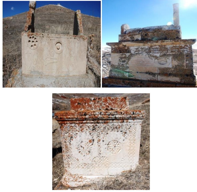
Görsel 9-10-11: Başköy Köyü mezarlığında yer alan TİP-1, TİP-2 ve TİP-3 mezar yapıları (Orijinal).