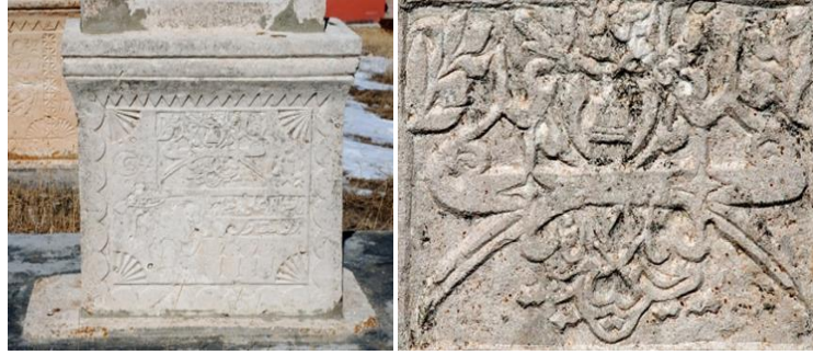
Görsel 16-17: Başköy Köyü mezarlığında yer alan 1940 tarihli bir mezar yapısı ve detayı (Orijinal).