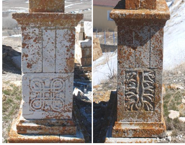
Görsel 24-25: Başköy Köyü mezarlığında yer alan mezar yapıları (Orijinal)

sermektedir. Batı ve doğu yüzlerinde bezemenin çok daha düzenli ve simetrik biçimde işlendiği açıktır. Bu mezar yapısının düzenleme, motif seçkisi ve dekoratif bir yaklaşımın gelişimi açısından TİP-3'te yer alan mezarların en azından bir bölümüne hakim olan anlayışın öncüsü olduğunu düşünmek mümkündür.