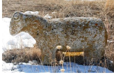
Görsel 3: Başköy Köyü mezarlığında yer alan koç/koyun biçimli mezar yapısı (Orijinal).