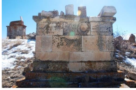
Görsel 12: Başköy Köyü mezarlığında yer alan bir mezar yapısı örneği (Orijinal).

Bugüne kadar yapılan çalışmalarda Erzincan'da yer alan tarihi mezar yapılarının tamamı çalışılmadığı, yakın bölgelerde yer alan mezarlarla ilişkisi ayrıntılı bir biçimde incelenmediği, yine bölgedeki tarihi mezar taşı atölyeleri/ustaları ile ilgili bir veri elimizde bulunmadığı için Başköy Köyü mezarlarının usta ya da atölyelerini tespit etmek şimdilik mümkün gözükmemektedir. Ancak yukarıda da değinildiği gibi teknik özelliklerinden dolayı mezarların farklı ellerden çıktığını söylemek mümkündür.