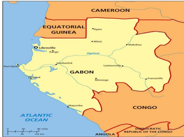
Harita I: Gabon Cumhuriyeti ve İdari Bölgeleri

Atlas Okyanusu kıyılarından içe doğru Kongo Havzası'na kadar uzanan bir bölgede yer alan Gabon, 267.667 km 2 'lik bir yüzölçümüne sahiptir. Ülke önemli nehlere sahip olmakla birlikte, en önemli nehri Ogowe'dir. Ülkenin başkenti ise Fransızca'da özgür şehir anlamına gelen Libreville olup, nüfusun çoğunluğu burada toplanmıştır. Afrika'nın en az nüfusa sahip ülkelerinden biri olan Gabon, 2021 tahminlerine göre 2 milyon 284 bin 914 civarında bir nüfusa sahip. Dahası, 9 il ve bu illere bağlı 37 ilçeden oluşan Gabon, harita I'de görüldüğü gibidir (The World Factbook 2021).