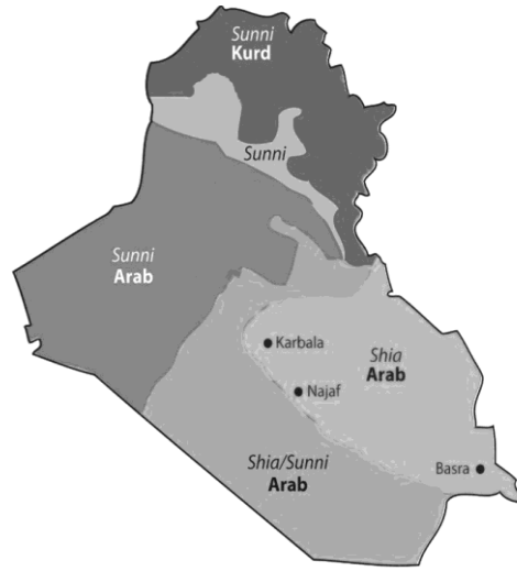
Harita 1: Irak Nüfusunun Etnik ve Dini Dağılımı 1

İran ile Irak arasındaki sorun alanlarına bakıldığında aslında bu sorunların temellerinin çok eski zamanlara dayandığı ve birbiriyle iç içe geçmiş, karmaşık bir yapı arz ettiği görülmektedir. Daha açıklayıcı olması amacıyla bu sorun alanları mezhepsel ve etnik faktörler, Şatt’ül Arap Su Yolu Sorunu ile bölgesel hegemonya mücadelesi olarak üç kategoride incelenecektir. Mezhepsel ve etnik faktörlere bakıldığında öncelikle mezhepsel açıdan Şii-Sünni konusunun İran-İrak Savaşı’na giden kriz sürecinde önemli bir etken olduğu görülmektedir. Haritada da görüldüğü üzere Irak’taki Şii gruplar ülkenin güneyinde, (Karbala / كربلاء) ve Necef (Najaf / النجف) gibi Şiiiler tarafından kutsal kabul edilen şehirlerin bulunduğu, Basra’yı da içerisine alan çok önemli bir petrol bölgesinde ikamet etmektedirler. Fakat ülke nüfusunun çoğunluğunu oluşturmalarına