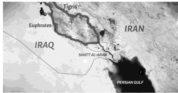
Harita 3: Şatt'ül Arap Su Yolu 3

İki devlet arasındaki sorun alanlarından bir diğeri ise Şatt'ül Arap (Arvand) Su Yolu Sorunu'dur. Haritada görüldüğü üzere Şatt'ül Arap Su Yolu, Fırat (Euphrates) ve Dicle (Tigris) nehirlerinin Basra Körfezi'nden denize dökülmeden önce birleştikleri yerdir. Buranın hangi kısmının hangi devlete ait olduğu konusundaki anlaşmazlık Osmanlı Devleti Dönemi'ne kadar dayanmaktadır. 1937 yılında iki devlet arasında bu konuda bir antlaşma yapılsa da İran, Irak'ın bu antlaşmadan çok kazançlı çıktığını düşündüğü için sorun devam etmiştir. (Özdemir, 2020: 58)