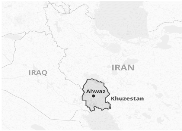
Harita 2: Kuzistan / Ahvaz Bölgesi 2

Etnik faktörlere bakıldığında ise Irak'ın kuzeyindeki Kürtlerin özellikle Cezayir Anlaşması (Algiers Accord)'nın imzalandığı 1975 yılına kadar İran tarafından yoğun şekilde desteklendiği görülmektedir. İran'ın sağladığı bu destek nedeniyle Irak hükümeti Kürtler üzerinde tam egemenlik sağlayamamış ve uluslararası arenada prestij kaybı yaşamıştır. Irak bu duruma son vermek için 1975'te İran ile Cezayir Anlaşması'nı imzalamak durumunda kalmıştır. Bu anlaşmayla Irak, Arapların Şatt'ül Arap (Shatt al-Arab / شط العرب), İranlıların ise Arvand Nehri (Arvand Rud / اروند رود) ismini verdiği su yolunda İran'ın istediği şekilde bir düzenleme yapılmasını kabul etmiştir. Buna karşılık İran da Kürtlere destek vermeyi bırakmıştır. Diğer yandan Irak'ın da İran'a yönelik olarak etnik ayrılıkçı hareketleri desteklediği görülmektedir. İran devletinin sınırları içerisinde yer alan ve Arapların Kuzistan / Huzistan (Khuzestan / خوزستان), İranlıların ise Ahvaz (أهواز) ismini verdiği bölgede yaklaşık 1.5 milyon civarında Arap yaşamakta ve Irak bu bölgenin özerk olmasını istemektedir. (Arı, 2017: 427) Hatta Saddam Hüseyin burayı "Arabistan" olarak isimlendirmiştir. (Doğan, 2016: 3)