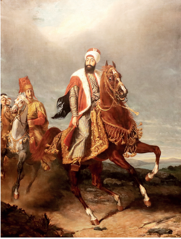
15 Hippolyte Dominique Berteaux, Sultan II. Mahmud , 1890 civarı, tuval üzerine yağlıboya, 147.5 x 110 cm, Env. No. 121/61