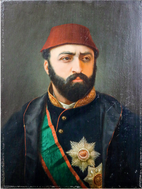
13 Stanislaw Chlebowski, Sultan Abdülaziz , ahşap üzerine yağlıboya, 41 x 31 cm, Env. No. 121/107

Polonyalı ressam Stanislaw Chlebowski (1835-1884), Keçecizade Fuad Paşa'nın (1815-1869) daveti üzerine 1864 yılı sonlarında İstanbul'a gelmiştir. Fuad Paşa, Padişah ile Abdullah Biraderler'i ve Stanislaw Chlebowski'yi tanıştırmak için sarayın resim ve fotoğraf sanatına olan ilgi ve desteğinde önemli rol oynamıştır. Chlebowski, yaptığı resimlerle sarayın beğenisini kazanmış ve 1870'te saray resamlığına getirilmiştir. Görevini 1870-1872 yılları arasında sürdürmüştür. Stanislaw Chlebowski'nin Sultan Abdülaziz'i yarım boy portre olarak betimlediği bir tablosu vardır. (Resim 13) Padişah'ın siyah üniforması, göğsündeki iki nişanı ve göğsünü saran yeşil renkli hamâili, resimdeki dikkat çekici öğelerdir. Sol alt köşede, 1866 tarihi görülmektedir. Yine Chlebowski imzalı başka bir tabloda, Sultan ayakta durur vaziyettedir. Solda havuz benzeri bir mekân vardır. Padişah'ın sol ayağı bir adım öndedir ve elinde kılıç tutmaktadır. Padişah'ı başında fesi, göğsünde nişanları ve yeşil hamâili ile resmeden bu eser, diğer tablolarla benzeşmektedir. 1867 tarihli resmin arka planında Sultan'ın beyaz atı ve bir seyis görülmektedir.