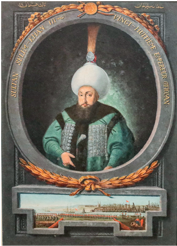
6 Kapıdağlı Konstantin, Sultan III. Selim , 19. yüzyıl, kâğıt üzerine karışık teknik, 38 x 26.5 cm, Env. No. 121/97

verip portresini yaptıran ve diplomasi gereği dağıtılmak üzere bastırılan ilk Osmanlı sultanı olmuştur. Kapıdağlı, padişah portreleri dizisini Veronese serisindeki gibi büst değil, yarım boy vermiştir. (Resim 6) Osmanlı padişah portreciliğine Avrupa ikonografisiyle yenilikler getirmiştir. Padişah portrelerinin geleneğe uygun oturma pozisyonunda yerine ayakta verilmesi, portresi yapılan kişinin karşıdan gösterilmesi, portrelerin altında şerit manzaraların ya da sahnelerin olması ve padişahların 3/4 profilden resmedilmesi gibi yenilikler yapmıştır. Portrelerin yüzündeki doğal ifade ve başarılı mekân kurgusu dikkat çekmektedir. Ressam Konstantin, Sultan III. Selim'in resimlerini yapmış ve Topkapı Sarayı'na 18. yüzyıl sonlarında yapılan duvar resimlerinin yapımında çalışmıştır. Eserleri birçok yerli ve yabancı ressam tarafından kopyalanmıştır. Koleksiyondaki III. Selim'in büst portrelerinden biri, Jean-François Duchateau'ya atfedilmektedir. Diğeri ise İtalyan ressam Andrea Appiani'ye aittir. (Resim 7)