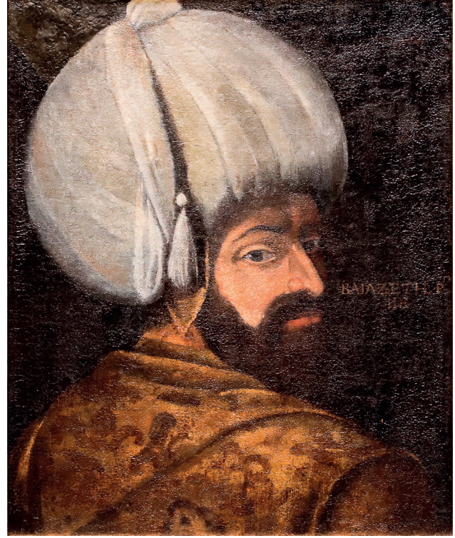
1 Veronese Atölyesi, Sultan Yıldırım Bayezid , 16. yüzyılın son çeyreği, tuval üzerine yağlıboya, 64 x 55 cm, Env. No. 121/5

Fatih'in oğlu Sultan II. Beyazid'in döneminde ilk silsilenâme hazırlanmıştır. Padişah portreciliği, 16. ve 18. yüzyıllarda da gelişimini sürdürmüştür. Nigârî mahlaslı Haydar Reis, Kanuni ile oğlu II. Selim dönemlerinde saray nakkaşlığı yapmıştır. Nigârî ve diğer Osmanlı nakkaşlarının yaptığı Kanuni portreleri de Avrupalı ressamların yaptığı padişah portreleriyle benzeşmektedir. Barbaros tarafından 1574 yılında Marsilya'ya götürülen ve Fransa donanma komutanı Virginio Orsini'ye hediye edilen yarım boy minyatür padişah portrelerinin, Avrupa'ya giden ilk padişah portreleri olduğu bilinmektedir. Nigârî tarafından yapıldığı kabul edilen bu portreler, Avrupadaki gravür padişah portrelerine örnek olmuştur.