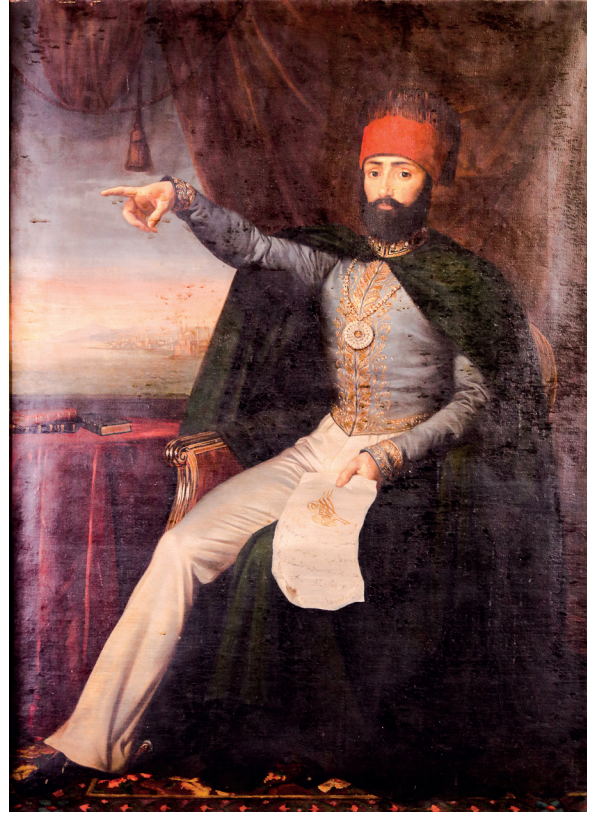
8 Anonim, Sultan II. Mahmud , 19. yüzyıl ortaları, tuval üzerine yağlıboya, 198 x 144 cm, Env. No. 121/115

1841-1870 yıllarında etkin olduğu bilinen Rupen Manas'ın kardeşi Sebuhan Manas (1816-1889),