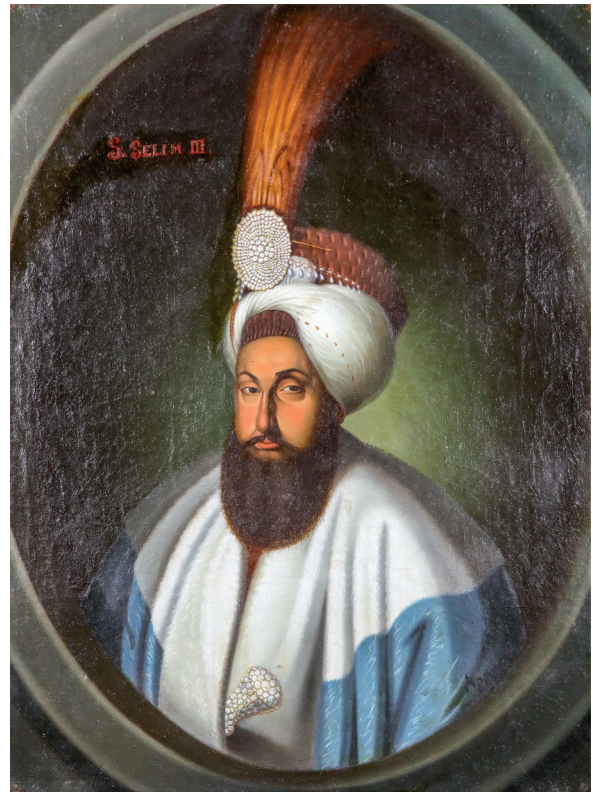
7 Andrea Appiani, Sultan III. Selim , 1807, tuval üzerine yağlıboya, 75 x 55 cm, Env. No. 121/960