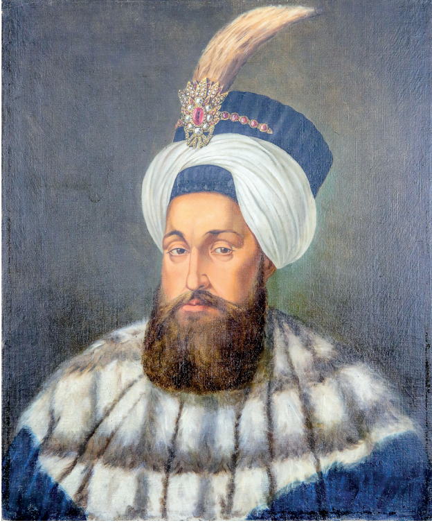
11 Şükrü, Sultan III. Selim , 1872-1873, tuval üzerine yağlıboya, 72 x 59 cm, Env. No. 121/49