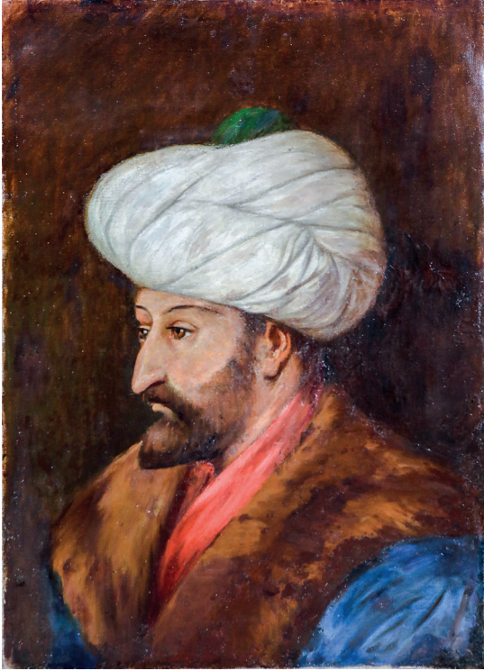
19 Halil Paşa, Fatih Sultan Mehmed , 20. yüzyıl, tuval üzerine yağlıboya, 61 x 43 cm, Env. No. 121/954

Sultan V. Mehmed Reşad ve VI. Mehmed Vahideddin dönemlerinde padişah portreciliği geleneği devam etmiştir. Sultan V. Murad'ın portresini Ayvazovski yapmıştır. (Resim 20) Sultan II. Abdülhamid'den sonra tahta çıkan Sultan V. Mehmed Reşad, kendisinin ve geçmişteki padişahların portrelerini içeren büyük boyutlu renkli baskılar yaptırmıştır. Avusturyalı ressam Wilhelm Krausz, Sultan V. Mehmed Reşad'ın yağlıboya portrelerini yapmıştır. (Resim 21)