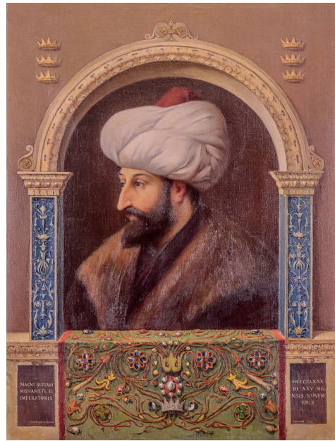
17 Fausto Zonaro, Fatih Sultan Mehmed , 1907, tuval üzerine yağlıboya, 101 x 5.5 cm, Env. No. 121/65

Koleksiyonda (Şehit) Hasan Rıza imzalı padişah resimleri de mevcuttur. Bunlardan biri, Fatih Sultan Mehmed'i tarama tekniğiyle oval bir form içinde cepheden betimlemiştir. Fizyonomik olarak erken dönemdeki Fatih portrelerinden biraz farklıdır. Sultan II. Abdülhamid döneminin saray ressamı İtalyan Fausto Zonaro'nun da bir Fatih Sultan Mehmed portresi vardır. (Resim 17) Halil Paşa ise V. Murad'ın torunu Rukiye Sultan'ın eşi Şerif Abdülmecid'in siparişi üzerine padişah portreleri yapmıştır. Bunlardan birinde, Sultan III. Selim'i bir terasta, arka planda Boğaziçi manzarası içinde betimlemiştir. (Resim 18) Ayrıca Gentile Belini'nin resmindeki fizyonomiye benzeyen bir Fatih portresi vardır. (Resim 19) Sanatçının II. Mahmud resmi ise Batı ikonografisine uygun olarak, arka planda bir perdenin arasından görülen manzarayla tamamlanmıştır. Sultan'ın giyimi ve fizyonomisi, sanatçının diğer portreleriyle benzeşmektedir.