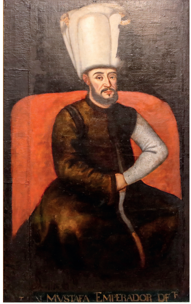
3 İspanyol bir ressama atfedilir, Sultan I. Mustafa , 17. yüzyıl, tuval üzerine yağlıboya, 158 x 94.5 cm, Env. No. 121/389

Flaman asıllı Fransız ressam Jean-Baptiste van Mour, 17. yüzyılın sonunda geldiği İstanbul'da, 1737 yılındaki vefatına kadar kırk yıla yakın yaşamıştır. Sultan III. Ahmed'in portrelerini, elçi kabullerini ve İstanbul'un çeşitli görünümünü resmetmiştir.