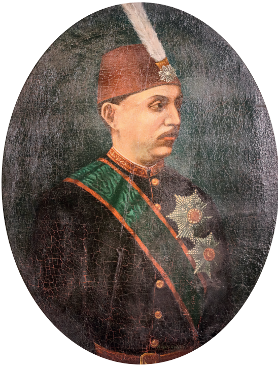
20 İvan Konstantinoviç Ayvazovski, Sultan V. Murad , 1876, tuval üzerine yağlıboya, 72 x 57 cm, Env. No. 121/123

Ermeni asıllı Antranik Efendi, sarayın siparişleri üzerine padişah portreleri resmetmiştir. Sanatçı, Sultan V. Murad, Sultan II. Abdülhamid, Sultan V. Mehmed Reşad, Sultan Vahideddin ve Halife Abdülmecid Efendi'nin portrelerini yapmıştır. Koleksiyondaki imzasız, fildişi padişah portreleri dizisi de Antranik'e atfedilmekte olup 1922 tarihlidir. Feyhaman Duran'ın da 1950-1960 civarına tarihlenen Fatih Sultan Mehmed portresi bulunmaktadır.