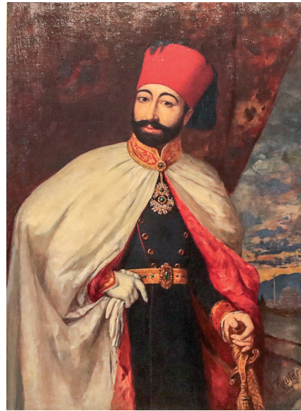
14 Wilhelm Reuter, Sultan II. Mahmud , 19. yüzyıl sonu, tuval üzerine yağlıboya, 117 x 87 cm, Env. No. 121/136

Sultan II. Abdülhamid yerli ve yabancı ressamalara önceki padişahların yağlıboya portrelerini yaptırmıştır. Alman ressam Wilhelm Reuter'e Sultan II. Mahmud'un portrelerini, (Resim 14) Fransız ressam Hippolyte Berteaux'a ise Sultan II. Mahmud (Resim 15) ile III. Selim'i (Resim 16) at üzerinde gösteren portrelerini sipariş etmiştir. Yavuz Sultan Selim'in 19. yüzyılın ikinci yarısına tarihlendirilen portresi anonimdir. Bu portreye, Padişah'ın kendi döneminde yapılan tek portresi olan Alman sanatçı Erhard Schoen'in ağaç baskı portresi kaynaklık etmiştir.