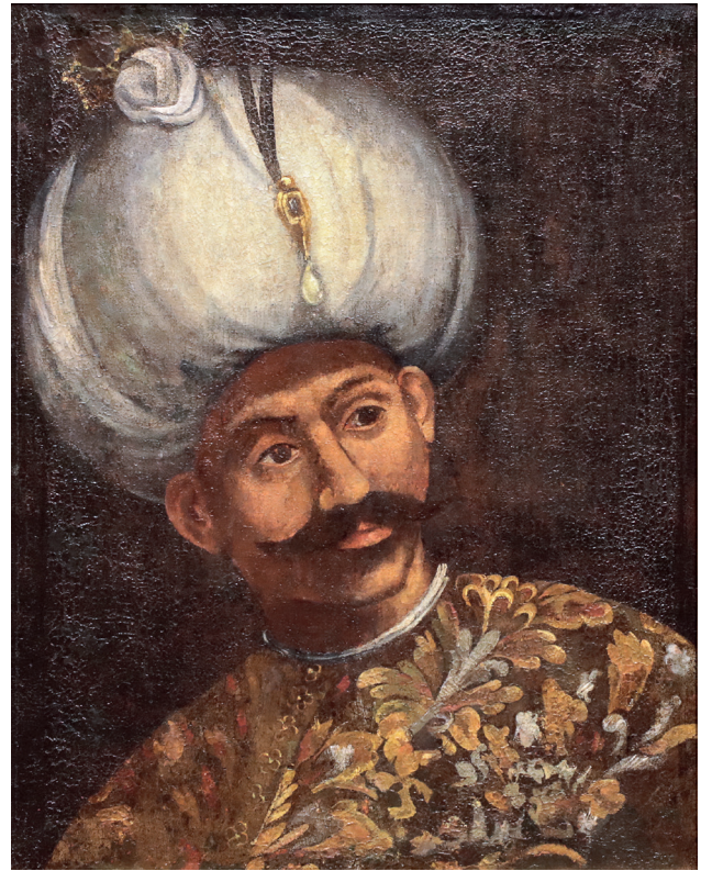
2 Veronese Atölyesi, Orhan Gazi , 16. yüzyılın son çeyreği, tuval üzerine yağlıboya, 67 x 54 cm, Env. No. 121/2

Koleksiyondaki en eski tarihli padişah portreleri Paolo Veronese'ye (1528-1588) veya atölyesine atfedilen, Veronese serisine ait, 16. yüzyılın son çeyreğine tarihlenen bir grup büst portredir. (Resim 2) Bu portrelerde padişahlar, gerçekçi olmayan kıyafetler ve başlıklarla resmedilmiştir. Bunların, Sultan III. Murad döneminde hazırlanan Şemâilnâme 'de yer alacak padişah portrelerine örnek olmak üzere Sadrazam Sokullu Mehmed Paşa aracılığıyla Venedik balyosu Niccolo Barbarigo'dan (1534-79) istenen ve 1579 yılında Venedik'ten İstanbul'a gönderilen portreler olduğu düşünülmektedir. Koleksiyonda Veronese serisi portrelerin tam dizisi bulunmamaktadır. Bu portrelerden bazıları, satın alma yoluyla koleksiyona sonradan katılan geç dönem kopyalarıdır. Veronese serisi portrelerinin tek tam dizisi, Münih'tedir.