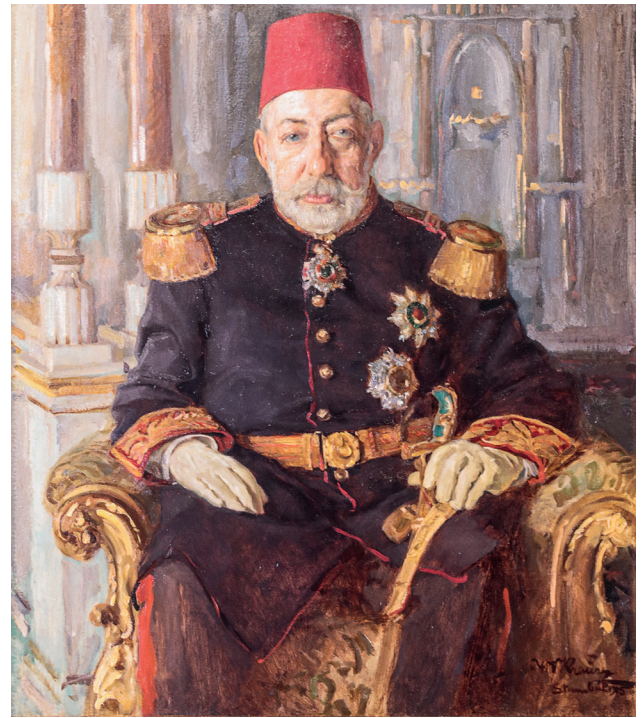
21 Wilhelm Victor Krausz, Sultan V. Mehmed Reşad , 1915, tuval üzerine yağlıboya, 98.5 x 85 cm, Env. No. 121/785