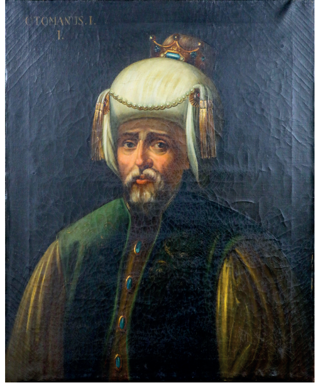
10 Anonim, Sultan I. Osman , 19. yüzyılın ikinci yarısı, tuval üzerine yağlıboya, 84 x 68 cm, Env. No. 121/33

1839 yılında Tanzimat'ın ilan edilmesinin ardından yeni bir döneme girilmiştir. Sultan Abdülmecid, poz vererek portresini yaptırmıştır. İngiliz ressam Sir David Wilkie, 1840 yılının Ekim ayında İstanbul'a gelmiştir. Padişahın portresini yapmak için izin almıştır. Padişah, Wilkie'ye ilk kez 12 Aralık 1840'ta resmî giysileriyle bir kanepede otururken poz vermiştir. (Resim 9) Bu poz, padişahın kendi tercihidir. Padişah, sanatçıya dört seansa ikişer üçer saatlik pozlar vermiştir. Sanatçı, Padişah'ın portresini İngiltere Kraliçesi Victoria'ya hediye etmeyi planlamış, Padişah da bunu uygun görmüştür. Ancak, Sultan Abdülmecid portreyi çok beğenmiş ve aynı portreden bir tane de kendisine istemiştir.