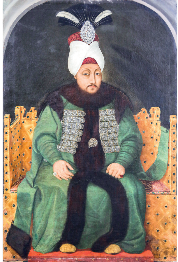
5 Rafael Manas, Sultan III. Mustafa , 18. yüzyılın ikinci yarısı, tuval üzerine yağlıboya, 157 x 100 cm, Env. No. 121/20