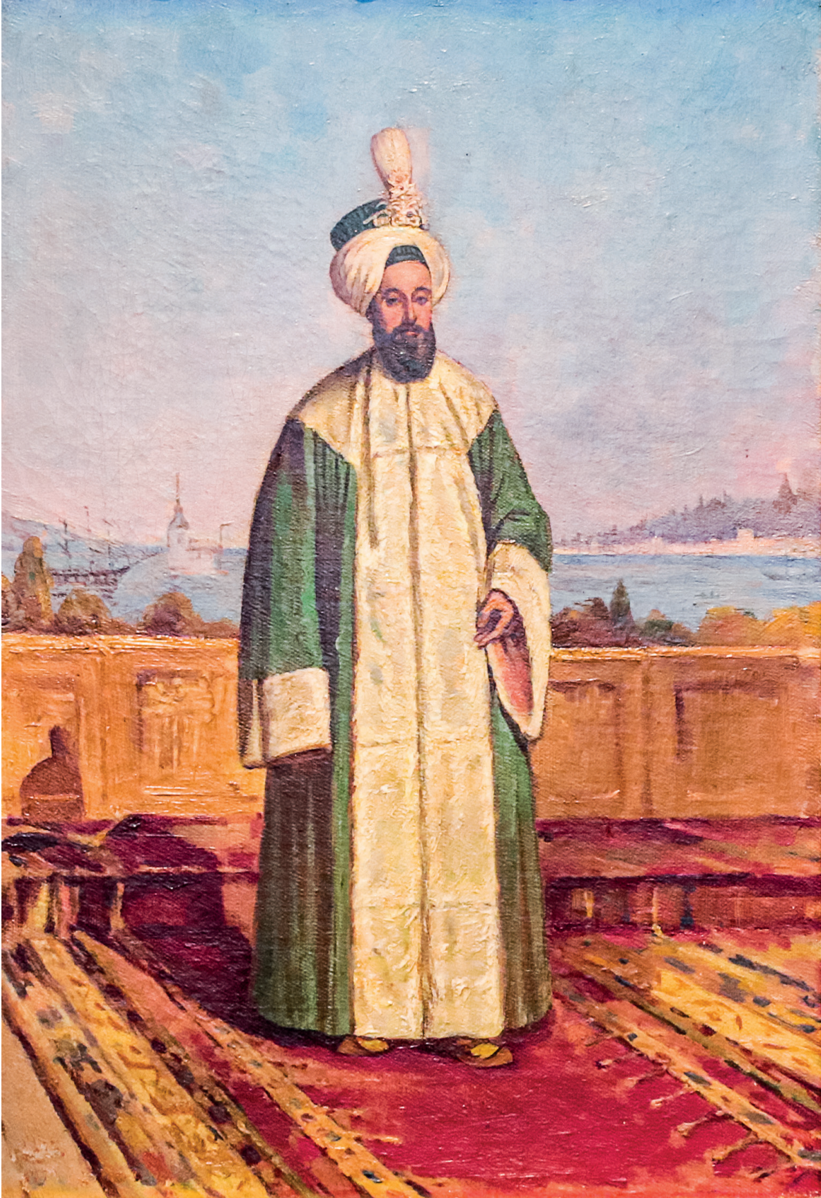
18 Halil Paşa, Sultan III. Selim , 20. yüzyıl, tuval üzerine yağlıboya, 41 x 27 cm, Env. No. 121/956