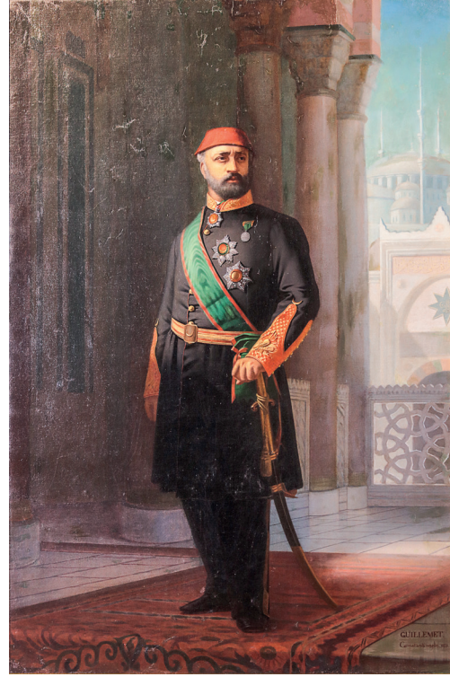
12 Pierre-Désiré Guillemet, Sultan Abdülaziz , 1873, tuval üzerine yağlıboya, 143 x 94.5 cm, Env. No. 121/943

portrelerinin dışındakiler aynı boyutlardadır. Sultan I. Abdülhamid, III. Selim ve Abdülmecid'in portrelerinde isim yoktur. Restorasyon sonrasında, III. Selim portresinin Şükrü imzalı ve 1872-1873 tarihli olduğu görülmüştür. (Resim 11) Bu yüzden üçü ayrı değerlendirilebilir. Sultan II. Mahmud ve Sultan Abdülmecid'in portrelerinin fizyonomilerinin gerçekçi bir şekilde ele alındığı görülmektedir. Portrelerin bazıları Kapıdağlı serisinden, bazıları da padişahların Avrupa baskısı portrelerinden örnek alınmıştır. Sultan III. Mehmed portresi, Pietro Bertelli'nin 1599 tarihli gravürünü kaynak almıştır. Sultan III. Murad portresinin de J. J. Boissard'ın T. de Bry için gravürlediği, 1596'da Frankfurt'ta basılan Vile el Icones Sullanorum Turcicarum adlı kitaptaki III. Murad'ın büst portresi ile yakın benzerliği bulunmaktadır. 3 Sultan IV. Mehmed'in çeşitli sanatçılar tarafından portreleri yapılmıştır. Avrupada da bazı padişahların gravür