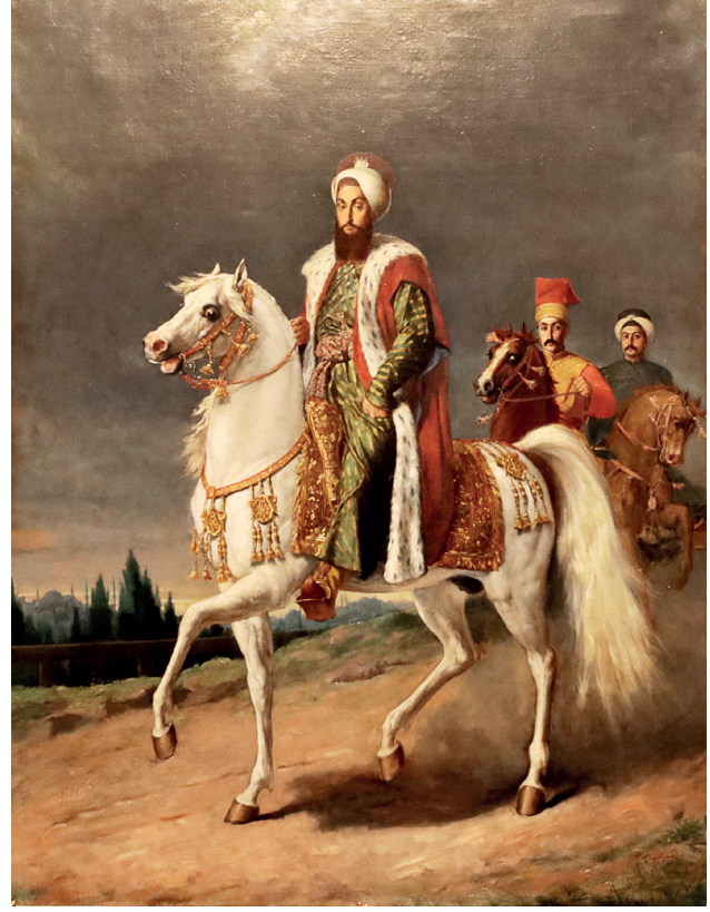
16 Hippolyte Dominique Berteaux, Sultan III. Selim , 1890 civarı, tuval üzerine yağlıboya, 144 x 108 cm, Env. No. 121/59

Koleksiyonda (Şehit) Hasan Rıza imzalı padişah resimleri de mevcuttur. Bunlardan biri, Fatih Sultan Mehmed'i tarama tekniğiyle oval bir form içinde cepheden betimlemiştir. Fizyonomik olarak erken dönemdeki Fatih portrelerinden biraz farklıdır. Sultan II. Abdülhamid döneminin saray ressamı İtalyan Fausto Zonaro'nun da bir Fatih Sultan Mehmed portresi vardır. (Resim 17) Halil Paşa ise V. Murad'ın torunu Rukiye Sultan'ın eşi Şerif Abdülmecid'in siparişi üzerine padişah portreleri yapmıştır. Bunlardan birinde, Sultan III. Selim'i bir terasta, arka planda Boğaziçi manzarası içinde betimlemiştir. (Resim 18) Ayrıca Gentile Belini'nin resmindeki fizyonomiye benzeyen bir Fatih portresi vardır. (Resim 19) Sanatçının II. Mahmud resmi ise Batı ikonografisine uygun olarak, arka planda bir perdenin arasından görülen manzarayla tamamlanmıştır. Sultan'ın giyimi ve fizyonomisi, sanatçının diğer portreleriyle benzeşmektedir.