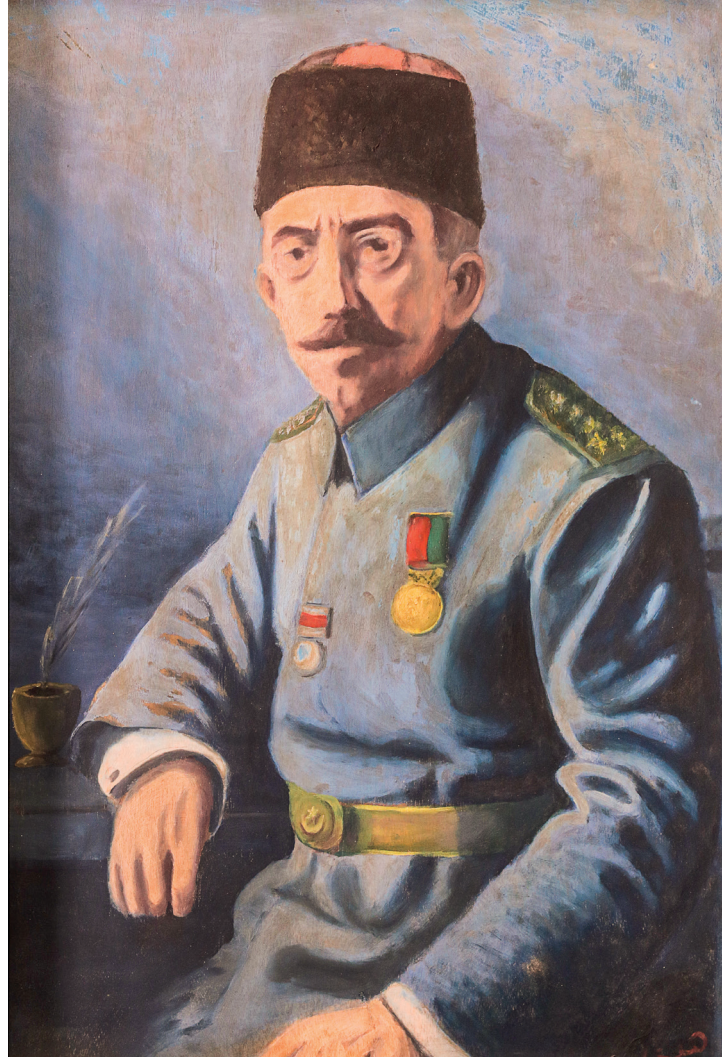
22 Hüsni, Sultan VI. Mehmed Vahideddin , 20. yüzyıl, ahşap üzerine yağlıboya, 57 x 40 cm, Env. No. 12/4481