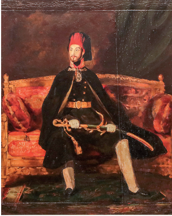
9 David Wilkie, Sultan Abdülmecid , 1840, ahşap üzerine yağlıboya, 71 x 56 cm, Env. No. 121/120

Ermeni asıllı Abdullah Biraderler'in (Abdullah Frères) Osmanlı fotoğraf sanatında önemli bir yeri bulunmaktadır. Kardeşlerden Viçen Abdullah, Müslüman olarak Abdullah Şükrü adını almıştır. Sanatçı, sedef ve fildişi üzerine yaptığı portrelerle de ünlüdür.