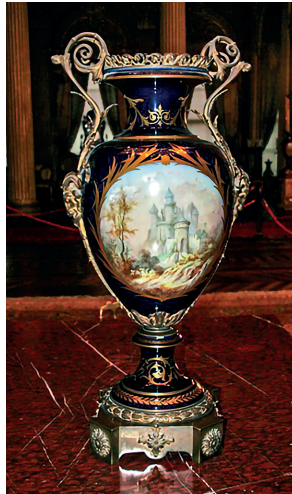
16 Vazo, Dolmabahçe Sarayı, Env. No. 11/558.