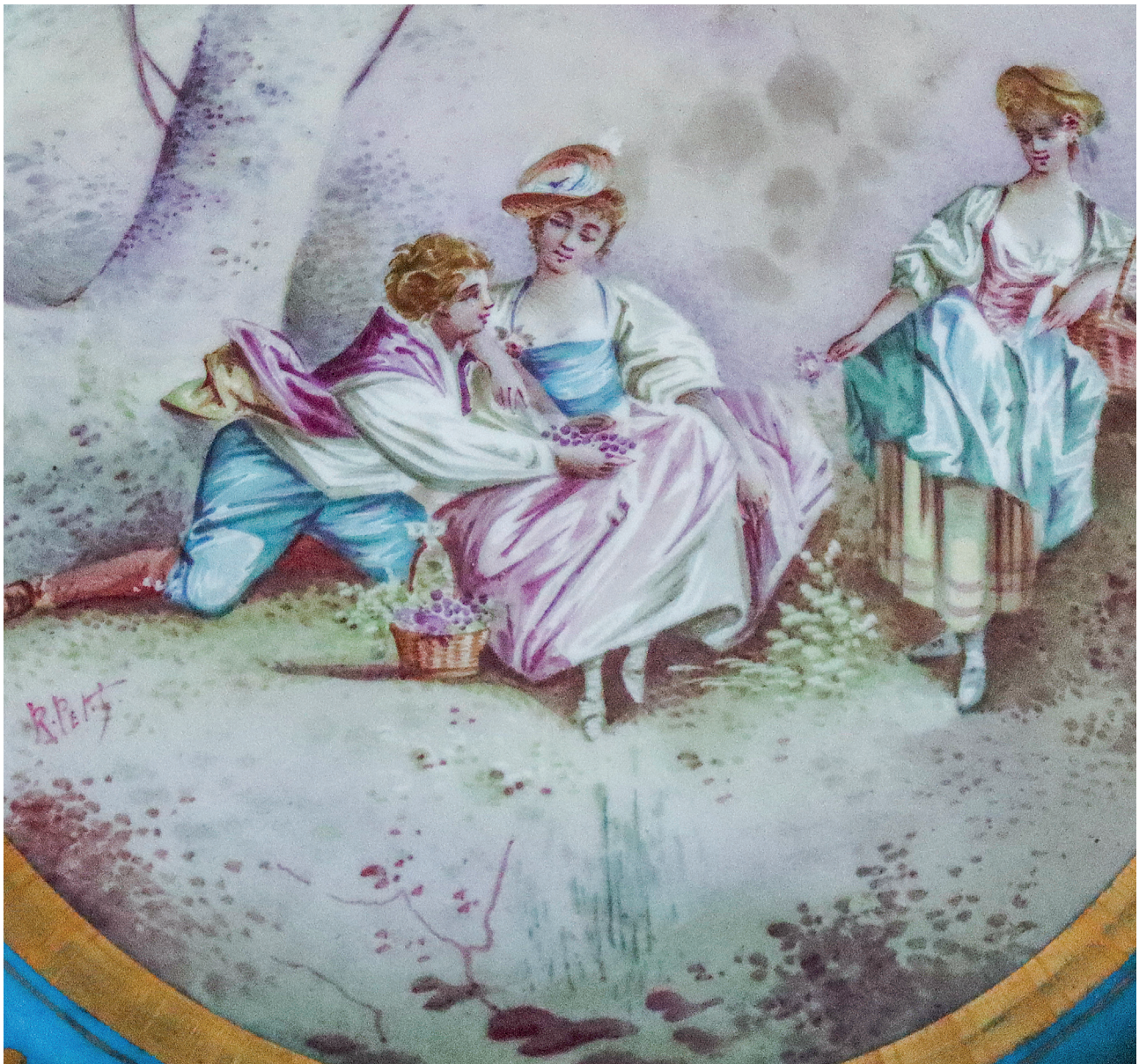
29 Tabak detayı, Topkapı Sarayı, Env. No. 26/4399.