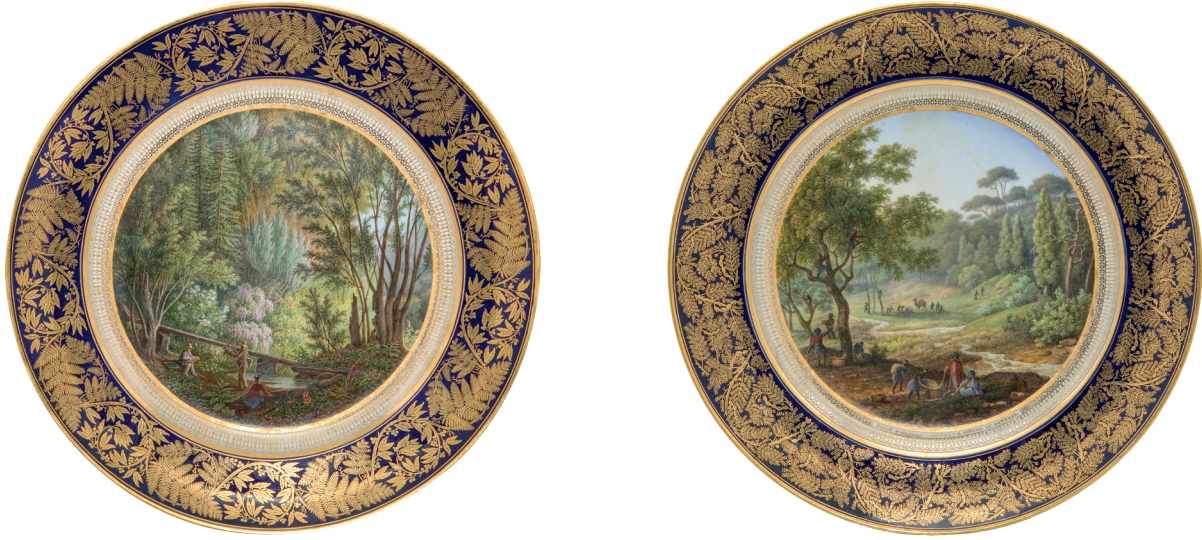
1-2 Louis Philippe damgalı Sèvres porseleni tabaklar, Topkapı Sarayı, Env. No. 26/4983, 26/4964.

Brogniart bir hata yaparak sert porselen üretimine geçmeden önce fabrika ambarlarında dekorlanmayı bekleyen sırlı yumuşak porselen ürünlerini 1803 yılında İngiltere’de bir toptancıya satmış, bu porselenler böylece dekor sahtecilerinin eline geçmiştir. Sèvres damgası ve üretim damgaları olan porselenleri sahteciler dekorlayıp altın yaldızla süsledikten sonra gerçek bir Sèvres porseleni gibi piyasaya sürmüşlerdir. Bu yapılan hata, piyasada sahte dekorlanmış Sèvres porselenlerinin dolaşmasına sebep olmuştur. 15