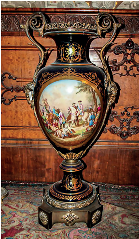
15 Vazo, Dolmabahçe Sarayı, Env. No. 11/559.