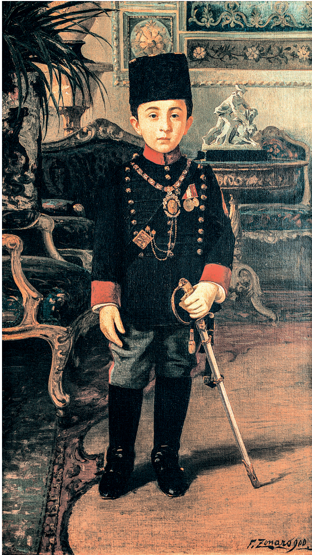
10 Fausto Zonaro, Şehzade Abdürrahim Efendi, 132 x 81 cm, tuval üzerine yağlıboya, Suna ve İnan Kıraç Vakfı.

Saray Koleksiyonları Müzesi'nde bulunan 11/1319-11/1320 envanter numaralı iki adet bisküi heykel figürü, iki köpeği tutan bir erkek figüründen oluşmaktadır. Heykellerin kobalt mavisi kaidelerinde "Dore a Sèvres 97" damgası yer almaktadır. Bu damga, 1872-1899 yılları arasındaki III. Cumhuriyet Devri'ni işaret etmektedir. Sözü edilen eserler, F. Zonaro'nun yaptığı Şehzade Abdürrahim Efendi'nin resminde arka planda da görülmektedir. (Resim 10-11)