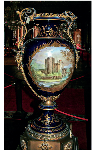
19 Vazo, Dolmabahçe Sarayı, Env. No. 11/608.