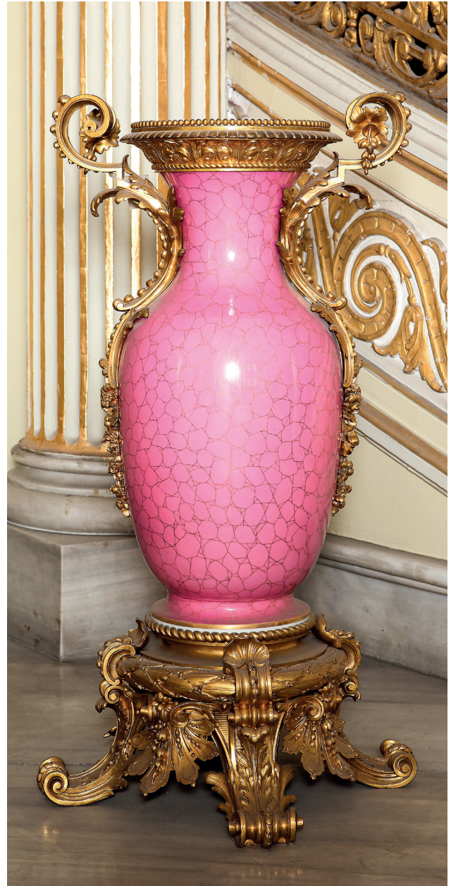
27 Vazo, Küçüksu Kasrı, Env. No. 11/1566.

Küçüksu Kasrı 1 No'lu salonda bulunan, 11/1566 ve 11/1567 envanter numaralı vazolar, altın yıldızlı bronzdan birer kaide üzerinde oturmaktadır. Ağzlarının etrafı yine bronz süslemeyle çevrilidir. Tüm gövdeleri gül kurusu zemin üzerine altın yıldızlı petek görünümünde desenlidir. Vazoların rengi, dönemin "Madame Pompadour Modası'nın" tipik bir örneğidir. Bu vazoların benzerleri Yıldız Şale 11 No'lu koridorda sergilenen, 7/35-7/36 envanter numaralı vazolardır. (Resim 27)