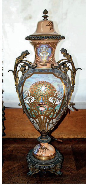
21 Vazo, Dolmabahçe Sarayı, Env. No. 13/107.