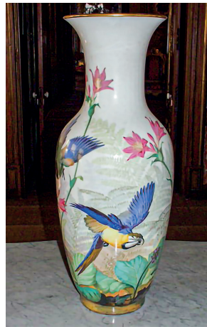
12 Vazo, Beylerbeyi Sarayı, Env. No. 3/9.