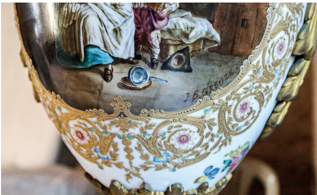
34 J. B. Greuze imzalı vazo detayı, Topkapı Sarayı, Env. No. 26/4478.