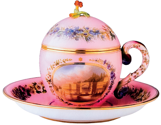
38 Tatlı hokkası, Topkapı Sarayı, Env. No. 26/4459.

26/4962 ve 26/4986 envanter numaralı ve Louis Phillippe damgalı tabaklar, III. Napoléon tarafından Sultan Abdülmecid'e hediye olarak gönderilmiş altmış parçalık yemek takımının parçalarıdır. Lacivert zemin üzerine altın yıldızlı dal ve yapraklarla bezenmiş ve bordürle çevrelenmiş tabakların ön yüzüne dünyadaki çeşitli ormanlar, insan ve hayvan figürleri resmedilmiştir. (Resim 39-40)