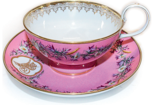
32 Fincan ve tabağı, Topkapı Sarayı, Env. No. 26/659.