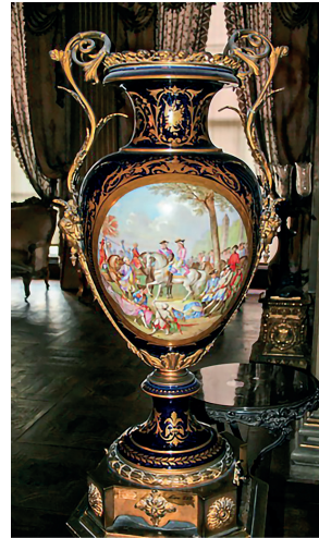
18 Vazo, Dolmabahçe Sarayı, Env. No. 13 /473.