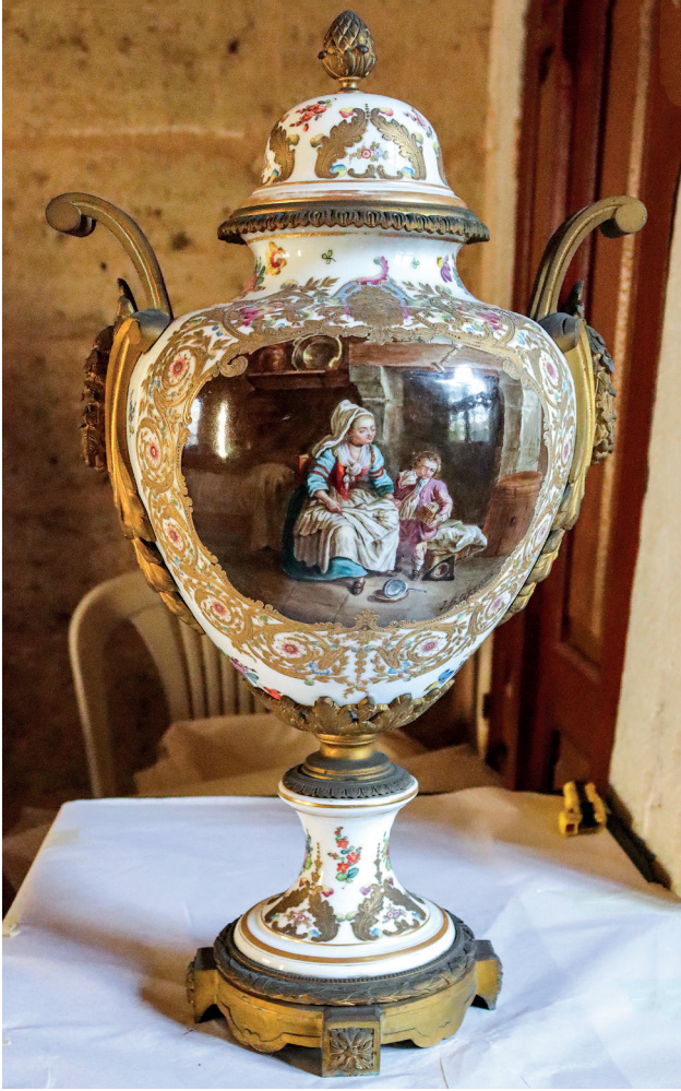
33 Vazo, Topkapı Sarayı, Env. No. 26/4478.

numaralı fincan ve tabağı, Sèvres porselenlerinin sofrta takımı parçalarındandır. Bu eserlerde, pembe zemin üzerine gümüş telle işlenmiş madalyonların içinde pembe güller ve çeşitli renklerde çiçekler resmedilmiştir. (Resim 35-36-37)