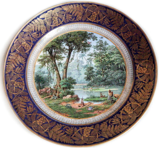
39-40 Louis Philippe damgalı Sèvres porseleni tabaklar, Topkapı Sarayı, Env. No. 26/4962, 26/4986.