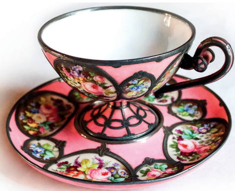
37 Fincan ve tabağı, Topkapı Sarayı, Env. No. 26/4448.