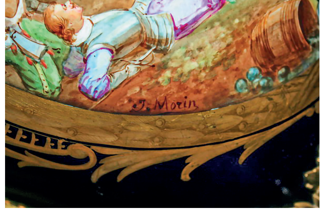
17 J. Morin imzalı vazo detayı, Dolmabahçe Sarayı, Env. No. 11/608.