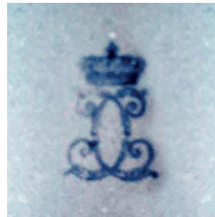
4-5 Vazo, Beylerbeyi Sarayı, Env. No. 3/442.

Koleksiyonda yer alan en özel örneklerden biri de Beylerbeyi Sarayı 1 No'lu salonda sergilenen 3/442 envanter numaralı vazodur. 148 cm yüksekliğinde olan vazo, büyük bir kupa formundadır. Vazonun gövdesi çiçek motifleri, kuş ve sincap figürleri, deniz kabukları ve altın varaklarla süslenmiştir. Altındaki damgası sebebiyle 1824-1830 yılları arasına tarihlendirilmektedir. (Resim 4 -5)