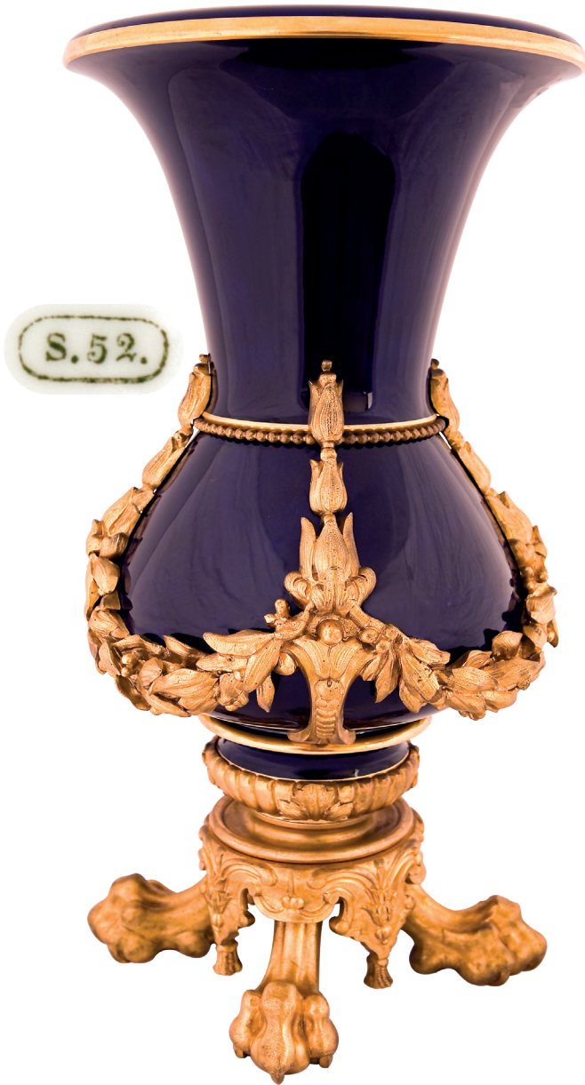
8 Vazo, Dolmabahçe Sarayı, Env. No. 13/43.

Dolmabahçe Sarayı 62 No'lu odada sergilenen, 13/42-13/43 envanter numaralı iki adet vazo, aslan pençesi biçiminde bronz üzerine altın yaldızlı dört kaide üzerine oturmaktadır. Gövdenin etrafındaki bronz üzerine altın yaldızlı defne yaprakları girland şeklindedir. Eklektik özellikler taşıyan vazoların tüm yüzeyi kobalt mavisi renginde yapılmıştır. Ağızlarının iç kısmında S.52 yazmaktadır. "S", Sèvres ürünü olduklarını; 52 sayısı ise yapılış tarihlerini belirlemektedir. Bu sayı, 1848-1852 tarihlerini göstermektedir. (Resim 8)