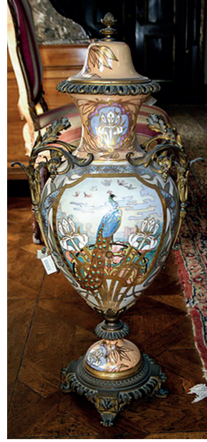
22 Vazo, Dolmabahçe Sarayı, Env. No. 13/108.