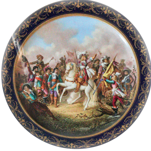
30 Tabak, Topkapı Sarayı, Env. No. 26/4491.

çiçeklerle bezelidir. Eserin üzerinde Sultan Abdülaziz'in tuğrası yer almaktadır. (Resim 32) 26/4478 envanter numaralı vazonun gövdesinin yüzeyinde bulunan, altın yıldız ve bitkisel süslemelerle konturlanmış madalyonların bir yüzünde kadın ve çocuk