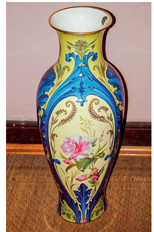
13 Vazo, Dolmabahçe Sarayı, Env. No. 51/403.