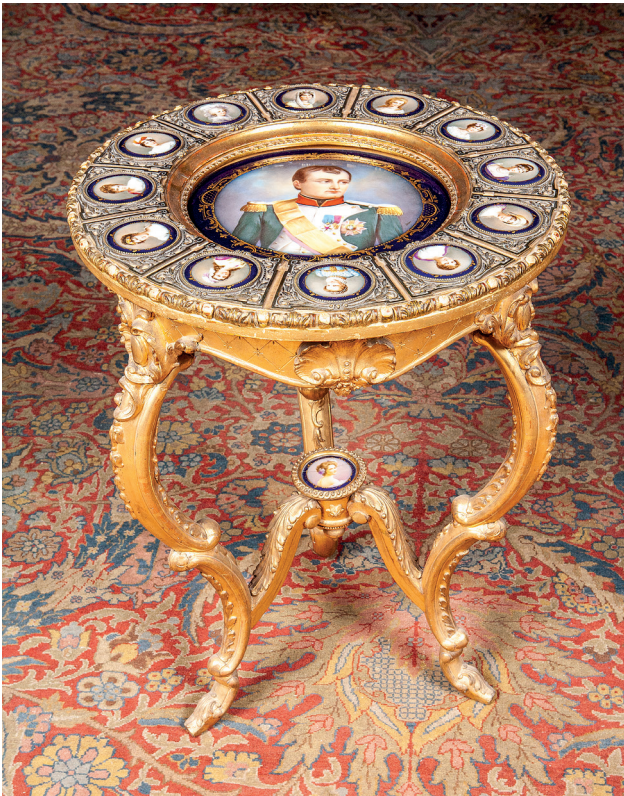
26 Sehpa, Dolmabahçe Sarayı, Env. No. 11/740.

Küçüksu Kasrı 1 No'lu salonda bulunan, 11/1566 ve 11/1567 envanter numaralı vazolar, altın yıldızlı bronzdan birer kaide üzerinde oturmaktadır. Ağzlarının etrafı yine bronz süslemeyle çevrilidir. Tüm gövdeleri gül kurusu zemin üzerine altın yıldızlı petek görünümünde desenlidir. Vazoların rengi, dönemin "Madame Pompadour Modası'nın" tipik bir örneğidir. Bu vazoların benzerleri Yıldız Şale 11 No'lu koridorda sergilenen, 7/35-7/36 envanter numaralı vazolardır. (Resim 27)