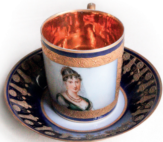
41-42 I. Napoléon Bonaparte ve Caroline Bonaparte portre resimli fincanlar ve tabakları, Topkapı Sarayı, Env. No. 26/4347, 26/4351.