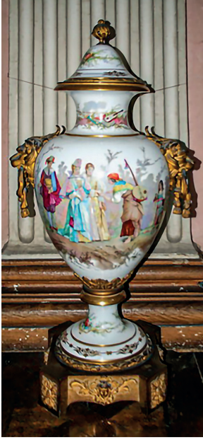
20 Vazo, Dolmabahçe Sarayı, Env. No. 13/660.