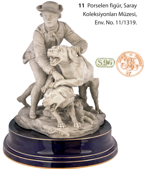
11 Porselen figür, Saray Koleksiyonları Müzesi, Env. No. 11/1319.

Dolmabahçe Sarayı 221 No'lu odada sergilenen, 51/403-51/404 envanter numaralı iki adet vazonun tüm zemini sarı renkte olup gövdenin iki yüzündeki lacivert renkli yapraklardan oluşan panolar içinde çiçek süslemeleri vardır. (Resim 13)