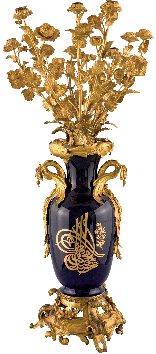
7 Vazo, Dolmabahçe Sarayı, Env. No. 11/15.

Dolmabahçe Sarayı 1 No'lu salonda sergilenen, 11/14-11/24 envanter numaralı 11 adet eser de Sèvres porseleninin güzel örneklerindedir. Lacivert zeminli bu vazoların kaideleri pirinçten yapılmış altın varaklarla süslenmiş ve üç ayaklıdır. Vazoların lacivert zeminli gövdelerinin üzerinde altın yaldız süslemeli Sultan Abdülmecid tuğrası yer almaktadır. Kulpları çiçek şeklindedir ve altın varaklı ağızdan çıkan 9 dal, mumlukları oluşturmaktadır. Bu özelliğiyle saraydaki bazı vazolar gibi mekânı aydınlatma amacıyla da kullanılmıştır. Bu dal araları haşhaş yaprağı, çiçek ve tomurcuklarla