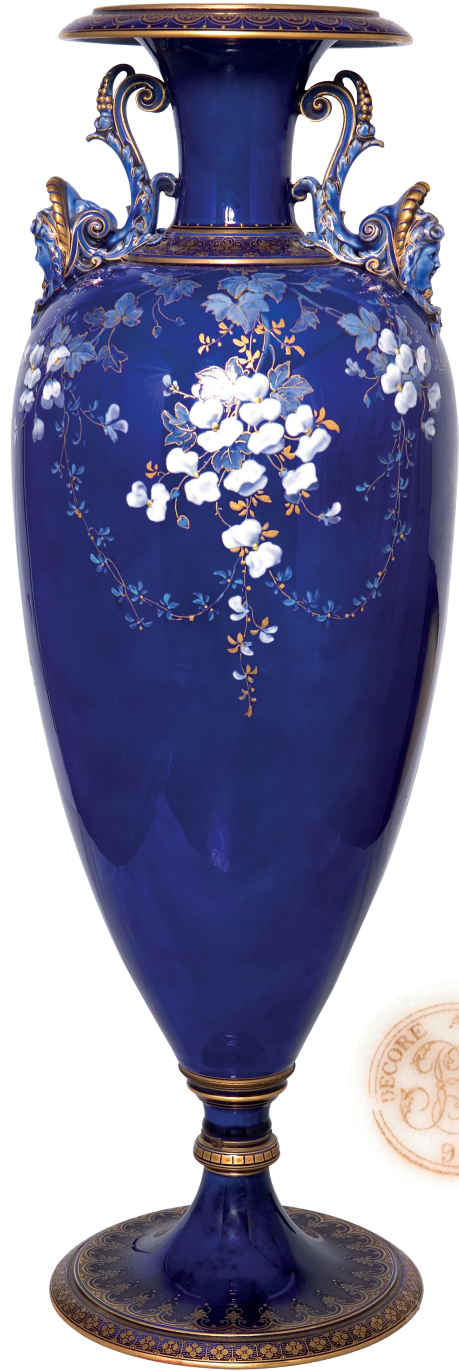
9 Vazo, Saray Koleksiyonları Müzesi, Env. No. 11/921.

Saray Koleksiyonları Müzesi'nde bulunan 11/921-11/922 envanter numaralı iki adet vazonun yüzeyleri lacivert zeminli, kulpları figürlüdür. Gövdelerinin üst kısmı altın yaldızlı olup mavi ve beyaz renklerde çiçek motifleriyle bezelidir. Dip kısmındaki damgadan dolayı 1872-1899 yılları arasına tarihlendirilmektedir. (Resim 9)