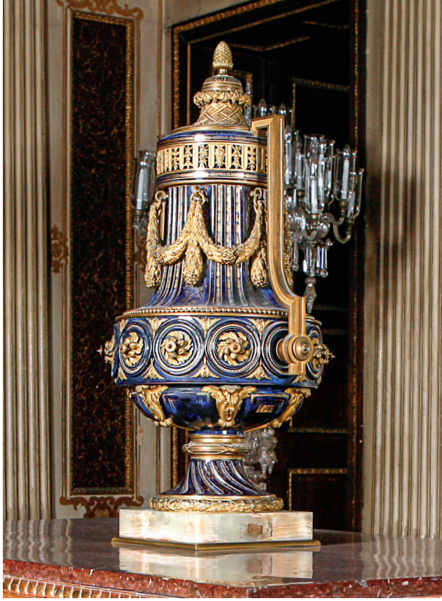
6 Vazo, Dolmabahçe Sarayı, Env. No. 11/920.

Bir diğer önemli vazo ise Zülvecheyn Salonu'nda sergilenen 11/920 envanter numaralı, lacivert zeminli ve altın varaklı ampir üslublu Sèvres vazodur. 102 cm yüksekliğindeki vazonun balgami taştan dört köşe bronz kenarlı bir kaidesi vardır. Vazonun gövdesi, madalyonlar içinde yer alan pirinçten kıvrık yapraklarla süslüdür. Vazo kapağının tepeliği, çam kozalağı şeklindedir. (Resim 6)