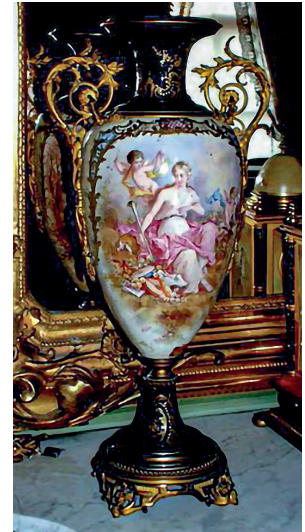
25 Vazo, Dolmabahçe Sarayı, Env. No. 51/246.

Dolmabahçe Sarayı 69 No'lu odada sergilenen, 51/245-51/246 envanter numaralı iki adet vazo, Poilevin imzalıdır. Lacivert zeminli vazoların bir yüzünde lir çalan bir kadınla melek, diğer yüzünde ise bir bina resmedilmiştir. (Resim 24-25)