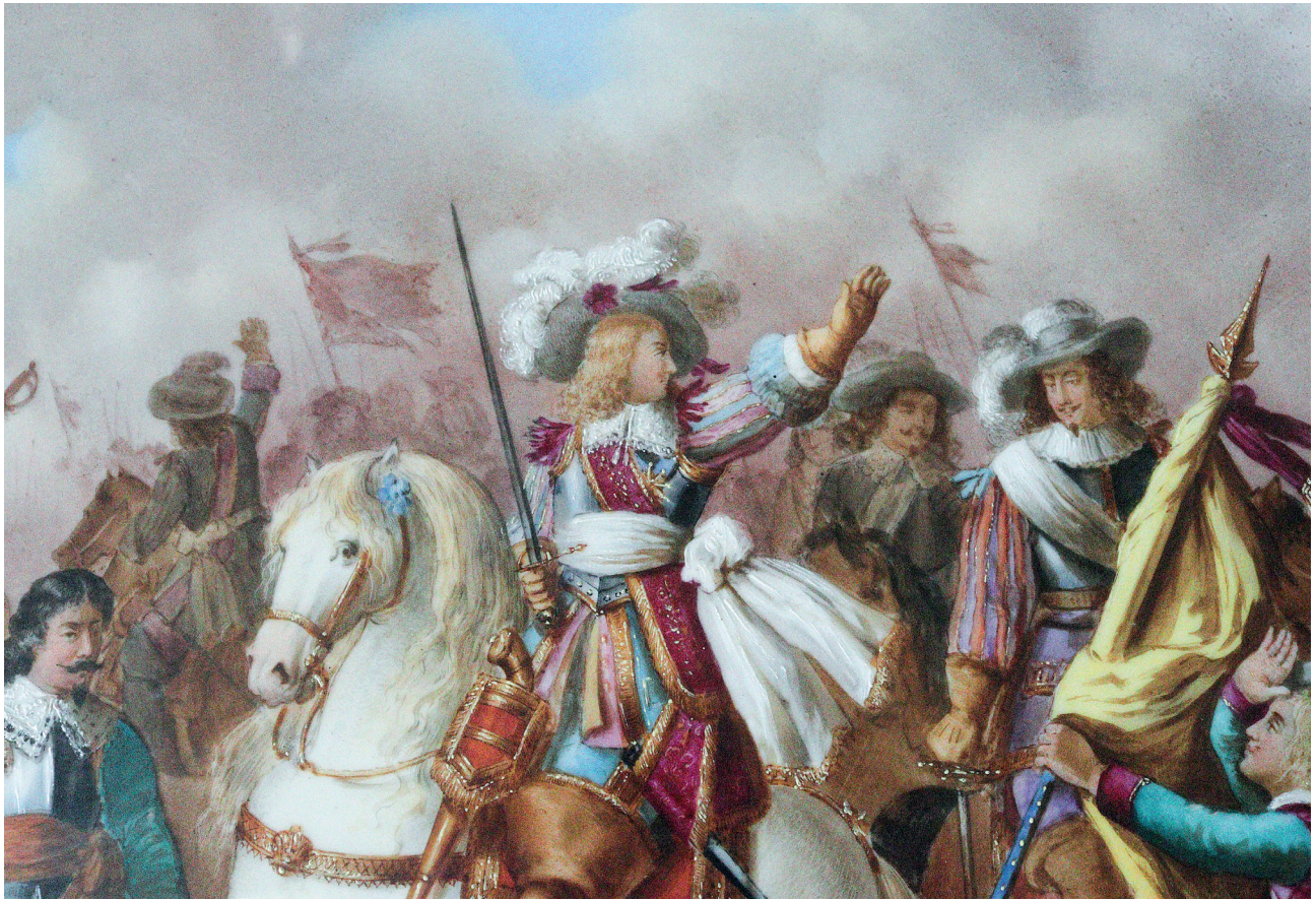
31 Tabak detayı, Topkapı Sarayı, Env. No. 26/4491.