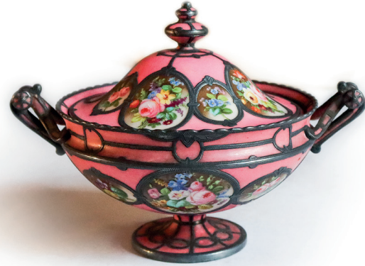
36 Şekerlik, Topkapı Sarayı, Env. No. 26/4446.