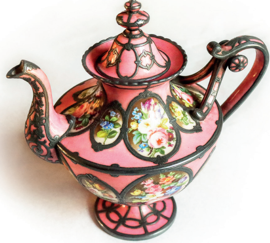
35 Çaydanlık, Topkapı Sarayı, Env. No. 26/4445.