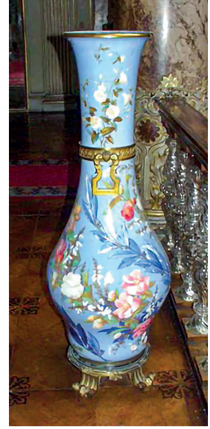
23 Vazo, Dolmabahçe Sarayı, Env. No. 11/408.

Kapak üzerinde çeşitli müzik aletleri ve çiçekler betimlenmiştir. (Resim 20)