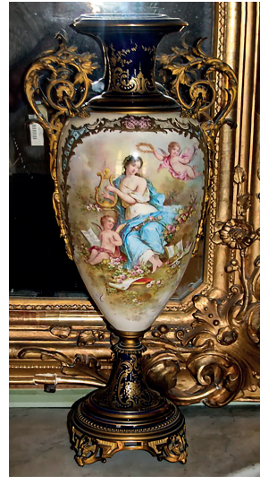
24 Vazo, Dolmabahçe Sarayı, Env. No. 51/245.

Dolmabahçe Sarayı Kristal Merdiven Salonu'nda sergilenen, 11/408-11/409 envanter numaralı iki adet vazo, bronzdan ve dışa doğru dört ayaklı bir kaide üzerine oturtulmuş armudi bir gövde ve uzun bir boyundan oluşmaktadır. Vazoların ağzının iç kısmı ile boyunlarında yer alan iki kulplu bronz süsleme altın yıldızlıdır. Vazolar lacivert zemin üzerine defne yaprakları, gül ve boru çiçekleriyle süslenmiştir. Boyunlarının iç kısmındaki tacın altında "N" harfi ve "Decore Sèvres" yazılıdır. (Resim 23)