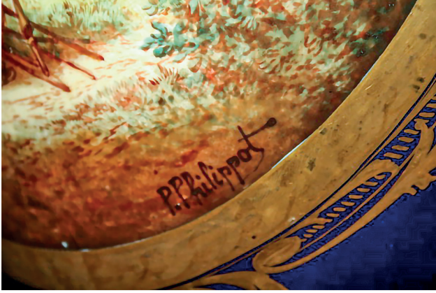
14 P. Philippot imzalı vazo detayı, Dolmabahçe Sarayı, Env. No. 11/559.

13/660 envanter numaralı vazo; bronz ayaklı, kapaklı ve iki kulpludur. Beyaz zeminli gövdesinin bir yüzünde evler, diğer yüzünde ise bir manzara ve insan figürleri resmedilmiştir. Boynun bir tarafında sepetten çıkan çiçekler ve kuşlar görülmektedir.