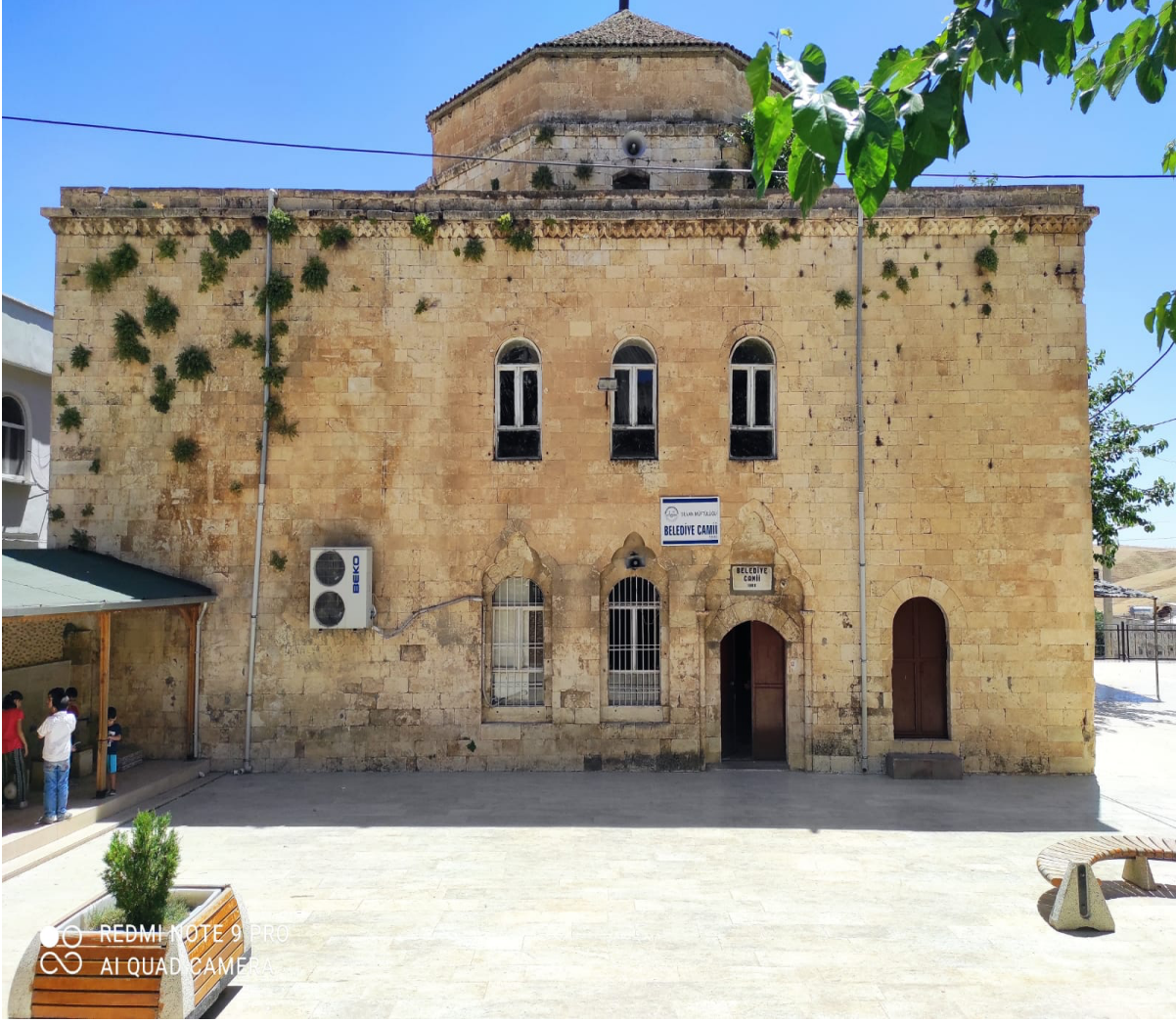
Keldânî Kilisesi'nden dönüştüğüne inanılan Silvan Belediye Camii