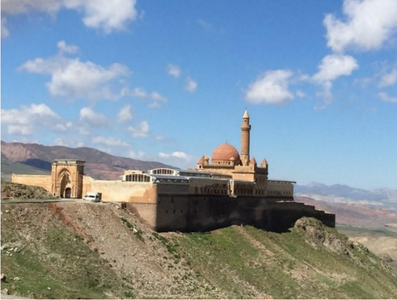
Foto 1: Farklı mimari yapıların izlerini taşıyan İshak Paşa Sarayı'ndan bir görünüm.

Osmanlı Devleti'ne ilk olarak Yavuz Sultan Selim döneminde katılan Bayazıt Sancağı, Safeviler için de önemli bir merkez idi. Bundan dolayı iki devlet bu bölge için büyük mücadeleler vermiştir. 1578'de Osmanlı Devleti kesin hâkimiyet sağlamıştır (Gül, 2011:157). Osmanlı Devleti'nin bu başarısını kabullenemeyen Safeviler ara ara saldırılarına devam etmiştir. Bayazıt Sancağı, Osmanlı ve İran devleti arasında tampon bölge görevi görmekteydi (Bilgili, 2004:210). Ayrıca pek çok konargöçer halkın da tercih ettiği bir sahaydı. Osmanlı'da yaşayan farklı aşiretlerinde ikamet ettiği bir bölgeydi (Bitlisi, 2013:308). 18.yüzyılda Osmanlı Devleti'nin en doğusunda bulunan tarihi yerleşim yerlerinden biri olan Bayazıt Sancağı, Osmanlı Devleti'nin bu bölgede yer alan askeri, kültürel ve ekonomik bakımından önemli idari merkezlerinden birisi haline gelmiştir. Nitekim, dönemin en önemli tarihsel ve kültürel kaynaklarından birisi olan İshak Paşa Sarayı da 18.yüzyılın sonlarında inşa edilmiştir (Foto 1).