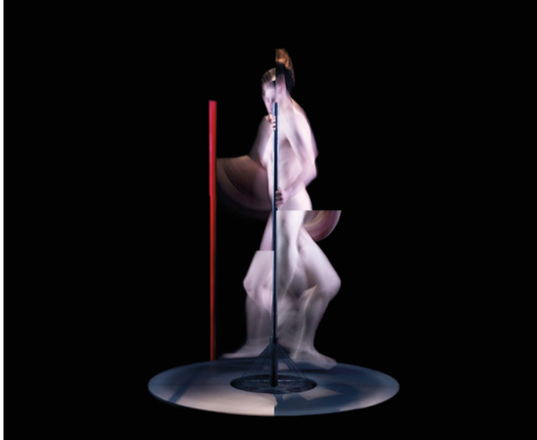
Görsel 3: Ahmet Elhan, Gergedanlaşma, 2014

'Mürekkep II'de çözümlenebilen bir mekân kullanılmasına karşın, karanlığın içine hapsolmuş 'Gergedanlaşma' isimli çalışmasında Ahmet Elhan, dönüşümün birey açısından yarattığı güçlüğü ve verdiği acıyı hissettirmektedir. 'Gergedanlaşma'da beden yaşamsal özelliklerini yitirecek kadar çok parçalara ayrılmış durumdadır. Parçalanmış eril bedenin üzerinde dönüp durduğu yuvarlak yüzeyin dişiliği sembolize ettiği düşünülebilir. İktidarı simgeleyen kırmızı direğin ise bu yüzeyin dışında bırakıldığı şeklinde yorumlanabilir.