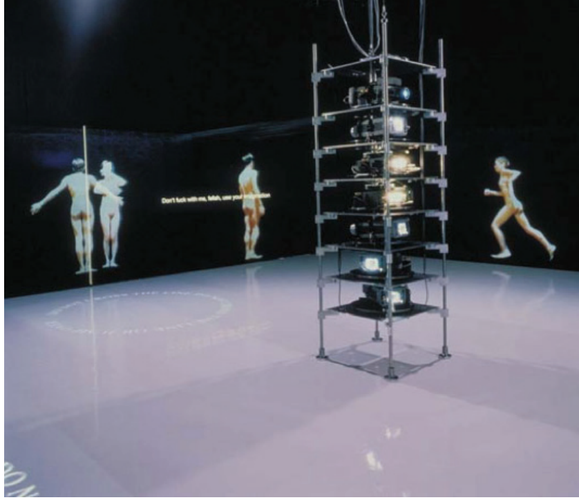
Görsel 1: Teiji Furuhashi, Âşıklar , 1994-95.

Verdiği mesajlarla Furuhashi, genel anlamıyla toplumsal cinsiyet baskılarına ve zorunlu heteroseksüelliğe karşı çıkmaktadır. Sanatçı, mekânda kurguladığı düzenle farklı geçişlere olanak sağlayan alternatif cinsel ilişkiler önermektedir. Bununla birlikte, farklı birliklikleri izleyicilerin zihninde canlandırmasını sağlamak amacıyla 'hayal gücünü kullan' söylemini kullanmaktadır.