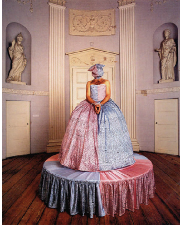
Görsel 7: Hunter Reynolds, Aşk Elbisesi , 1993

Hunter Reynolds, üzerinde kendi günlüklerindeki aşk hikâyelerinden derlediği yazıların bulunduğu 'Aşk Elbisesi'ni bizzat giyerek performans sergilemiştir (Lord ve Meyer, 2013: 177). Sanatçı, Aşk Elbisesi ile aynı kumaşla kaplanmış yuvarlak ve yüksek bir kaide üzerinde elleri bağlanmış ve başı tamamen kapatılmış vaziyette izleyiciyi karşılamaktadır. Erkek bedenindeki kıllı göğsüne ve kollarına rağmen, imgesel ve geleneksel anlamda dişil bir kimliğe bürünmüştür.