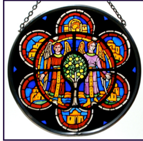
Görsel 2: Ulusal Washington Katedralinde yer alan hayat ağacı motifi ( http://www.winged-heart.com/acatalog/USA_Customers_-_Washington_National_Cathedral_Stained_Glass.html Erişim tarihi: 14 Mart 2014)

Toprağa bağlanan kökleri ve göğe doğru yükselen gövdesiyle yaşamla ölüm arasında bağ kurduğuna inanılan ağaç figürünün günümüzde de kutsal olma durumu devam etmektedir. Öyle ki, heybetli ve yaşlı ağaçlar; onları izleyen insanlar tarafından yücelik duygusu uyandırmakta, saygıyla izlemektedir ve bu yaşlı ağaçlar anıt ağaç olarak da korunmaktadır. (Görsel 3) Diğer bir açıdan ise yaşlı bir ağaç geçirmiş olduğu zamana karşı halen canlı olarak dimdik durmaktadır ve izleyicide ölümsüzlük duygusu uyandırmaktadır. Bu bağlamda ağaç, insanoğlunun sonsuza kadar var olma, ölümsüz olma gibi içgüdüsel duygularının da somut varlığı haline dönüşmektedir.