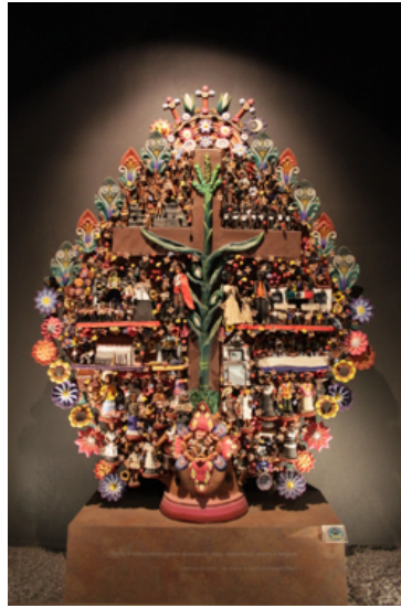
Görsel 5: Tavuskuşu Hayat ağacı, Meksika Antropoloji Müzesi, (Fotoğraf: Duygu Kahraman)

Metepec şehri Meksiko'nun 50km batısında yer alan ve 19.yüzyıldan itibaren günümüze kadar seramik üretimine devam eden bir seramik merkezidir. Metepec seramikleri nesilden nesile aktarılan teknik ve bilgilerle günümüzde de özgünlüğü ile Meksika'nın yerel sanatları arasında önemli bir yere sahiptir. Metepec çömlekçiliğinde mutfak gereçleri gibi işlevsel kapların yanı sıra hayat ağacı heykelleri simgesel anlamlarıyla dekoratif amaçla üretilmeye devam edilmektedir. Metepec hayat ağacı heykellerini geleneksel ve çağdaş olmak üzere iki farklı açıdan değerlendirmek mümkündür. Geleneksel üslupta şekillendirilmiş hayat ağacı heykellerinde genellikle İncil'de yer alan sahneler tasvir edilmektedir. Dini törenlerde kullanılan geleneksel hayat ağaçlarının tepesinde Tanrı'nın bir simgesi yer almakta ve Tanrı imajının altında ise güneş, ay, hayvanlar, Adem ve Havva gibi figürler kullanılarak yaratılış hikayesi anlatılmaktadır.(Görsel 5)