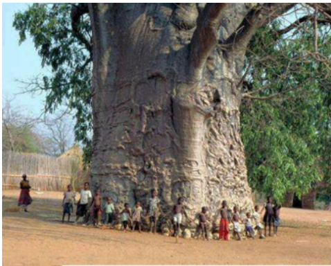
Görsel 1: Türk Kilimlerinde yer alan hayat ağacı motiflerinden örnekler ( http://semrabayraktar.blogspot.com/2013/01/turk-tarihinin-ve-kulturunun-kaynagi.html Erişim tarihi: 14 Mart 2014)

Toprağa bağlanan kökleri ve göğe doğru yükselen gövdesiyle yaşamla ölüm arasında bağ kurduğuna inanılan ağaç figürünün günümüzde de kutsal olma durumu devam etmektedir. Öyle ki, heybetli ve yaşlı ağaçlar; onları izleyen insanlar tarafından yücelik duygusu uyandırmakta, saygıyla izlemektedir ve bu yaşlı ağaçlar anıt ağaç olarak da korunmaktadır. (Görsel 3) Diğer bir açıdan ise yaşlı bir ağaç geçirmiş olduğu zamana karşı halen canlı olarak dimdik durmaktadır ve izleyicide ölümsüzlük duygusu uyandırmaktadır. Bu bağlamda ağaç, insanoğlunun sonsuza kadar var olma, ölümsüz olma gibi içgüdüsel duygularının da somut varlığı haline dönüşmektedir.