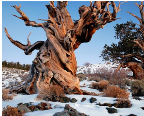
Görsel 4: 4841 yaşındaki bu çam ağacı Ulusal Kaliforniya Ormanı'nda bulunan dünya çapında bilinen en eski organizmadır. ( http://www.mnn.com/earth-matters/wilderness-resources/photos/the-worlds-10-oldest-living-trees/methuselah Erişim tarihi: 16 Mart 2014)