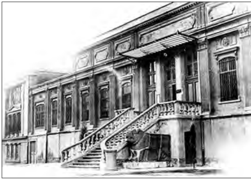
Görüntü 8: Sanayi-i Nefise Mektebi-1924 (Bugünkü adıyla Mimar Sinan Güzel Sanatlar Üniversitesi)

3 Mart 1883'de kurulmuş olan Sanayi-i Nefise Mektebi, yalnızca erkek öğrencilerin kabul edildiği bir okulken, toplumsal gelişmelere bağlı olarak kızların eğitiminin önem kazanmasıyla, 1914'de kız öğrenciler de okula kabul edilmeye başlanmış ve İnas Sanayi-i Nefise Mektebi kurulmuş, daha sonra da 1925 yılında iki okul birleştirilmiştir. (Görüntü 8) Kurum, 1927'de Güzel Sanatlar Akademisi ve 1983'de Mimar Sinan Üniversitesi Güzel Sanatlar Fakültesi adını almıştır. (www.kultur.gov.tr/TR/ Sanatçı Yetiştirme Hedefli Kurumlarda Plastik Sanatlar Eğitimi) (08.09.2010)