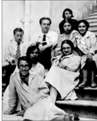
Görüntü 1: 1931 senesinde Vedat Ar, Sanayii Nefise’de ilk talebeleriyle birlikte.

1929’da çinicilik atölyesi açılır ve atölyenin başına İsmail Hakkı Oygur getirilir. İsmail Hakkı Oygur, Hakkı İzzet ve Vedat Ömer Ar, seramik öğrenimi için yurt dışına gönderilen ilk sanatçılarımızdandır. Aynı zamanda İsmail Hakkı Oygur, 1928’de Paris’de bir seramik sergisi açar. Böylece yurt dışında sergi açan ilk Türk seramik sanatçısı olma özelliğine de sahiptir. Ayrıca Oygur, Türk sanatçıların özel sergiler açmalarını gerçekleştirecekleri sergi salonlarından yoksun bir dönemde İstanbul’da bir özel sanat galerisi açarak pek çok sanatçının kişisel sergiler açabilmesine mekan yaratır. (Giray, 1998 s:25) (Görüntü 1)