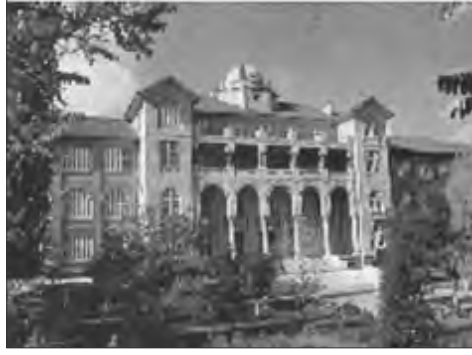
Görüntü 9: (sağdaki) Gazi Orta Muallim Mektebi ve Terbiye Enstitüsü-1926 (Bugünkü adıyla Gazi Üniversitesi Eğitim Fakültesi)

Sadi Diren bir yazısında Cumhuriyetin ilanından on sene sonra Sümerbank'ın endüstri planlamasında İstanbul ve Kütahya'yı kapsayan seramik endüstrisi etüd ve projelerine başlamasından bahsetmektedir ve bunların seramik sanatı ve endüstrisi alanında bugünkü gelişmelerin temelini oluşturan çok önemli başlangıçlar olduğundan söz eder. Bu gelişmeleri takip eden dönemlerde Ankara'da Gazi Orta Muallim Mektebi ve Terbiye Enstitüsü'nde de bir seramik atölyesi kurulup seramik eğitimi vermeye başlanmıştır. (Görüntü 9)