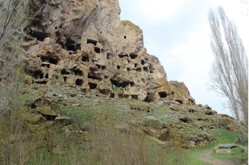
Resim 5: Erdemli Vadisi. Köy yerleşiminin bir kısmı