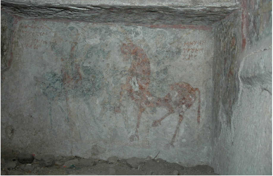
Resim 3: Güzelyurt, Atlı Kilise, naostaki arcosoliumun gúney duvarı, skribon Leon ve tourmarkhes Mikhael