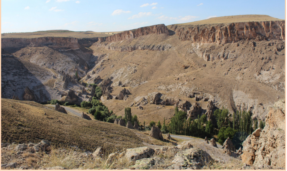
Resim 4: Soğanlı Köyü. Vadinin batı kolu, bu kolun en batısında Azize Barbara Kompleksi