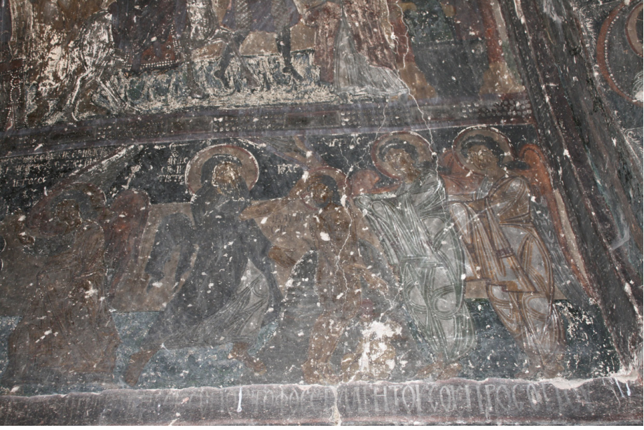
Resim 2: Belısırma, Bahattin Samanlıđı Kilisesi, silmedeki bani yazıtı ve Vaftiz