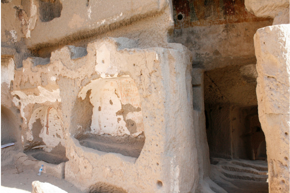
Resim 1: Ihlara, Eğritaş Manastırı Kilisesi, arcosolia ve zemin mezarları