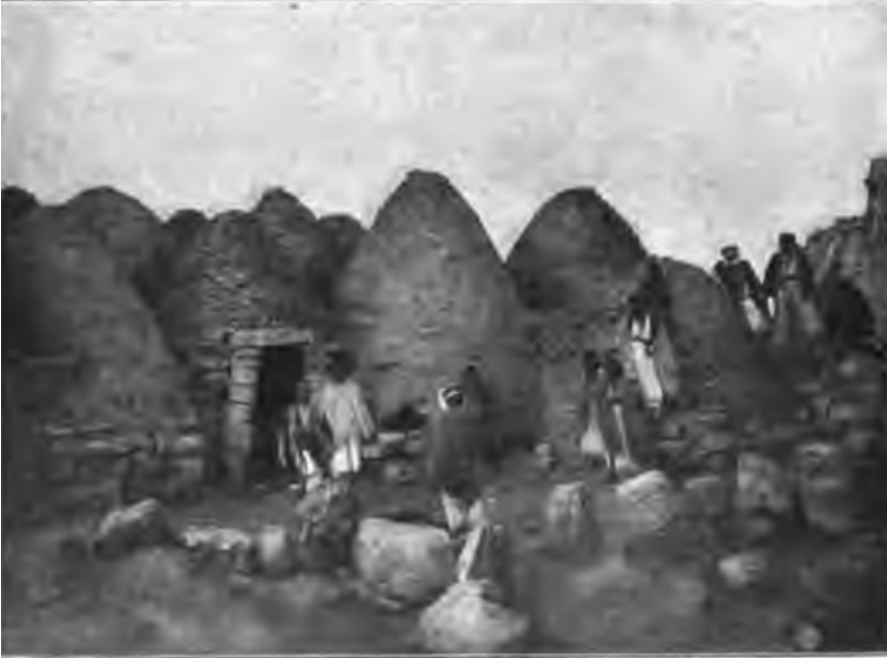
G. 1: Harran evleri, Friedrich Delitzsch, Im Lande des Einstigen Paradieses , 10.

Alman müzecisi ve sanat tarihçisi Friedrich Sarre (1865-1945) ve beraberindeki Alman arkeolog, sanat tarihçisi, Hristiyan ve Bizans sanatları uzmanı Ernst Herzfeld'in 1907'deki seyahat yerleri arasında yine Urfa bulunmaktaydı. Amaçları bölgede bulunan eski eserlerin fotoğraflarını almak ve incelemelerde bulunmaktı. 66 Ulu Cami'nin bahçesindeki sütun başlıklarını (G. 2) inceleyen Sarre ve Herzfeld 67 , ayrıca kiliseleri ve Urfa Kalesin'deki 68 yapıları tetkik etmişlerdi. 69 Mezopotamya seyahatleri esnasında İslami mimarlık eserlerini tespit edip fotoğraflamışlar, bu incelemelerini de I. Dünya Harbi'nden önce Archaeologische Reise im Euphrat und Tigris-Gebiet, Berlin 1911-1920 adıyla dört cilt hâlinde yayımlamışlardı. 70