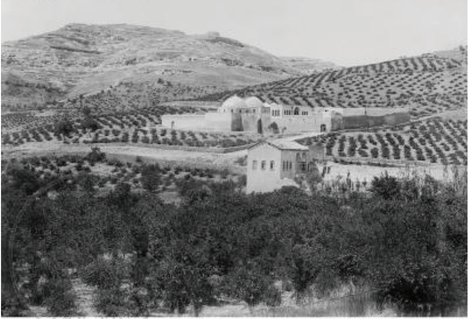
Slg. Oppenheim 10/6 S.64