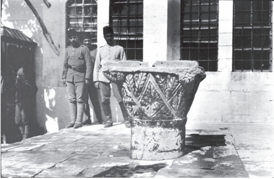
G. 2: Ulu Cami'nin bahçesindeki sütun başlığı, http://gertrudebell.ncl.ac.uk/photo_details.php?photo_id=6142 .

İngiliz Thomas Edward Lawrence da Urfa ve çevresinde kazı yapan öncülerden biriydi. Ehemmiyet arz eden kale, bina ve eski eserleri incelemek üzere Lawrence'ın gideceği mahallerin memurları mütemadiyen uyarılmıştı. 71 Lawrence 1909'da Urfa'yı ziyaret etmişti ancak 1911'deki ziyareti daha çok arkeolojik araştırma amacını taşı-maktaydı. 72 14 Temmuz 1911 Cuma günü Urfa'ya gelen arkeolog kaldığı hana yer-leştikten sonra kaleyi fotoğraflamak için dışarı çıkmıştı. Bir gün sonra ise kaleye tır-manmış, birkaç açıdan fotoğraflar almış ve kale içinde ve dışında ölçümler yapmıştı. 73 Urfa'dan sonraki durağı Harran olan Lawrence buradaki kalede de incelemelerde bulunmuştu. Kalenin birkaç dönemde inşa edilmiş olduğunu belirten Lawrence, Arap öncesi dönemden ziyade daha yakın bir dönemde yapılmış olduğuna işaret etmişti. Daha sonra camiye yönelen Lawrence burada bazalttan bir aslan kabartmasının fotoğ-rafini çekmişti. 74 Bilhassa Karkamış kazılarında yer alan Lawrence, bölgede sürekli gezilere çıkıyordu. 1911'de British Museum adına David H. Hogarth ile başlayan Karkamış kazıları, Hogarth'ın Oxford'a dönüşünden sonra Leonard Woolley ve Tho-mas Edward Lawrence tarafından 1914'e kadar sürdürülmüştü 75 (G. 3). Lawrence