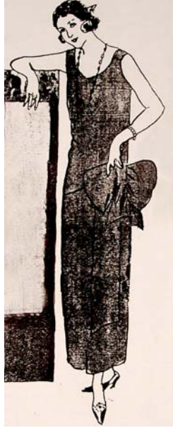
Resim: 5 Anonim 1923c. Süs Dergisi.

Resim 6. Koyu renk saten kumaştan elbisenin üzerinde kısa dantel pelerin kullanılmakta ve önde dantel önlük bulunmaktadır. Pelerin ve önlük verevden oval kesimlidir. Giysinin kalçasından arkaya dönen bant büyükçe bir fiyonga dönüşmektedir. Saçların arkasında kullanılan toka giysiyi bütünlemektedir (Süs Dergisi, 1923d).