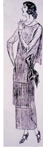
Resim: 11 Anonim 1923f. Süs Dergisi Resim: 12 Anonim 1923f. Süs Dergisi,

SONUÇ: Müsahipzade'nin çizimleri, söz konusu dönemin moda anlayışını tam olarak yansıtmaktadır. Yapılan araştırmalar, dönem modasına bakıldığında modanın bu çizimlerde görülen haliyle Türkiye için çok yaygın bir uygulama olmadığını göstermektedir. Ancak yazarın kendi sosyal yaşamı ve çevresinden gözlemlerini aktardığını düşündüğümüz bu çizimler dönemin diğer yayınlarında da benzer şekillerde görüldüğünden modanın giderek yaygınlaşan bir meraka dönüştüğünü düşündürmüştür. Modanın tanıtımı açısından da bu ve benzeri çizimlerin dergilerde sıklıkla yer alması önemli bir rol üstlenmiştir.