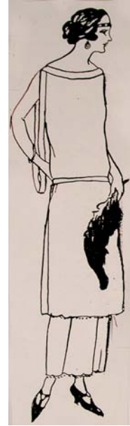
Resim: 3 Anonim 1923b. Süs Dergisi,