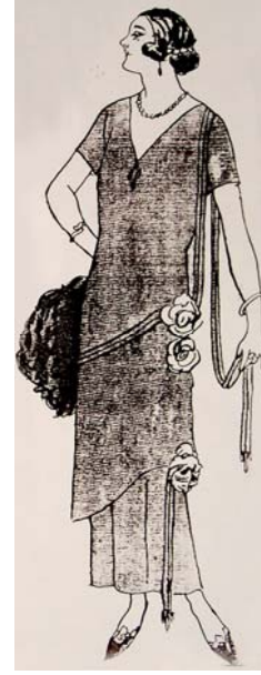
Resim: 8 Anonim 1923c. Süs Dergisi.

Resim 9. Giysinin devrik şal yakası geniş kayık yakaya monte edilmiştir. Uzun tek parça tuvaletin kalça üzerinde kendi kumaşından dönen bir kuşağı bulunmaktadır. Kuşak sağ kalça üzerinde gevşek bir fiyonk oluşturmaktadır (Süs Dergisi, 1923c).