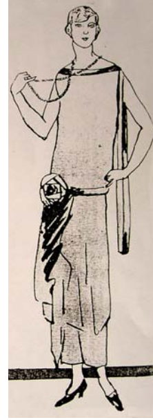
Resim: 9 Anonim 1923c. Süs Dergisi, Resim: 10 Anonim 1923f . Süs Dergisi.

Resim 11. Bu tuvaletlerin solda yer alanı kayık yakalı ve düşük japone kolludur. Kumaşın kendisinden oluşturulmuş kalça üzerinden dönen geniş bant, geniş bir halkadan geçirilerek sağ bacak üzerinden ayak bileğine kadar uzanmaktadır. Bütün elbisenin altında farklı boyda iki kat etek bulunmaktadır. Sağda yer alan tuvalet ise yine kayık yakalı ve düşük japone kolludur. Önde düşük belli etek, kasıklara doğru üçgen kesimle verev kesimlidir. Verev kesimli eteğin altında düz inen ikinci bir etek vardır. Saçlar kısa kesimlidir (Süs Dergisi, 1923f).