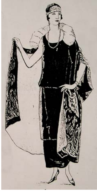
Resim: 7 Anonim1923e. Süs Dergisi

kullanılmıştır. Peluş çanta dönemin moda aksesuarları arasında yer almaktadır (Süs Dergisi, 1923c).