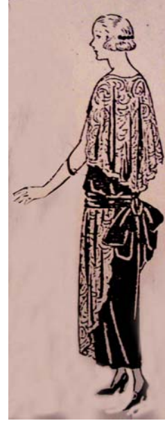
Resim: 6 Anonim 1923d. Süs Dergisi.

Resim 7. Koyu renk tuvaletin üzerine, kaftanvari geniş kesimli kollu ve geniş şal yaka kesimli bir manto bulunmaktadır. Yaka kürkten olup, giysinin kolları kimono biçimli, geniş ağızlı ve yırtmaçlıdır. Manto yine o yıllarda moda olan Doğu esintilerinden izler taşımaktadır. Üzeri işlemelidir. Model alında kaşbastı ve inci kolye ile kullanılmıştır. Bu kez saçlar dönemin kısa saç modasını tam olarak yansıtmaktadır (Süs Dergisi, 1923e).