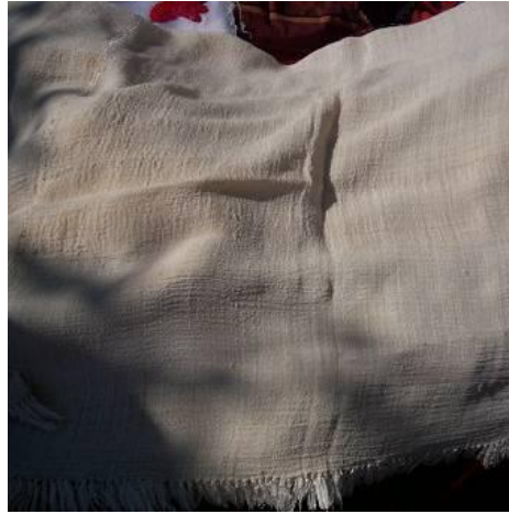
Şekil 32. Masa örtülük amacıyla üretilen ve pazarlanan ipek kumaş

Yörenin geleneksel uğraşlarından ipekli dokumacılık çok eski geçim kaynaklarından biridir. Ancak günümüzde ipekli dokuma işi yapan kadın sayısı giderek azalmıştır. Köyde sadece dört kadın bu uğraşmayı devam ettirmektedir. İpekli dokumalar en çok “çempere” denilen başörtüsünde kullanılmaktadır (Şekil 16-18). Halen bu amaçla dokunan ve kullanımı devam eden bu ipek kumaşların artık köyün yerli ve yabancı turiste açılması ile masa örtülük kumaş olarak pazarlanması da yaygınlaşmıştır (Şekil 32).