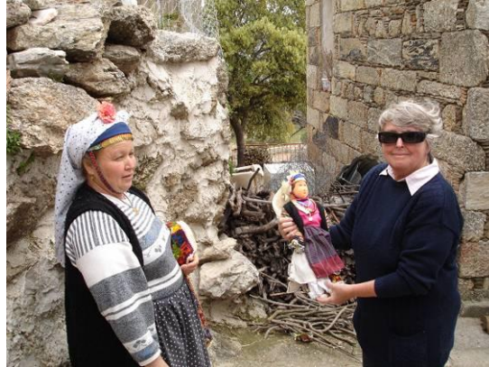
Şekil 22. Çomakdağ-Kızılağaç köyünde üretilen el sanatı ürünlerinin köye gelen turistlere pazarlanması

Ancak geçmişten bugüne geleneksel giysilerin hazırlanması ve süslenmesi amacıyla uğraşılan yöre el sanatları bugün bu amacından uzaklaşmış ve ticari bir faaliyet halini almıştır. Bunun sonucunda da el sanatlarının şeklinde, boyutunda ve fonksiyonunda değişiklikler başlamıştır.