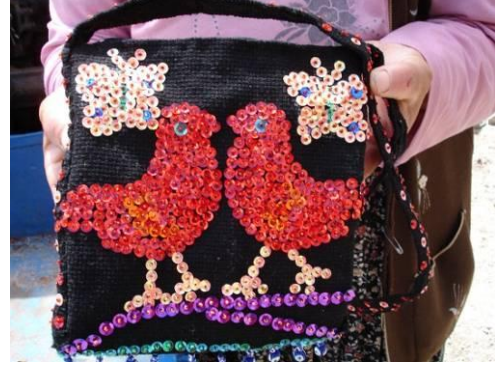
Şekil 24. Boncuk ve pul işi ile üretilmiş çanta