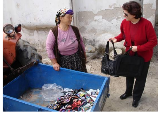
Şekil 21. Çomakdağ-Kızılağaç köyünde üretilen el sanatı ürünlerinin köye gelen turistlere pazarlanması