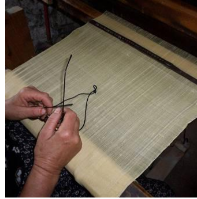
Şekil 17. İpek dokuma