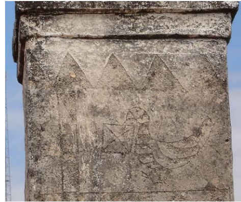
Şekil 6. Baca üzerine yapılmış bir resim