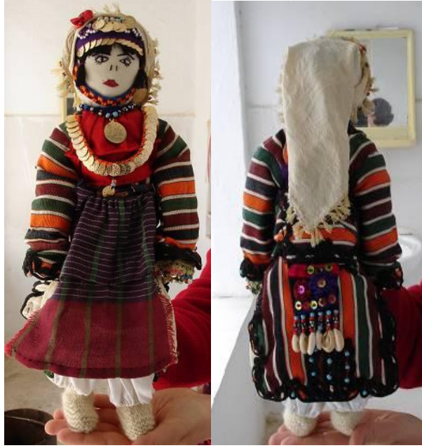
Şekil 19. Çomakdağ-Kızılağaç köyünde üretilen yapma bez bebek (önden ve arkadan görünüm)

sertifika almıştır. Köy kadınının atıl iş gücünün üretime yönlendirilmesi ve geleneksel giysilerin Çomakdağ bebekleri ile geleceğe taşınması açısından önemli olan bu proje sonunda folklorik bez bebek üretimi de köyün önemli el sanatı ürünleri arasında yerini almıştır (Şekil 19) (Çukur ve Etikan, 2011:312).