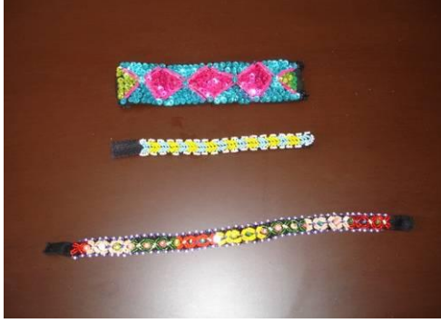
Şekil 23. Boncuk ve pul işi ile üretilmiş çeşitli boyutta bileklikler

faaliyeti sonucunda köye gelen turistlere pazarlanması amacıyla boncuk işleri şekil ve boyut değiştirilerek, aynı geleneksel üretim tekniği ile farklı fonksiyonlara sahip ürünlere dönüşmüştür. Bileklik, boyunluk, duvar süsü, nazarlık, çanta, telefonluk, kemer bu şekilde üretilen ürünlerden bazılarıdır (Şekil 23-29).