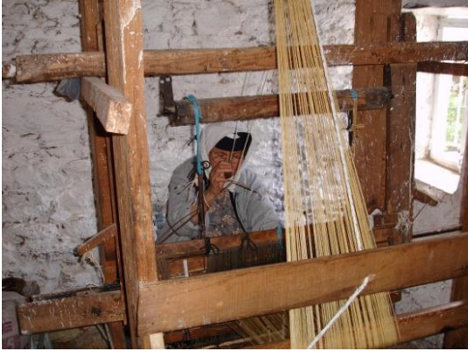
Şekil 16. Çomakdağ-Kızılağaç köyünden ipek dokuyan bir kadın

İpek böceği üretimi ve ipekli dokumacılık da yörenin geleneksel uğraşlarından ve çok eski geçim kaynaklarından biridir. Bugün köyde birçok hane ipekböceği yetiştiriciliği yapmakta ve ipek ipliği üretmektedir. Ancak ipekli dokuma işi yapan kadın sayısı azalmıştır. Köyün tüm üretimini sadece dört kadın dokumaya dönüştürmektedir. İpekli dokumalar en çok “çemper” denilen başörtüsünde kullanılmaktadır (Şekil 16-18) (Çukur ve Etikan, 2011:312).