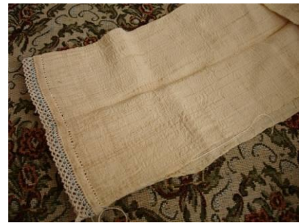
Şekil 9. Geleneksel giysilerden içe giyilen gömleğin kol uçlarına yapılan boncuk işi. (yapım aşamasında)