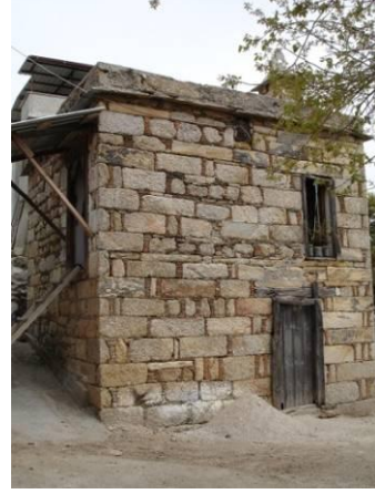
Şekil 4. Çomakdağ-Kızılağaç köyünde bir ev (geleneksel mimariden bir görünüş)