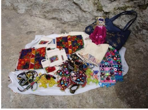
Şekil 20. Çomakdağ-Kızılağaç köyünde üretilen el sanatı ürünlerinin köye gelen turistlere pazarlanması

ürettikleri bu ürünleri genellikle köy meydanında yere ya da düz bir zemin üzerine sererek turistlerin beğenisine sunup pazarlamaktadırlar (Şekil 20-22).