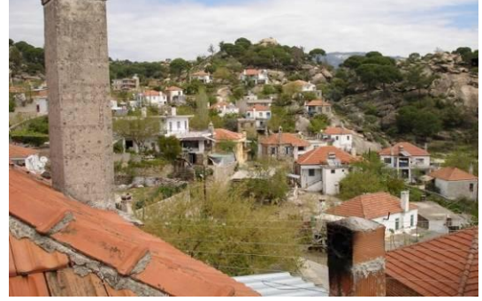
Şekil 2. Çomakdağ-Kızılağaç köyü