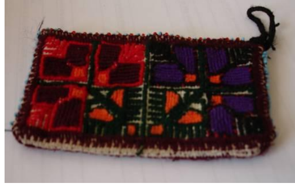
Şekil 31. Eski yaneş işlemelerle oluşturulmuş cüzdan

Yörenin geleneksel uğraşlarından ipekli dokumacılık çok eski geçim kaynaklarından biridir. Ancak günümüzde ipekli dokuma işi yapan kadın sayısı giderek azalmıştır. Köyde sadece dört kadın bu uğraşmayı devam ettirmektedir. İpekli dokumalar en çok “çempere” denilen başörtüsünde kullanılmaktadır (Şekil 16-18). Halen bu amaçla dokunan ve kullanımı devam eden bu ipek kumaşların artık köyün yerli ve yabancı turiste açılması ile masa örtülük kumaş olarak pazarlanması da yaygınlaşmıştır (Şekil 32).