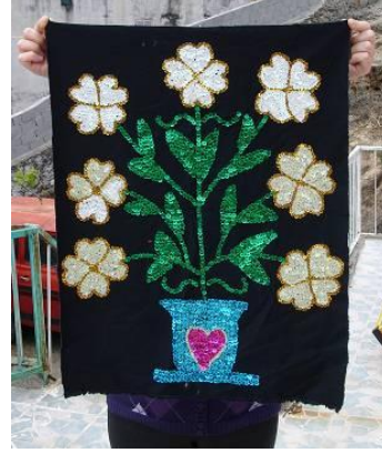
Şekil 28. Boncuk ve pul işi ile üretilmiş duvar süsü