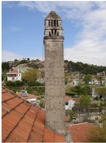
Şekil 5. Köyün geleneksel baca mimarisinden bir örnek