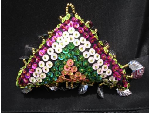
Şekil 25. Boncuk ve pul işi ile üretilmiş nazarlık