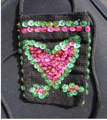
Şekil 27. Boncuk ve pul işi ile üretilmiş telefonluk