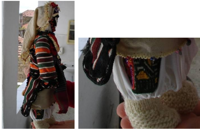
Şekil 15. Geleneksel giyside yaneş işleme ve ayrıntısı