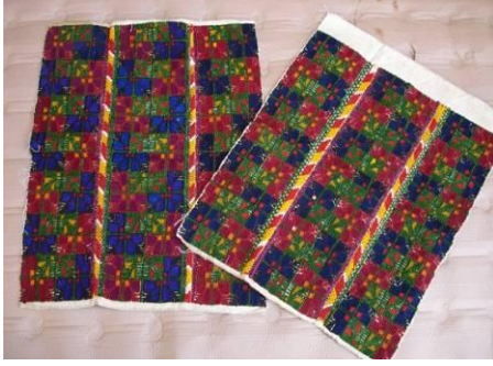
Şekil 12. Bir çift yaneş işleme