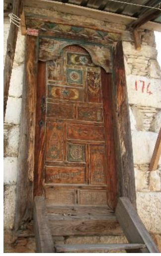
Şekil 7. Geleneksel süslemeli bir kapı örneği

Kadınların uğraşları sonucu ortaya çıkan el emeği, göz nuru el sanatı ürünlerinin geleneksel giysiler aracılığı ile sergilenmesi ve ayrıca satışının yapılması da köyde gerçekleştirilen kırsal turizm faaliyetleri arasında yer almakta ve önem taşımaktadır.