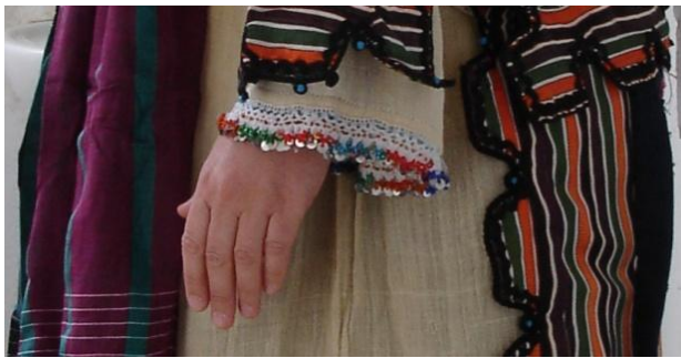
Şekil 8. Geleneksel giysilerden içe giyilen gömleğin kol uçlarına yapılan boncuk işi

Boncuk işi; geleneksel giysilerden içe giyilen uzun gömleğin yaka ve kol uçlarının, başa örtülen ve “çemperi” denilen örtünün altında kalan fes biçimindeki başlığın çene altından geçen ince şerit bağının ve yine geleneksel giyside arkada bele takılan kuşağın üzerinden sarkıtılan uzun dikdörtgen nazarlığın süslenmesi amacıyla yapılmaktadır. Boncuk işinde ayrıca renkli pullar da kullanılmaktadır (Şekil 8-11) (Demir ve Ünal, 2005:59, Çukur ve Etikan, 2011:310).