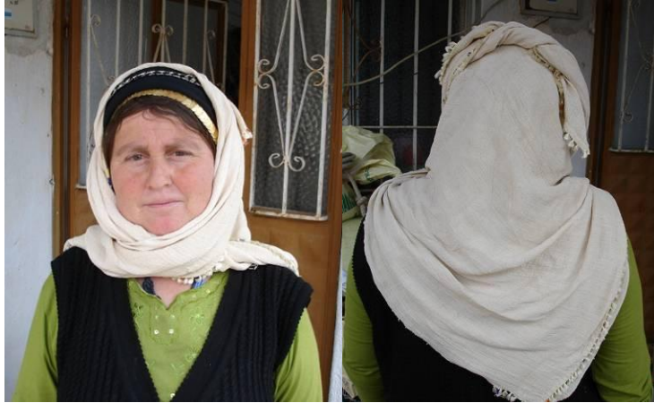
Şekil 18. “Çemper” denilen ipekli baş örtüsünün önden ve arkadan görünüşü

Köyde 2007 yılında Başbakanlık Sosyal Yardımlaşma ve Dayanışma Genel Müdürlüğü ile Kültür ve Turizm Bakanlığı Araştırma ve Eğitim Genel Müdürlüğü işbirliğinde “El Sanatlarını ve Sanatkarlarını Destekleme Projesi” kapsamında “Geleneksel Giysili Çomakdağ Bez Bebek Projesi” başlatılmıştır (Anonim, 2008). Kültürel nitelikli folklorik bebek üretmek amacıyla başlatılan bu projede 4 ay eğitim, 3 ay da üretim olarak planlanan sürecin sonunda 3 usta öğretici ve 23 kursiyer