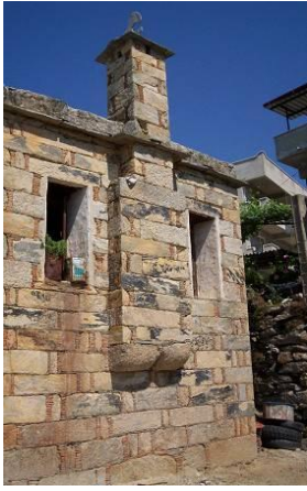
Şekil 3. Çomakdağ-Kızılağaç köyünde bir ev (geleneksel mimariden bir görünüş)