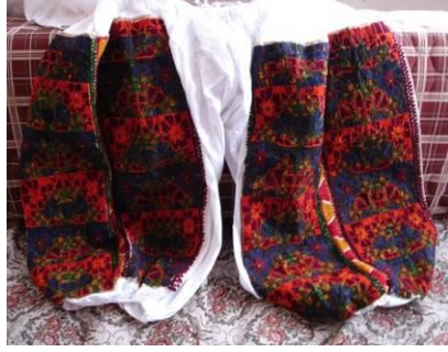
Şekil 14. Geleneksel giysilerden şalvar ve her iki paçasının yan kısımlarına dikilmiş yaneş işlemeli kumaşlar