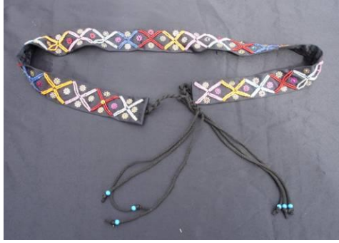
Şekil 29. Boncuk ve pul işi ile üretilmiş kemer

Boncuk işi gibi yaneş işleme de yine geleneksel giysilerin süslenmesi amacıyla uğraşılan bir el sanatıdır. 40x50 cm boyutlarında pamuklu dikdörtgen bir kumaş yüzeyinde boşluk kalmayacak şekilde, ipek ipliği ile yörenin geleneksel motifleri kullanılarak işlenir ve alta giyilen şalvarın her iki paçasının dışa bakan yanlarına dikilir (Şekil 12-15). Geleneksel giyside üç-beş entari denilen üst giysisinden sonra şalvarın aşağıda görünen kısmının süslenmesi amacıyla yapılan ve yörenin gelenekli el sanatı uğraşlarından olan yaneş işleme de bugün farklı fonksiyonlara sahip ürünlerin üretilmesinde kullanılmaktadır. Duvar panosu, cüzdan gibi ürünlerin hazırlanmasında eski işlemler kullanılırken bu amaçla yeniden aynı geleneksel teknikle işleme de yapılmaktadır (Şekil 30-31).