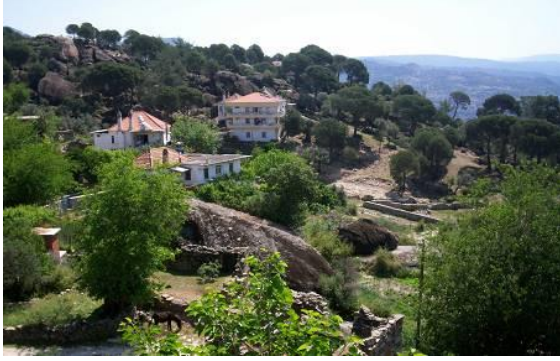
Şekil 1. Çomakdağ-Kızılağaç köyü