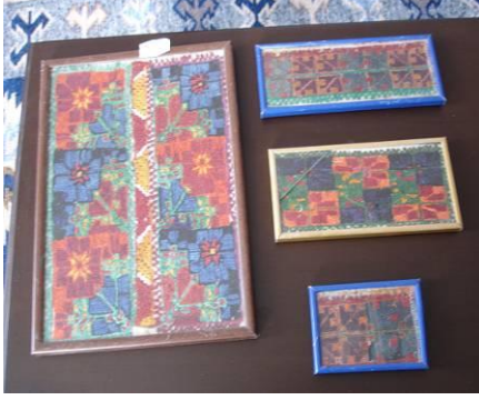
Şekil 30. Eski yaneş işlemelerle oluşturulmuş duvar panoları