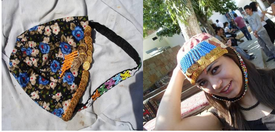
Şekil 10. Boncuk işi ile süslenmiş geleneksel giysilerden başa giyilen fes biçimindeki başlık ve ince şerit şeklindeki bağcı