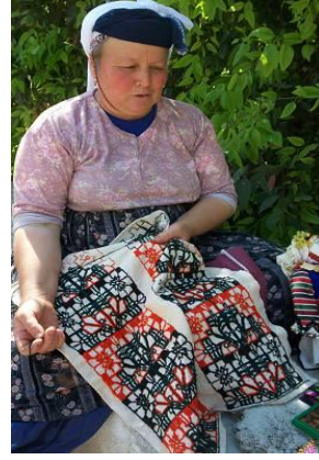
Şekil 13. Çomakdağ-Kızılağaç köyünden yaneş işleyen bir kadın