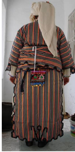
Şekil 11. Geleneksel giyside arkada belden sarkan nazarlık

Yaneş işleme; yine geleneksel giysilerden alta giyilen şalvarın paçalarının her iki yana bakan kısımlarının süslenmesi amacıyla yapılır. Genel olarak 40x50 cm boyutlarında pamuklu dikdörtgen bir kumaş yüzeyinde boşluk kalmayacak şekilde, ipek ipliği ile yörenin geleneksel motifleri kullanılarak işlenir ve her iki paçanın dışa bakan yanlarına dikilir (Şekil 12-15). İşlemede kullanılan ipek ipliklerin renkleri canlı ve parlaktır. Genellikle kırmızı, lacivert, sarı ve yeşilin tonları kullanılır (Ak, 2004:30, Sevinç, 2006:117, Çukur ve Etikan, 2011:311).