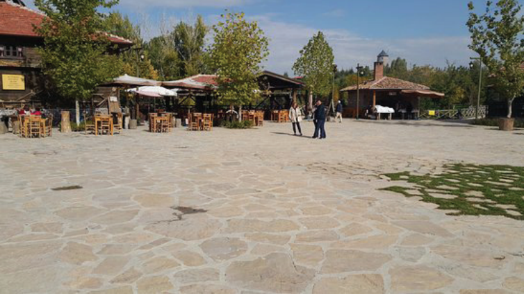
Şekil 9. Köy meydanı (Seda Öztekin Mayıs,2019).