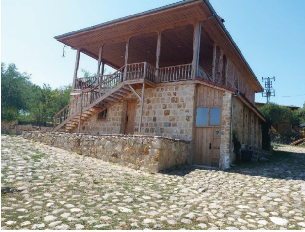
Şekil 5. Ankara Evi örneği (Seda Öztekin Mayıs,2019).

Ülkemizde en son açılan hava müzesi ise, 2016 yılında Ankara'nın Beypazarı İlçesi'nde açılan 'Yaşayan Köy' Anadolu Açık Hava Müzesi'dir (Şekil 5, Şekil 6). Geleneksel ustalık ve el zanaatkarlığına dair izleyerek öğrenme imkânı sunan bir eğitim programı olup, ortaöğretim eğitim kurumları ile anlaşmalı bir biçimde ziyaret gerçekleştirilmektedir.