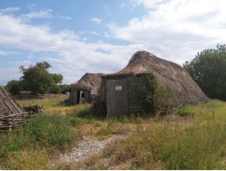
Şekil 2. İğmeli yapıların birbiriyle ilişkili yerleşimi (Seda Öztekin Mayıs,2019).

Açık hava köy müzesi ve arkeopark olma özelliğini taşıyan bir diğer müze, 2015 yılında açılan Bursa, Aktopraklık Höyük Açık Hava Müzesi ve Arkeoloji Okuludur. 2004 yılında kazıya başlanılan alanda, 2010 yılında Bursa Büyükşehir Belediyesi ile yapılan bir protokolle kazılara ve alanın açık hava müzesine döndürülmesi konusunda destek sağlanmıştır. Bu destek kapsamında, yürüyüş yolları, kule, ziyaretçi karşılama binası, çocuk kazı evi, çocuk kazı alanı, kafeterya ve doğal tarih müzesi kısmı eklenmiştir. Bursa'nın Mustafakemalpaşa İlçesi'ne bağlı Eskikızılelma Köyü'nden 6 adet yığma ahşap yapının taşınması işlemi için yerinde belgeleme çalışmaları yapılarak, bağış yoluyla müze alanına taşınmıştır. Yapıların onarımları tamamlandıktan sonra ziyarete açılmıştır. Bu konut örneklerinin her biri dokuma evi, gelin evi, mutfak, köy evi olarak işlevlendirilmiştir. (Şekil 3, Şekil 4)