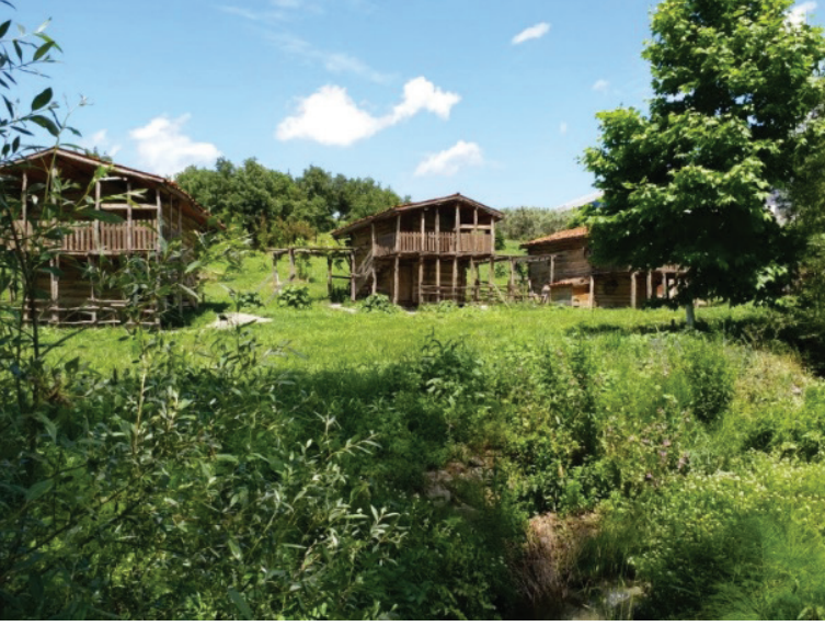
Şekil 3. Geleneksel köy canlandırma alanı (Seda Öztekin Mayıs,2019).