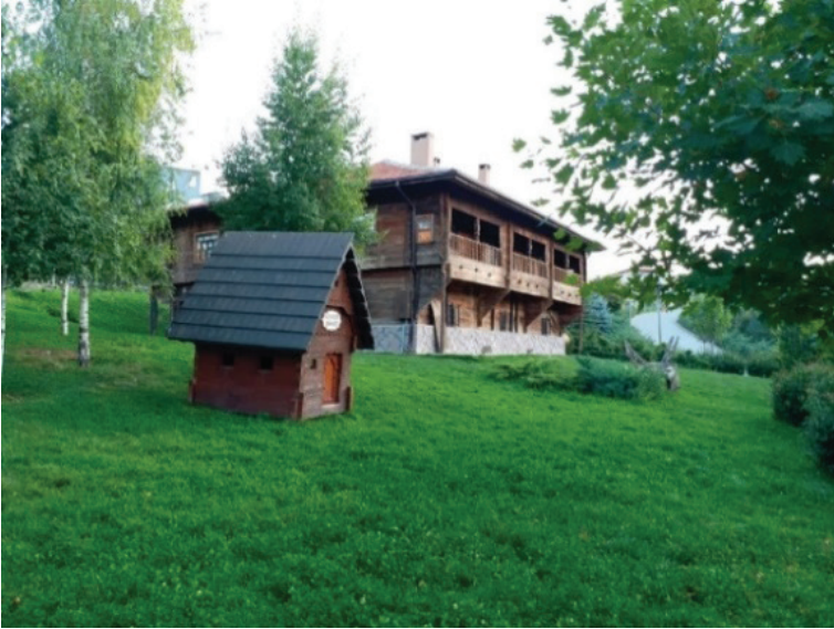
Şekil 10. Hacı Osmanoğlu Konağı (Seda Öztekin Mayıs,2019).