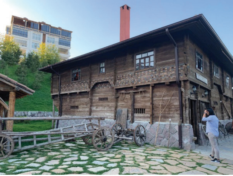
Şekil 11. Köy Oyuncakları Müzesi (ana bina) (Seda Öztekin Mayıs,2019).