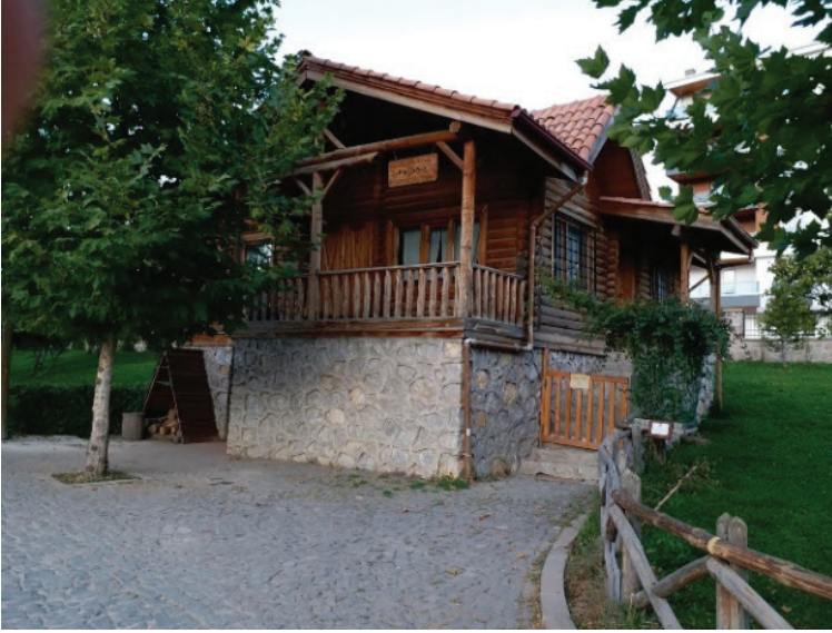
Şekil 13. İnşa edilen ofis yapısı (Seda Öztekin Mayıs,2019).