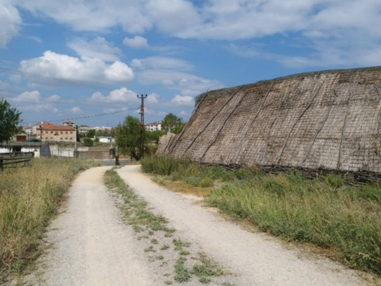
Şekil 1. Müze alanı girişi ve iğmeli yapı konumu (Seda Öztekin Mayıs,2019).

ziyarete açılmıştır. Kazılarda ortaya çıkarılan kalıntıların ve eserlerin toplumla paylaşılması isteği doğrultusunda, kazı alanında iğmeli yapıların inşaat yönteminin öğrenilmesi ve kazıda bulunan yapılara yönelik bilgi oluşturma amacıyla deneysel bir çalışma yapılmıştır [7] İlk olarak Ahmetler Köyü'nden alınan ve kullanılmayan samanlık ile iğmeli yapılar alana taşınarak müze tekrar kurulmuştur. Bu şekilde üç iğmeli yapının iskeletinin kurulması ve üzerinin örtülerek kapatılması ile sergi mekanları oluşturulmuştur. (Şekil 1, Şekil 2) Aşağı Pınar Açık Hava Müzesi'nin iç mekân sergileme yaklaşımı da deneysel nitelikli inşaat uygulamalarına bağlı olarak geliştirilmiştir [8]. Alanda tarih öncesi köy canlandırmasından bağımsız ve ayrı girişi olan deneysel arkeoloji bölümünde çocuklar ve yetişkinler için bir kazı alanı bulunmaktadır. Uygulamaya yönelik bir eğitim programı olmamakla birlikte, çalışan ustaların izlenmesi şeklinde görsel eğitim sunulmaktadır. İleriki yıllarda, arkeoloji bölümünde yaz okulu işletmeye yönelik olarak konukları ağırlama amaçlı konutlar, mutfak vb. birimlerinin yer alacağı bir proje uygulaması planlanmaktadır.