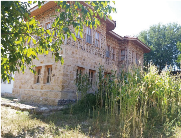
Şekil 6. Göz dolma ev örneği (Seda Öztekin Mayıs,2019).