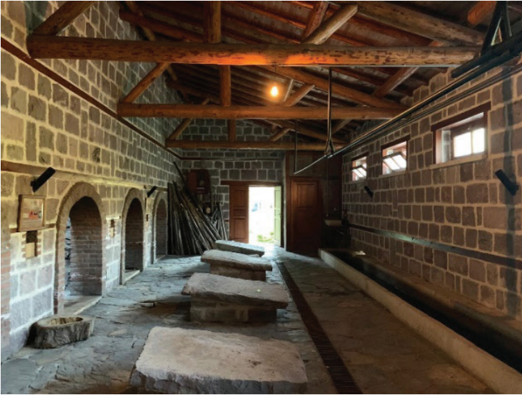
Şekil 12. İnşa edilen çamaşırılık iç mekân (Seda Öztekin Mayıs,2019).