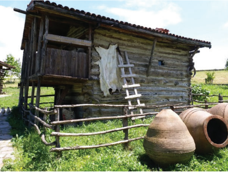
Şekil 4. Taşınan yığma ahşap yapı örneği (Seda Öztekin Mayıs,2019).