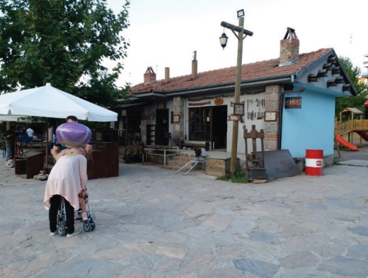
Şekil 8. Atölye yapıları (Seda Öztekin Mayıs,2019).

yine aynı coğrafyadan, yığma ahşap yapılar taşınarak Etnografya Müzesi, Köy Müzesi, Köy Oyuncakları Müzesi ve Yaban Hayatı Tanıtım Müzesi olmak üzere işlevlendirilmiştir (Şekil 10, Şekil 11). Alana taşınarak gelen toplam 33 adet çantı yapıdan başka, arazide inşa edilen 13 adet tomruk, 13 adet taş, beton vb. yapı bulunmaktadır. Alana taşınan yapılardan farklı olarak, burada tasarlanan yapılar da vardır. Çamaşılık ve değirmen ile un değirmeni yapıları burada yapılmıştır. (Şekil 12). Ayrıca, müze ofisi olarak kullanılan yapı yine ahşap yığma tekniğinde tasarlanmıştır. (Şekil 13). Ek olarak, köy evi konseptinde 5 misafir konağı bu alan içerisinde bulunmaktadır. İnşa edilen bu yapıların yapım ve üretim tekniklerinin, alana taşınan geleneksel yapıların tekniklerine benzetilme isteği ve kaygısı açıkça görülmektedir. Müze alanında, köprü değirmen gibi diğer yardımcı yapılar ile birlikte toplam 106 adet yapı bulunmaktadır. Ayrıca, evcil ve yabani hayvanlar ile bir tarım alanı da bulunmaktadır. Günlük ve periyodik bakımlar ile evcil hayvanlardan sağlanan ürünlerin satışı ile, buğday ekim alanlarından üretilen unun satışı yapılmaktadır.