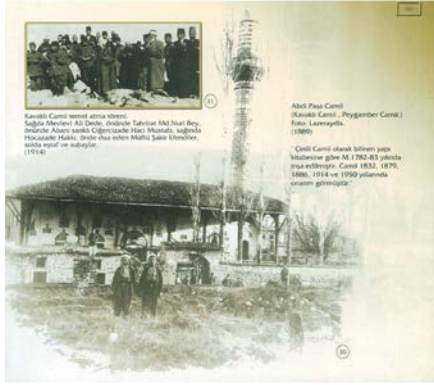
Şekil 5. Kavaklı Camii (1889)

yükselir. Köşeleri pahlı pabuçla geçilen gövdenin şerefe altları mukarnaslıdır. Son cemaat yeri yedi sütunla desteklenen düz ahşap tavanlıdır. Üstten kırma çatıyla örtülüdür. Harimin son cemaat yerine bakan cephesinde üstte beş, altta dört adet sivri kemerli pencere vardır. Eksende bir giriş kapısı yer alır. Cephe yüzeyinde, mihrabiyeler ile bunların çevresinde yoğunlaşan XVIII. yy. Kütahya çinileri bu cephede önemli süslemeyi oluşturur. Duvar üzerinde bitkisel ve geometrik süslü devşirme malzemeler de vardır. Harim içi, ahşap direklerle üç bölüme ayrılmıştır (Şekil 5, 6).