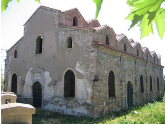
Şekil 12. Aya Baniya Kilisesi (2007)