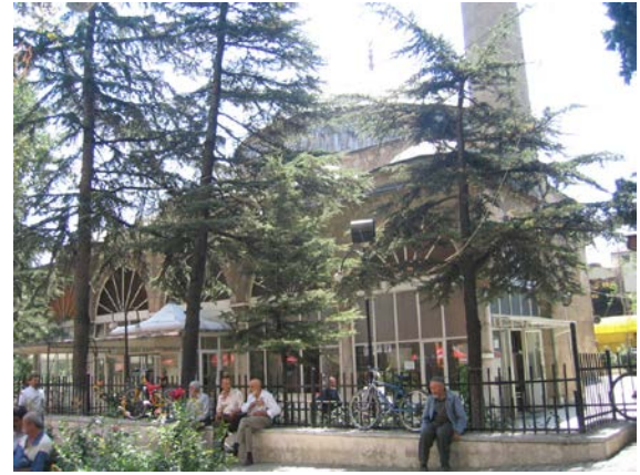
Şekil 4. Mimar Sinan Cami (2007)

Örtü sistemi, cephelerde altı sütuna oturan sivri kemerlerle desteklenmiştir. Kemer gözleri bugün camekanlarla örtülüdür. Son cemaat yerine açılan caminin kuzey cephesinde harime giriş kapısı ve pencereler yer alır. Harim, pandantiflerle geçilen kubbe ile örtülü olup, cephelerde 15, kubbe eteğinde 8 pencere ile aydınlanmaktadır (Şekil 3, 4).