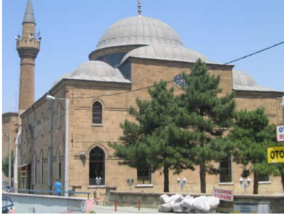
Şekil 2. Ulu Cami (2007)