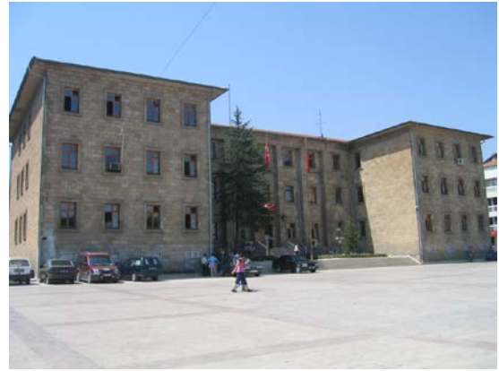
Şekil 14. Valilik Binası (2007)