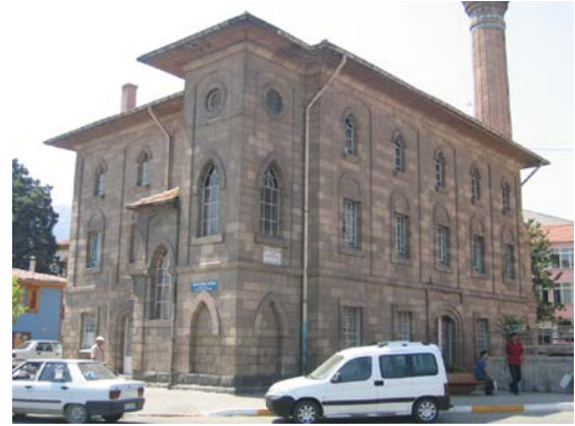
Şekil 8. İplikçi Camii (2007)