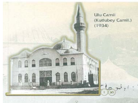
Şekil 1. Ulu Cami (1934)

Gövdede biri pabuçtan sonra, diğeri şerefeye yakın bölümde birer silmeli taş bilezik yer alır. Şerefeye altı mukarnaslı olup, korkuluklarla geometrik taş süslemeler vardır. Petek üstünde yükselen külah kurşun kaplamadır (Şekil 1-2).