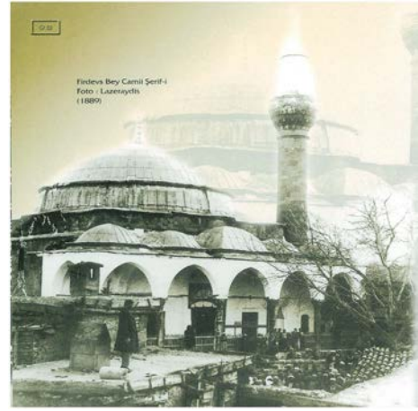
Şekil 3. Mimar Sinan Cami (1925)