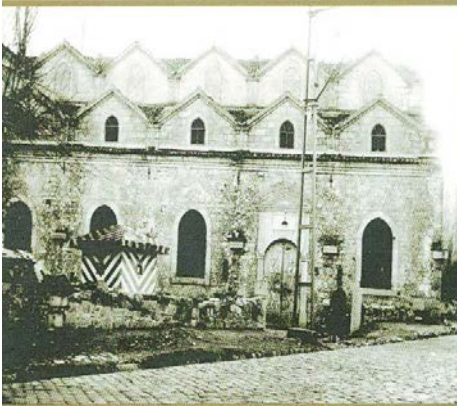
Şekil 11. Aya Baniya Kilisesi (1971)

1993 yılında restorasyon kapsamına alınmış; fakat fazla bir çalışma yapılamamıştır. 1999 yılında kilisenin çatısı tamamıyla yenilenmiştir (Şekil 11, 12).