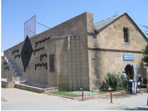
Şekil 16. Bedesten (2007)