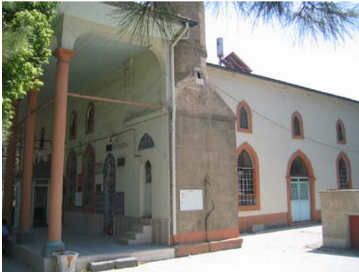
Şekil 6. Kavaklı Camii (2007)

İplikçi Camii (Halil Hamit Paşa Camii, Abdi Ağa Camii, Orta Camii)