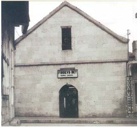
Şekil 15. Bedesten (1970)