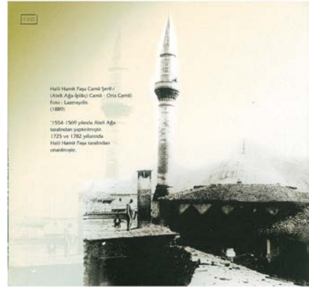
Şekil 7. İplikçi Camii (1889)

Basık kemerli girişten merdivenlerle kütüphanenin üstünde yer alan harim kısmına girilir. Hafif enine dikdörtgen planlı harim kısmı, iki sıra altı sütun tarafından üç sahına ayrılmıştır. Ortadaki sahin diğerlerinden geniştir. Orta sahin tekne tavanlı, diğer sahinler düz örtüdür. Harimin kuzey bölümünde kadınlar mahfili yer almaktadır. Buraya çıkış harime girişin güneyindeki merdivenlerle sağlanmaktadır. Minare caminin kuzeybatı köşesine yapılmıştır (Şekil 7, 8).