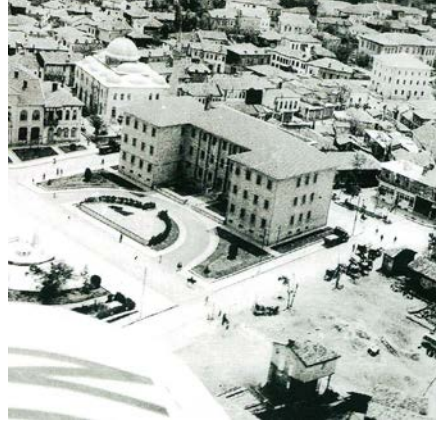
Şekil 13. Valilik Binası (1959)

koridora girilir. Üst katlara çıkış, giriş karşısındaki ve koridor sonlarında yer alan ahşap kaplı, süslemesiz demir korkuluklu merdivenlerle sağlanmaktadır. Odalarda ve koridorda herhangi bir süsleme yoktur. Bina pencereleri eşit büyüklükte olup, söveleri bina duvarından hafif dışarı taşkın şekilde yapılarak belirgin hale getirilmiştir. Güney cephe ortasında kilit taşı vurgulanmış demir kapılı küçük bir giriş bulunmaktadır. Üstü kiremitli, kırma çatı ile örtülüdür (Şekil 13, 14).