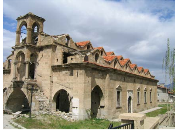
Şekil 10. Aya Yorgi Kilisesi (2007)