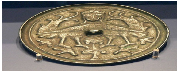
Fotoğraf-13 (URL-19): Türk-Selçuklu Aynası Hüma Kuşu, Harpy. 12-13.yy.

Yukarıda örnek verilen Hüma Kuşu motifli seramikler, İngiliz Bringeus'un söylediği en eski, en iyidir sözünden yola çıkılarak değerlendirilip, kilim, para, süs eşyası, ayna vb. ürünler Türk arkeofolklor ürünü olarak tekrar popüler bir kültür ürünü haline gelebilir.