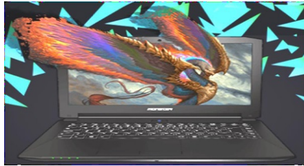
Fotoğraf-14 (URL-20): Bilgisayar markası olan Monster’ın tanıtım görseli.

Hüma Kuşu’nun süresiz uçabilme özelliği pazarlanabilecek tüm öğelerin reklamını yapmaya uygun bir joker gibidir. Elektrikli eşyaların reklamlarında, hava ve kara yolları araçlarının tanıtımında hız, dayanıklılık ve zamanın önemli olduğu tüm alanlarda Hüma Kuşu önemli bir reklam aracı olarak değerlendirilebilir.