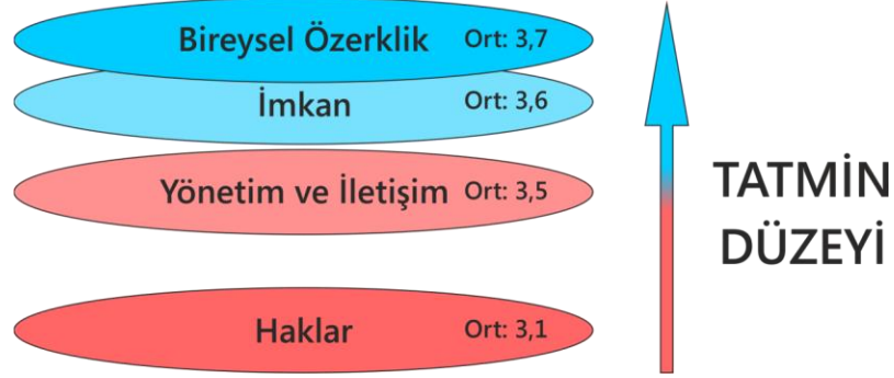
Şekil 2: Tatmin Düzeylerinin Boyutlara Göre Genel Görünümü

Demirel Üniversitesi araştırma görevlilerinin iş tatmin boyutlarındaki tatmin düzeyleri boyutlara göre farklılık göstermektedir.