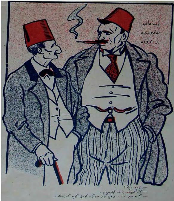
Resim 10. Güleriüz , 28 Eylül 1922 (1338), Sayı: 76

Refik Halid’in yazıları karşısında Güleriüz dergisinin sergilediği kontrollü tavır 30 Ağustos 1922 tarihinde Başkumandanlık Meydan Muharebesi’nin kazanılması ile sertleşir. Refik Halid’e verilen uyarı düzeyindeki cevaplar yerini “son”un dile getirildiği karikatürlere bırakır.