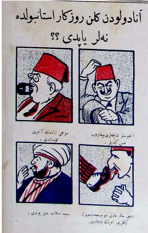
Resim 11. Güleryüz , 28 Eylül 1922 (1338), Sayı: 76

Refik Halid'in sergilediği bu tutum değişikliğini Güleryüz dergisinin sayfalarında bütün Milli Mücadele karşıtlarının kazanılan zafer karşısında geldikleri nokta olarak tanımlanır.