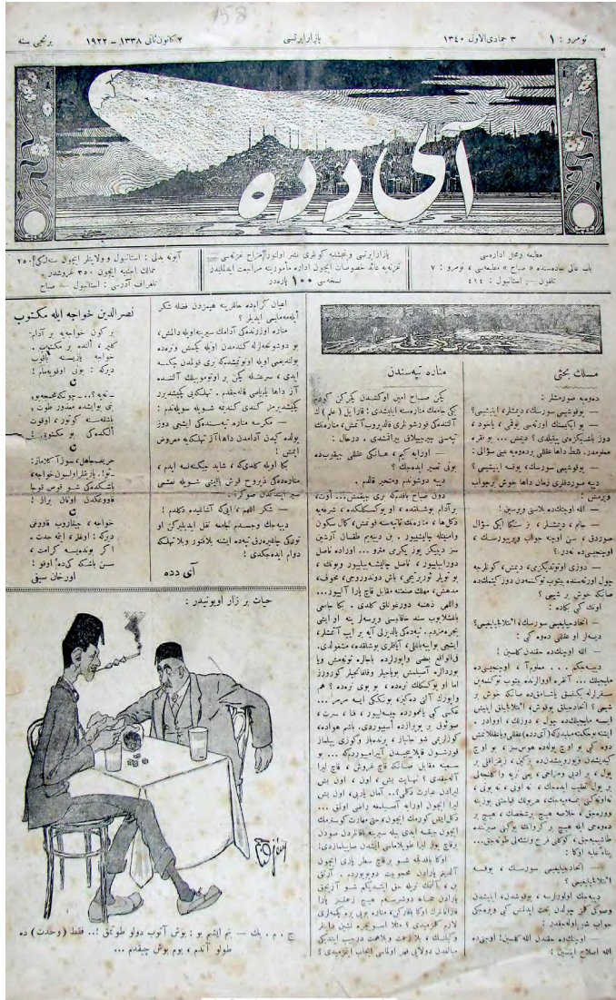
Resim 3. Aydede, 2 Ocak 1922 (2 Kanunusani 1338), Sayı: 1

Aydede 'nin serlevhasında İstanbul silueti üzerine düşen hilal şeklinde bir ay görünmektedir. İstanbul üstünde parlayan bu ay, Refik Halid'tir. Serlevhanın altında "Pazartesileri ve perşembe günleri neşr olunur mizah gazetesi" ve "Abone bedeli: İstanbul ve vilayetler için senelik 250 memalik-i ecnebiye için 350 kuruştur" ibaresi yer alır.