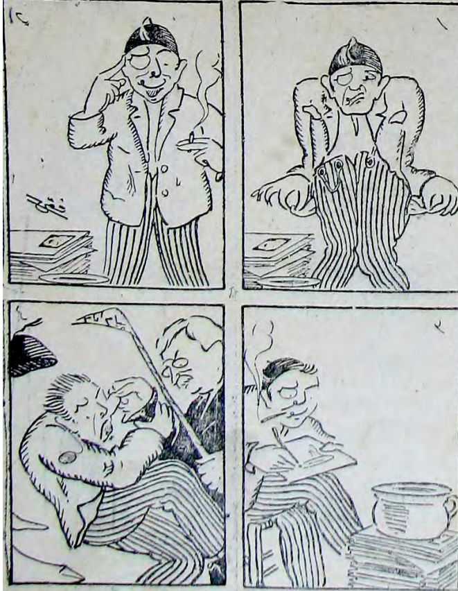
Resim 6. Aydede , 9 Ocak 1922 (9 Kanunusani 1338), Sayı: 3, s. 1