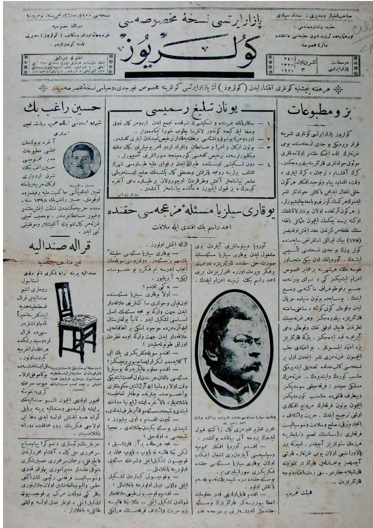
Resim 2. Güleriyüz Pazartesi Nusha-i Mahsusası, 3 Ekim 1921 (3 Teşrinievvel 1337), Sayı: 1