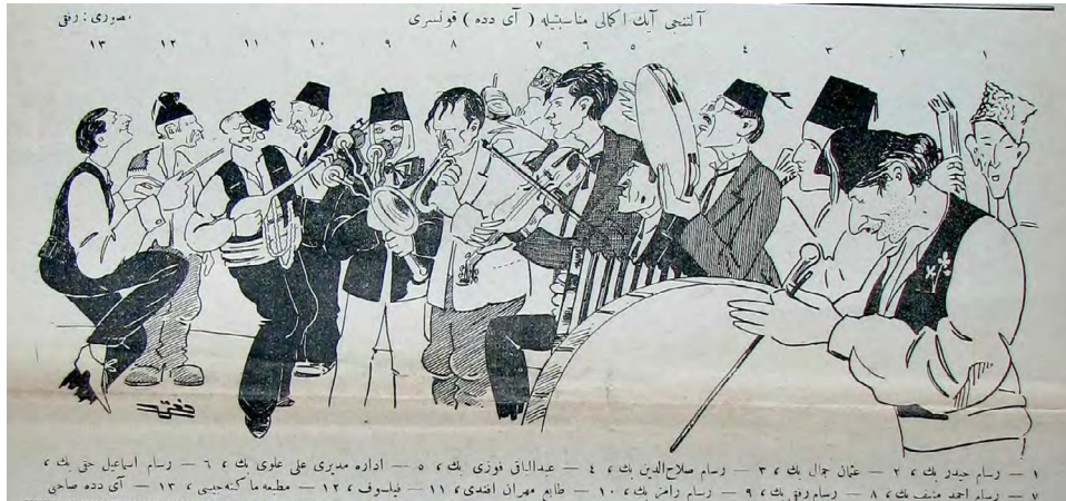
Resim 4. Aydede, 3 Temmuz 1922 (1338), Sayı: 53, s.1