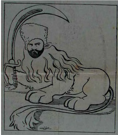
Resim 9. Aydede , 30 Ocak 1922 (30 Kanunusani 1338), Sayı: 9

Bereket ki (Güler yüz)ün İstanbul'da revacı yok... Olsa idi burada da böyle bir illetten vefayat vermemizden ciddi korkulurdu! ( Aydede , 23 Ocak 1922 (23 Kanunusani 1338), Sayı:7)