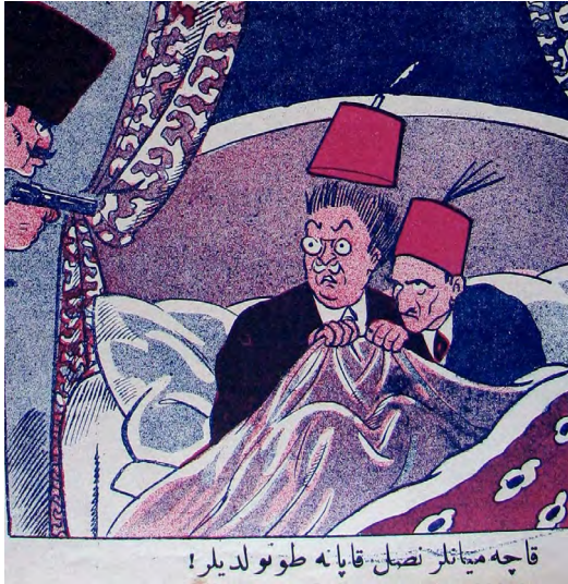
Resim 12. Güleryüz , 9 Kasım 1922 (9 Teşrinisani 1338), Sayı: 83

-Pek memnun oldum. Demek o da "peyam" ile "sabah"a kavuştu!... ( Güleryüz , 16 Kasım 1922 (16 Teşrinisani 1338), Sayı: 83)