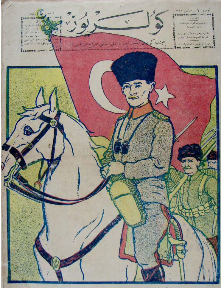
Resim 1. Güleryüz , 5 Mayıs 1921 (1337), Sayı: 1

Senelik abonesi (50) altı aylık (20) üç aylığı (12) nüsha itibar olunur. ( Güleryüz , 5 Mayıs 1921 (1337), Sayı: 1)