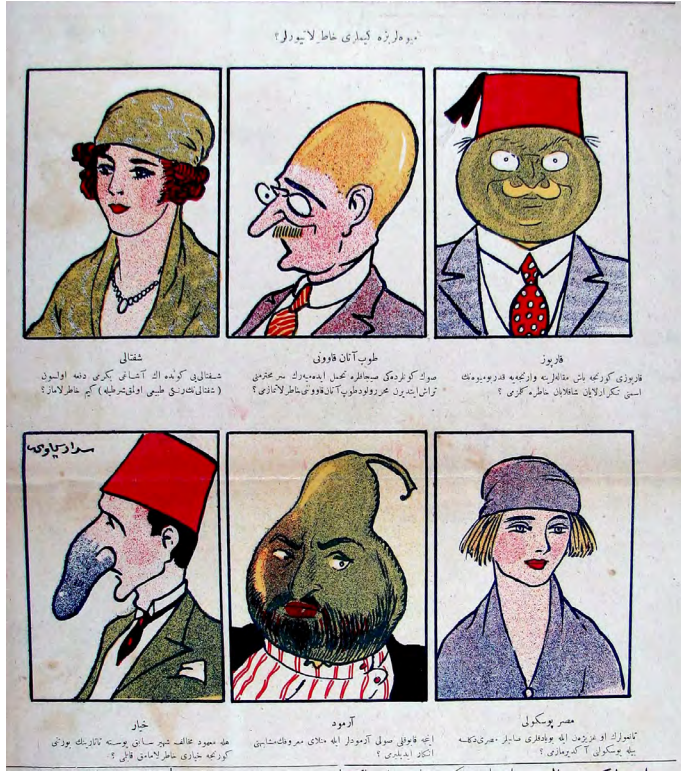
Resim 8. Gülyüz, 10 Ağustos 1922 (1338), Sayı: 69, s. 4 “Meyveler bize kimleri hatırlatıyor?”