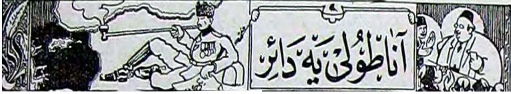
Resim 13. Güleriyüz dergisi “Anadolu’ya dair” köşesi serlevhası

Ahmet Rıfki tarafından çizilen köşenin serlevhasının sağ tarafında konuşan kilolu biri (muhtemelen Yunus Nadi), sol tarafında ise Anadolu haritası üzerine uzanarak sigara çubuğu tütüren Mustafa Kemal yer alır.