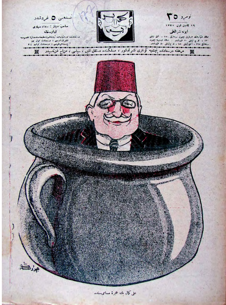
Resim 7. Gülyüz, 29 Aralık 1921 (9 Kanunuevvel 1337), Sayı: 35

2 Ocak 1922 (2 Kanunusani 1338) tarihli ilk sayısında “akıllı deve”nin yolunu seçtiğini beyan eden Aydede 'nin Gülyüz 'e sataşmasının altında Gülyüz dergisinin 35. sayısının kapağında yer alan karikatür vardır. Gülyüz dergisinin 35. sayısının kapağında “ Ali Kemal Bey hücre-i mesaisinde ” lejandlı, Cevat Şakir tarafından çizilen bir karikatür yer alır. Karikatürde Ali Kemal bir lazımlık içerisinde ve sadece başı görünmektedir.