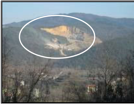
a) Yılmaz AŞ.'ne ait ocak alanı.