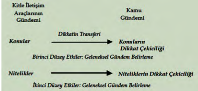
Şekil 1 – Birinci ve İkinci Düzey Gündem Belirleme

Kaynak: McCombs, 2014, 71; Aktaran: Yaşın, 2008: 29.