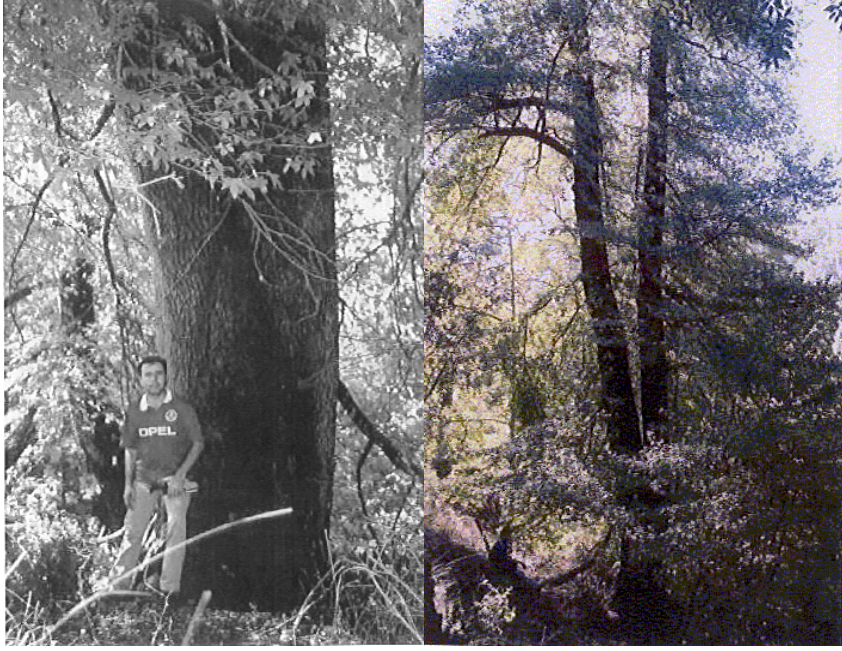
Şekil 2. Çatal Sığla; Çap: 130,6 cm, Boy: 34 m, Yaş: Belirsiz.

bölünerek ağaçların taç çapları belirlenmiştir. Hesaplanan değer 0,5 m hassasiyetle aşağıya yuvarlanmıştır. “Çatal Sığla” taç çapı 12, 5 m olarak belirlenmiştir (Çizelge 1).