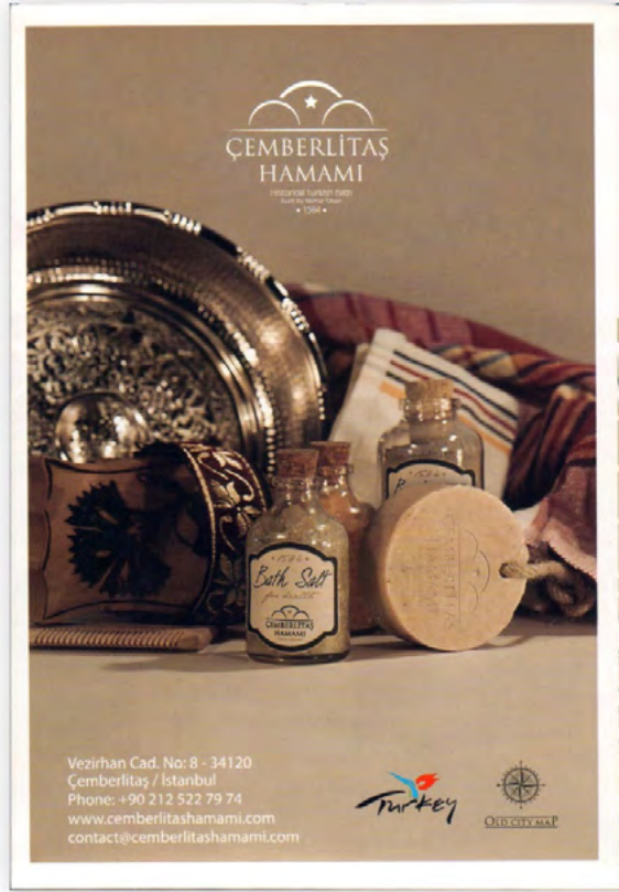
Görsel 18. Çemberlitaş Hamamı Broşürü

Çemberlitaş Hamamı'nın tanıtımı için profesyonel destek alınmış, farklı dilleri kapsayan bir web sitesi tasarlanmıştır. Çemberlitaş Hamamı çok sayıda yerli ve yabancı filmin çekildiği bir mekandır. Türkiye'de "Son Umut" adı ile gösterime giren Russell Crowe'un yönetmenliğini ve başrolünü üstlendiği "The Water Diviner" filminin bazı sahneleri Çemberlitaş Hamamı'nda çekilmiştir.