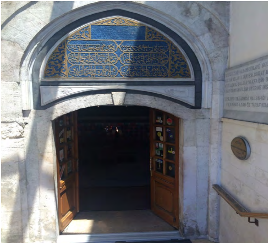
Görsel 7.Çemberlitaş Hamamı'nın Girişi