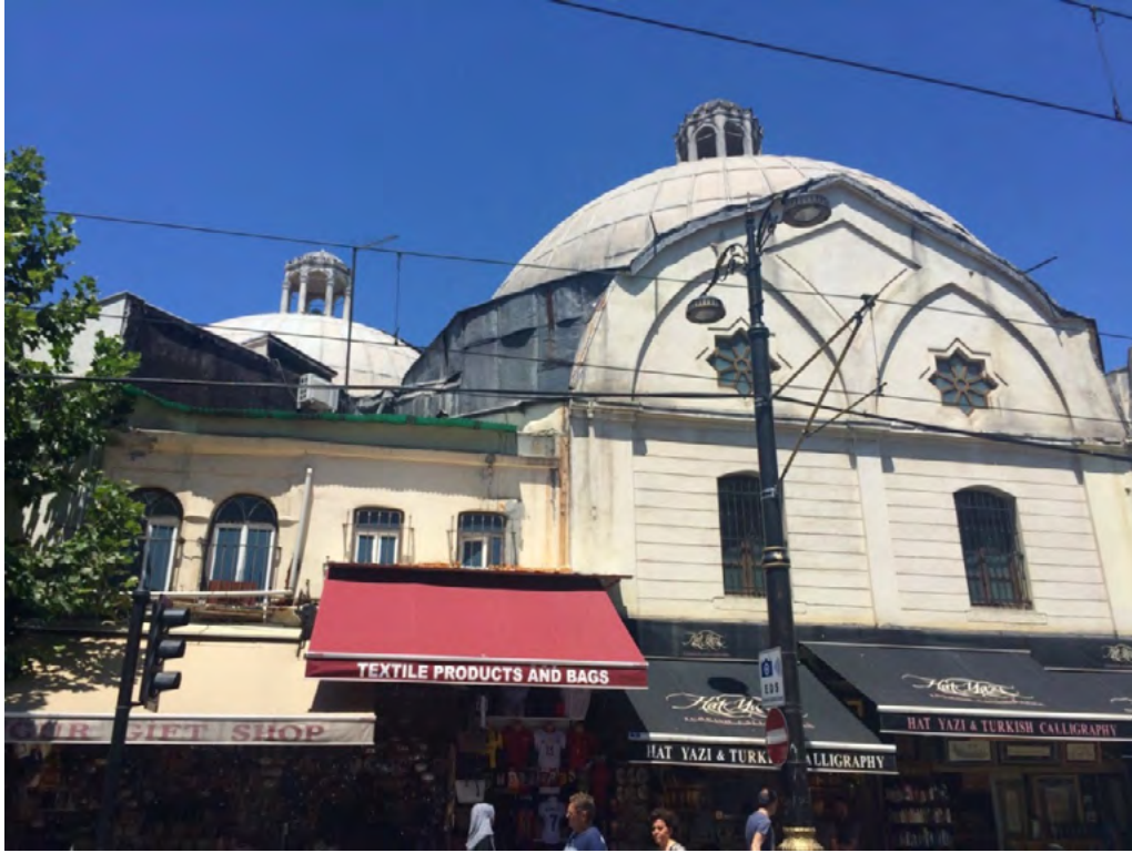
Görsel 6.Çemberlitaş Hamamı'nın Genel Görünüşü