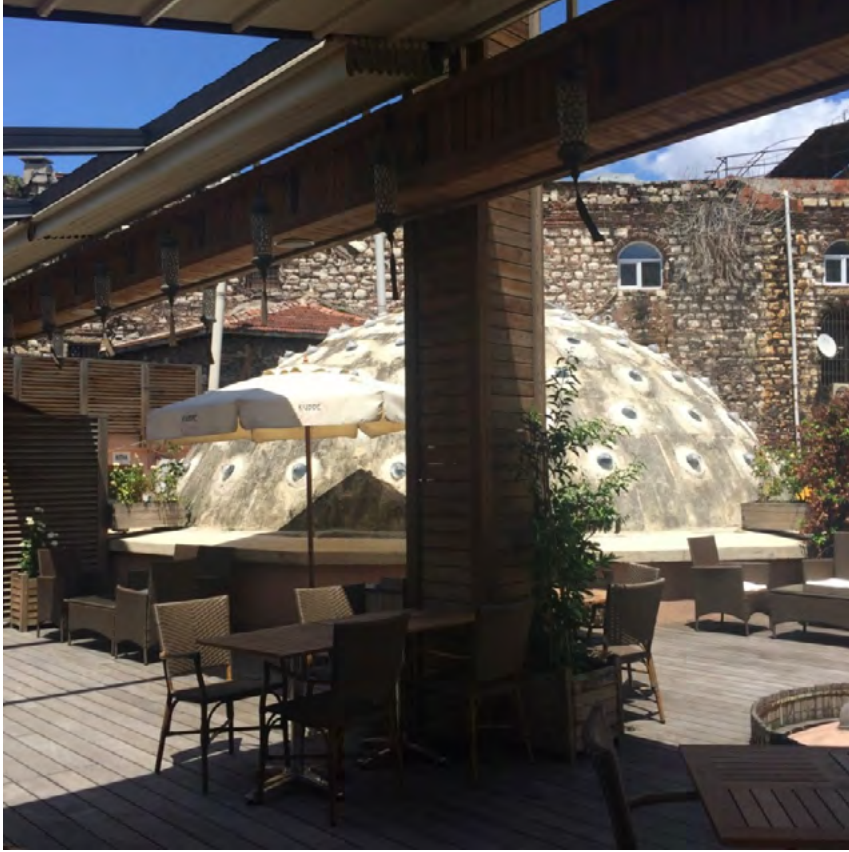
Görsel 16. Çemberlitaş Hamamı Kubbe Cafe

Son yıllarda Çemberlitaş Hamamı’nda “gelin hamamı” taleplerinde artış olduğu dikkat çekmektedir. Gelin hamamı bazen kınayı da kapsamaktadır. Aynı zamanda, damat hamamı, hamamda doğum günü ya da lohusa hamamı ile ilgili talepler de olabilmektedir. Bu etkinlikler genel olarak Kubbe Cafe’de müzik eşliğinde yiyecek servisi ile başlamakta, daha sonra hamam sefasına geçilmektedir (Görsel 16). Çemberlitaş Hamamı’nın bir müzik arşivi bulunmakta, Kubbe Cafe’de hafif yiyecek ve içecekler sunulmakta, ancak arzu eden müşteriler, müzik ve yiyecekleri kendileri getirebilmektedir.