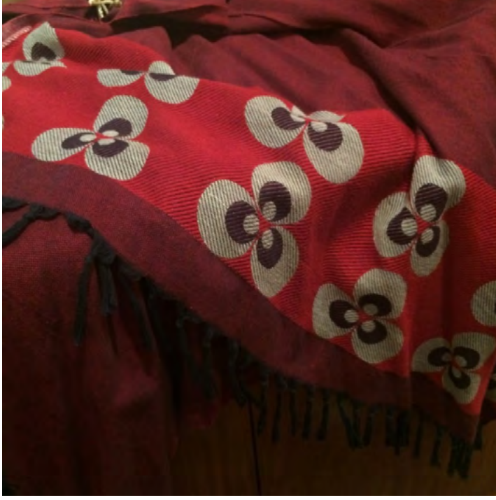
Görsel 14.Çemberlitaş Hamamı İçin Üretilen Özel Tasarım Peştamal Örneği

Mağazada satılan peştamalların bir bölümü Çemberlitaş Hamamı için özel olarak tasarlanmıştır ve bunlar, Çemberlitaş Hamamı için Denizli’de özel olarak üretilen geleneksel dokumalardır (Görsel 13 ve Görsel 14).