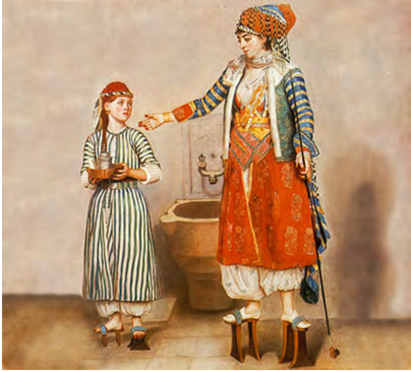
Görsel 1. Hamamda Kadın ve Hizmetçisi (Jean-EtienneLiotard/1702-1789)