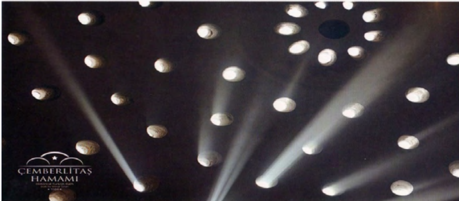
Görsel 17. Çemberlitaş Hamamı'nın Tanıtımı İçin Hazırlanan Bir Kartpostal Örneği

Çemberlitaş Hamamı’nın tanıtımı için kartpostal (Görsel 17) ve broşürler (Görsel 18) hazırlanmıştır.