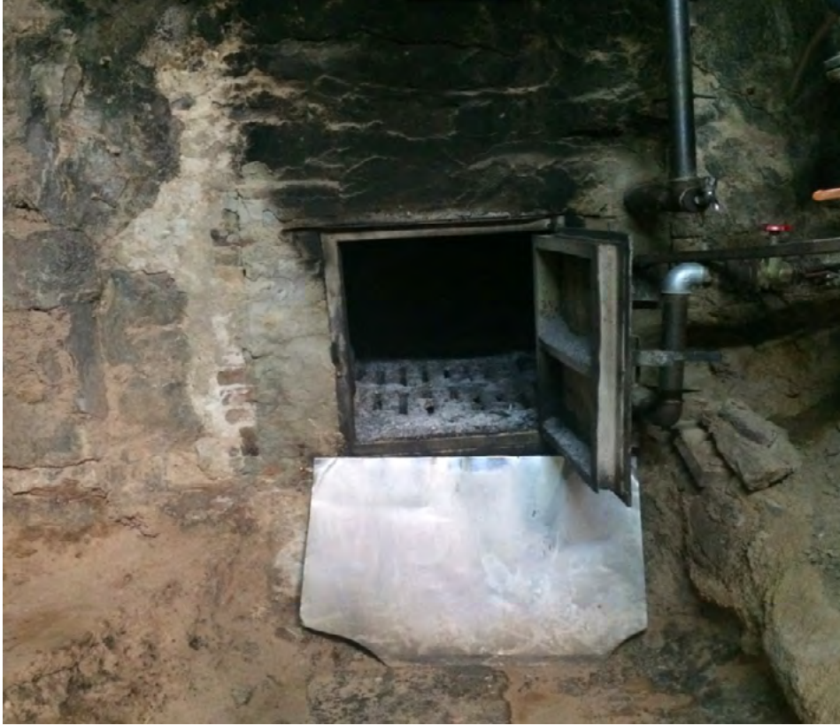
Görsel 11. Çemberlitaş Hamamı'nın Külhan Bölümü

Sıcaklığın planı soğukluğa benzer, ancak burada küçük yıkanma yerleri ve duvarlarda gömme sütunlu nişler kullanılarak kare biçimindeki mekan, dairesel veya onikigen bir hale getirilmiştir. Sıcaklığın merkezi konumu çok büyük mermer bir göbektaşı ile vurgulanmaktadır. Göbektaşı müşterilere kese yapılan yerdir. Hamamın kadınlar bölümü bazı değişikliklere maruz kalmıştır. Caddenin genişletilmesi için yapılan çalışmalar, binanın yan tarafında yer alan kadınların giriş kapısının kaybolmasına ve kadınlara ait soğukluğun küçülmesine neden olmuştur. Soğukluğun kalan kısmı bir süre turistlere yönelik bir restoran olarak hizmet vermiştir. Ancak, daha sonra bu bölüm orijinal işlevine kavuşturulmuştur. Suyu ve yer altı ısıtma tertibatı vasıtası ile sıcaklığın taban ve duvarlarını ısıtan külhan, binanın arkasında yer alır (Görsel 11 ve Görsel 12). Külhancı odun yakarak ateşin devamlılığını ve ısıtma sisteminin düzgün çalışmasını sağlar (Ergin, 2011: 185-187).