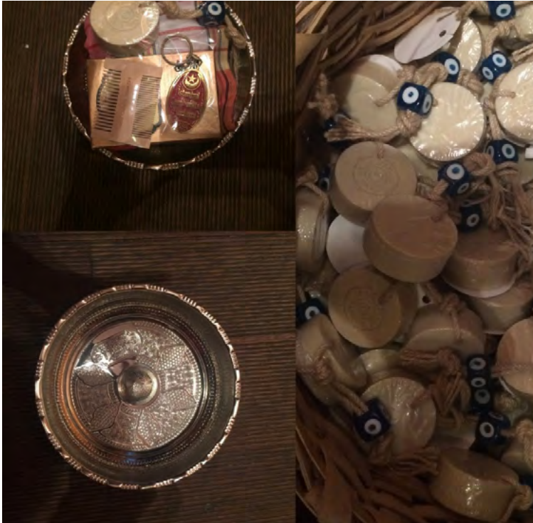
Görsel 15. Çemberlitaş Hamamı’nda Satılan İç Mekân Objeleri

Bu mağazada satılan hamam tası, sabun, takunya, kese gibi ürünlerde “Çemberlitaş Hamamı” amblemi bulunmaktadır (Görsel 15 ).