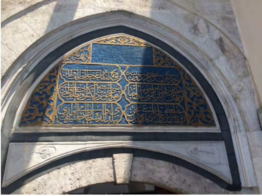
Görsel 8. Çemberlitaş Hamamı'nın Giriş Kapısında Yer Alan Kitabe

Geçmişte erkeklere ait olan bu giriş, kadınlar ve erkekler tarafından ortak kullanılmaktadır (Görsel 9). Çemberlitaş Hamamı'nın kare biçimli zemin planında kadınlar ve erkekler için ayrı kısımlar yer almaktadır. Hamama gelenler öncelikle kare biçimli soğukluğa girerler. Soyunmak, sohbet etmek ve bir şeyler atıştırmak için kullanılan soğukluktan, küçük kubbeleri ile dikkat çeken dar ve uzun bir koridor olan ılıkluğa geçilir. Yüksek sıcaklığa vücutlarını alıştıranlar, kare biçiminde büyük bir merkezi kubbe ile örtülü sıcaklığa geçerler (Görsel 10).