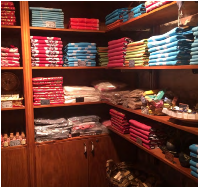
Görsel 13. Çemberlitaş Hamamı İçin Üretilen Özel Tasarım Peştamallar