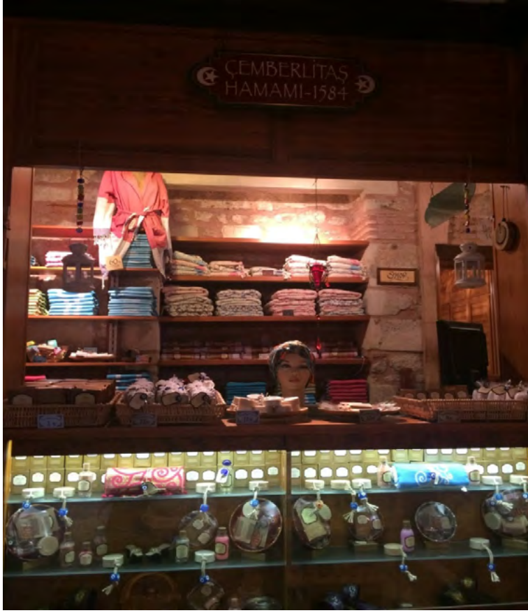
Görsel 12. Çemberlitaş Hamamı Satış Mağazası