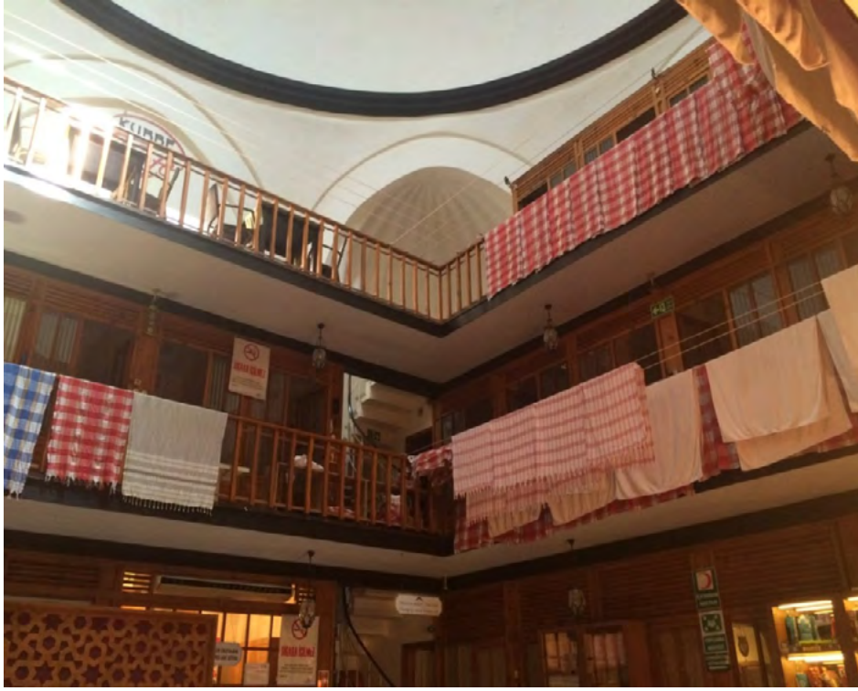
Görsel 9. Çemberlitaş Hamamı'nın Camekan Bölümü