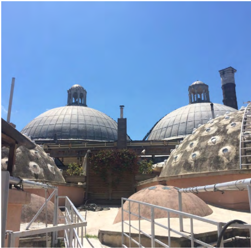
Görsel 10. Çemberlitaş Hamamı'nın Soğukluk, Sıcaklık ve Ilıklık Kubbeleri