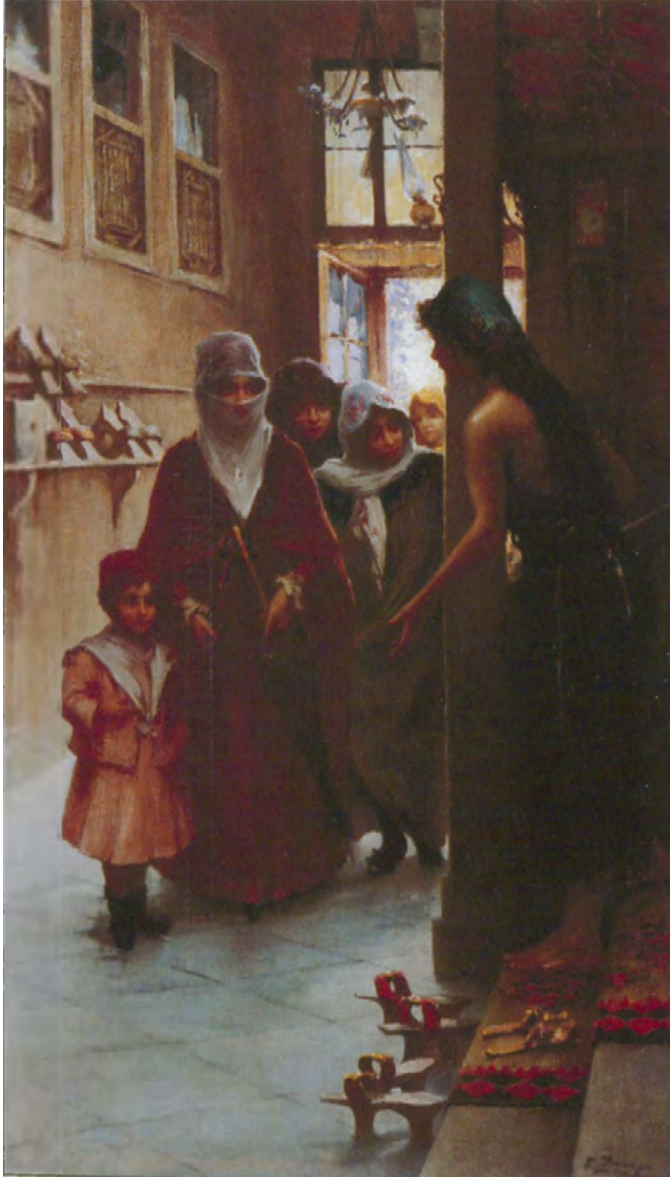
Görsel 3. Hamama Gelen Bir Aileyi Karşılama (Fausto Zonaro/1854-1929) ( http://docplayer.biz.tr/10606557-On-kapak-fausto-zonaro-1854-1929-hamam-uclemesi-yikanis-dan-detay-arka-kapak.html )