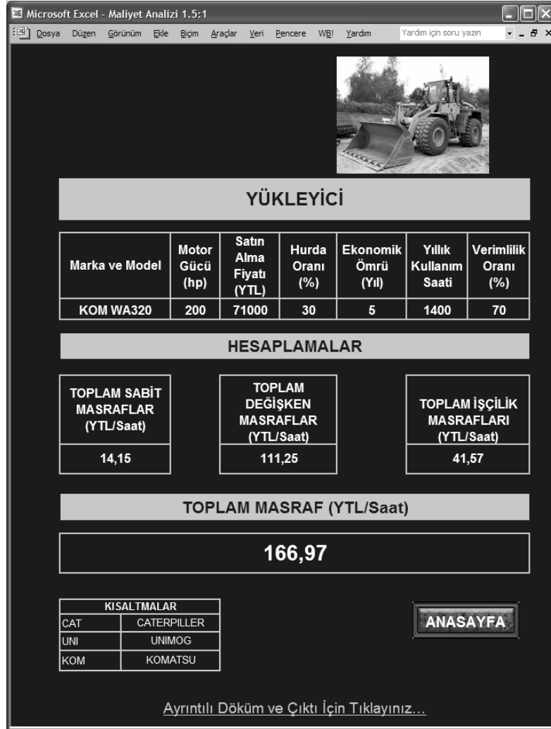
Şekil 3. Maliyet hesaplarının sonuçlarının sunulduğu sayfa

Kullanıcının analiz yapmak istediği aracın Maliyet Analizi 1.5 programının listesinde bulunmaması durumunda, "Listede Bulunmayan Araçlar için Hesapla" butonuna basılarak gerekli verilerin programa girileceği "Manual Hesaplama" sayfasına geçilmektedir (Şekil 4). Bu veriler; araç türü, marka ve model, motor gücü, satın alma fiyatı, hurda oranı, ekonomik ömür, yıllık kullanım saati, verimlilik oranı, yağ fiyatı, mazot fiyatı, tekerlek fiyatı, bakım ve tamir oranı, tekerlek ömrü, operatörün aylık maaşı, formenin aylık maaşı ve yağcının aylık maaşından oluşmaktadır. Bazı verilerin girilmesinde "Açıklama Pencereleeri" yardımı ile kullanıcıya standart olarak kullanılan değerler sunulmaktadır. Veriler girildikten sonra kullanıcı "HESAPLA" butonuna basarak manual hesaplama sonuçlarının yer aldığı sayfaya geçmektedir.