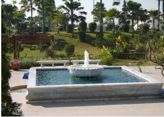
Şekil 2. Türk Bahçelerinde suyun kullanımı (Anonim)

Bahçelerde yer alan bir başka su elemanı da selsebillerdir. Bahçe duvarlarında, köşklere, divanhanelerde yer alan bu yapılar, genellikle havuza ince bir kanalla bağlıdır ve su bu kanaldan havuza akar. Selsebiller de kanallar da mermerden yapılmıştır. Selsebillerin çeşmelerden farkı, hem gözü hem kulağı zevklendirmesidir (Tarhan, 1998). Şekil 2’de bahçelerde yer alan su ögesine örnek (havuz) görülmektedir.