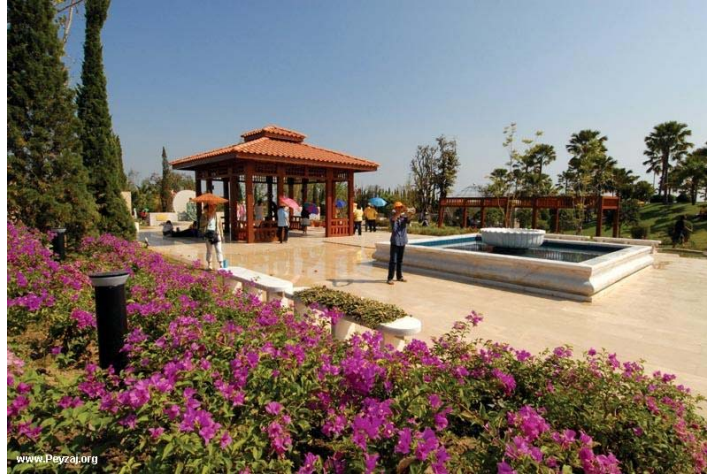
Şekil 3. Türk Bahçesine bitkisel materyaller (Anonim)

Türk Bahçelerinde çiçekler, bir mozaik teşkil edecek şekilde karışık olarak ekilmezdi. Her yastıkta aynı cinsten ve aynı renkten küme küme çiçekler bulunurdu. Bu anlayışın, dağlardaki uçsuz bucaksız papatya ve gelincik tarlalarının hatırasını devam ettirdiği düşünülebilir (Ayvazoğlu, 1995). Bahçelerde çiçeklerin, havuz ve bina çevrelerinde tek tür ve tarhlar halinde kullanılmaları dikkat çeken bir özelliktir (Şekil 3). Bahçelerde gül, lale, nergis, karanfil, fulya, şebboy, şakayık ve sardunya gibi çiçekler yaygın olarak kullanılmıştır (Merdoğlu Bilaloğlu, 2004).