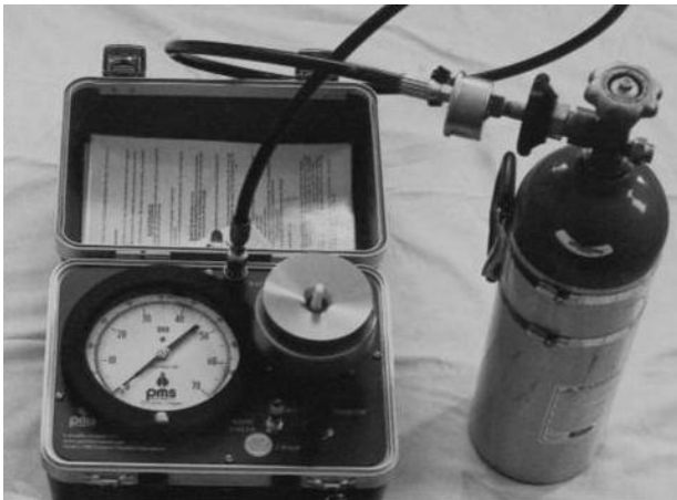
Şekil 2. Basınç odası cihazı

Hazırlanan sürgün en fazla 3 dk içinde cihaza yerleştirilerek tüpün vanası açılmış, kesim yüzeyinde su belirinceye kadar cihazın odacığına azot gazı dolması sağlanmıştır. Kesim yüzeyi ışıklı el büyüteci ile gözlenirken su çıktığı anda cihazın subabı kapatılarak monometreden oda içindeki basınç okunmuştur (Cleary ve Zaerr, 1984). Okunan bu değer, sürgün ksilem su potansiyeli olup örneklem anındaki aktüel bitki su gerilimine eşittir.