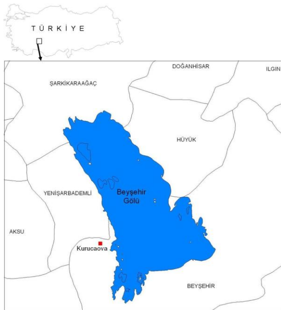
Şekil 1. Deneme alanlarının alındığı Kurucaova yöresinin haritada gösterimi

Deneme parsellerinin yeri belirlendikten sonra, köşe kazıklarına parsel numarası yazılmış ve oluşturulan her deneme alanındaki tüm bireylerde göğüs çapı ve boy ölçümleri yapılmıştır.