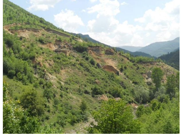
Şekil 1. Heyelan görüntüsü (Yığılca-Düzce)

Heyelanlar, kütlelerin yamaç aşağı hareketine neden olan sürükleyici kuvvetlerin, kütlelerin hareketini önleyen tutucu kuvvetlere eşit olması ya da bu kuvvetleri aşması durumunda ortaya çıkmaktadır. Heyelan oluşumuna neden olan faktörler genel olarak doğal ve insan kaynaklı olarak sınıflandırılan büyük ve karmaşık çevresel faktörler kümesidir (Carrara vd., 1999). Heyelana neden olan doğal etmenler; yoğun yağışlar veya kar erimelerine bağlı olarak taban suyu seviyelerindeki artışlar, nehir ve baraj havzalarında su seviyelerindeki azalmalar, erozyona neden olan yüzeysel akış hareketleri, toprak kütlelerinin yan ve topuk desteklerinin su seviyelerindeki dalgalanmalar ve akış hareketlerine bağlı olarak kalkması ve depremler ile volkanik aktivite kaynaklı sarsıntular olarak kabul edilmektedir (Anonim, 2006). İnsan kaynaklı faktörler ise tutucu kuvvetlerin azalmasına neden olan ve boşluk suyu basıncını artıran tarım vb. faaliyetler, bitki örtüsünün ortadan kaldırılması ve şev açılarının artmasına neden olan inşaa çalışmaları gibi faaliyetlerdir (Anonim, 2006).