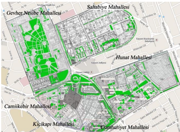
Şekil 6. İmar planına göre çalışma alanı genelinde öngörülen açık-yeşil alanlar