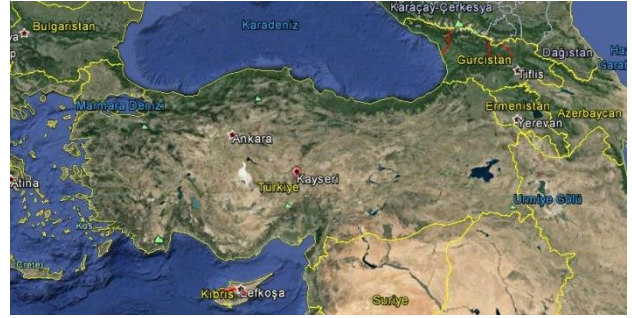
Şekil 1. Kayseri kenti coğrafi konumu (Google Earth)

Geçmiş yaklaşık 4500 yıl öncesine dayanan kentin merkezinin, en az 1500 yıldır yerleşilen bir alan olduğu belirlenmiştir. Kent özellikle 1950'lerden itibaren hızlı bir kentsel yenileme sürecine girmiştir. Buna rağmen sınırlı sayıda tarihi yapı günümüze ulaşmıştır. Kentte, tespiti yapılmamış ve düzenli arkeolojik çalışmalara konu olmamış birçok tarihi değer yer almaktadır (Çalışır Hovardaoğlu, 2009). Kayseri, önemli ticari ve askeri yolların kesişme noktasında yer alması nedeniyle, ilk çağlardan itibaren Anadolu'nun önemli yerleşimlerinden biri olmuştur (Arık, 1969).