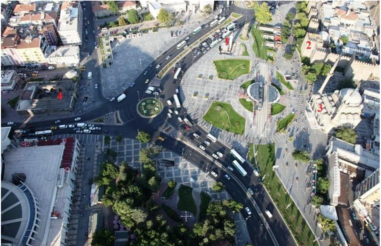
Şekil 4. Cumhuriyet Meydanında bulunan tarihi yapılar ve çevreleri (1.Saat Kulesi, 2.Kayseri Kalesi, 3.Hacikilic Camii, 4.Sahabiye Medresesi), (Anonim, 2015a)