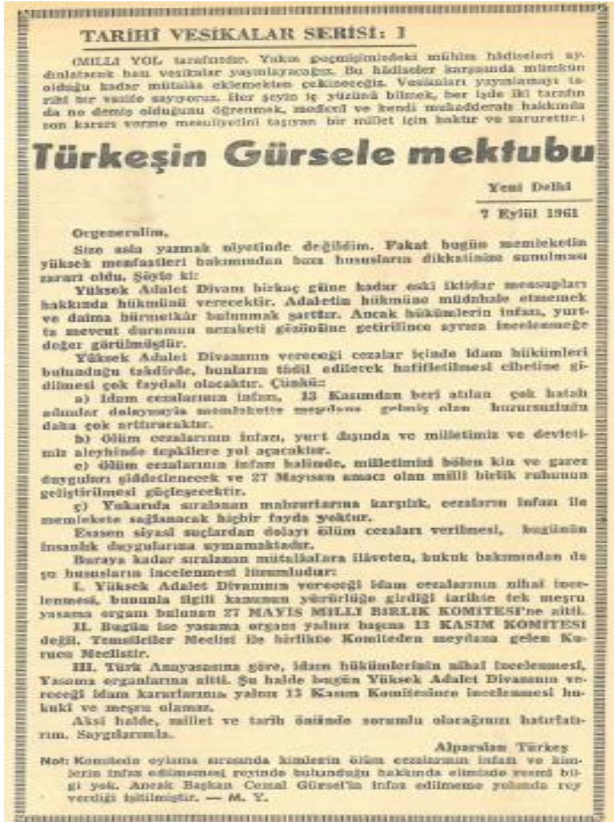
2. Alparslan Türkeş'in idamların önlenmesi için Cemal Gürsel'e hitaben kaleme aldığı mektubu