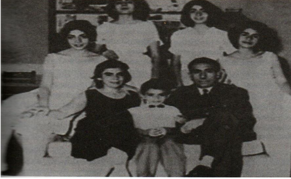
5. Alparslan Türkeş ailesiyle birlikte Yeni Delhi'deki evinde