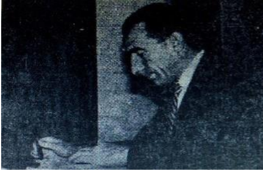
6. Alparslan Türkeş'in Hindistan'da bir odada çalışırken çekilmiş bir fotoğrafı

Kaynak: Hüseyin Hüsnü Uğur. Başbuğlu Yıllar: Türkeş'in Bilinmeyen Yönleri 1978-1997 , Ankara: Berikan Yayınevi, 2. Baskı, 2018, s. 175.