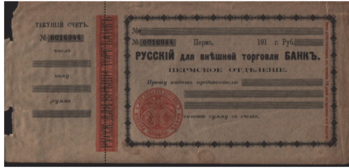
Resim 1. Dış ticari işlemler için Rus Bankası çeki 20

Rus hukukunda ilk çekler aşağıda Resim 1'de görüldüğü üzere XX'nci yüzyılın başlangıcından itibaren bankacılığın dış ticari işlemleri için kullanılmaya başlanmıştır.