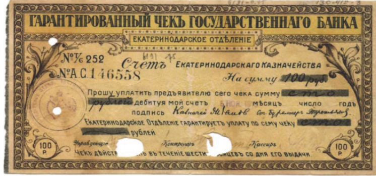
Resim 3. Devlet bankasının garantili çeki (Yekaterinodar şehri)

Bununla birlikte yıllar geçtikçe daha sonraki dönemde çeklerin dolaşım şartlarına göre ibraz sürelerinde de farklılıklar söz konusuydu. Örneğin Yekaterinodar şehrinde üç veya altı aylık çekler düzenlenmekteydi. Bunun gibi diğer şehirlerde de farklı süreli çekler düzenlenebilmekteydi. Sürelerin bitimi ile bankalar söz konusu çekleri iptal etmekteydi. İptal işaretleri genellikle banka imzalarının bulunduğu yerlerde veya belirtilen geçerlilik süreleri yuvarlak veya oval dikdörtgen çek zımbalama şeklinde çek üzerine yapılmaktaydı (Resim 3).