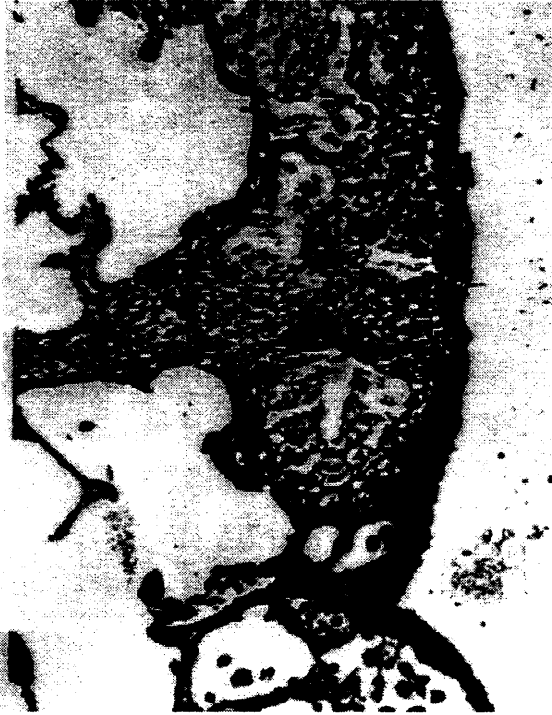
Resim 1. Akciğer dokusunda fokal ödemli alanlar izlenmektedir.

patolojide; grup 1'de bir ratta diafragmatik yüzde %25 plevral yapışıklık, bir ratta akciğer atelektazisi, bir ratta üst lobda akciğer ödemi ve bir ratta ise orta ve alt lobda akciğer ödemi mevcuttu (Resim 1). Grup 2'de bir ratta diafragmatik yüzde %25 yapışıklık, iki ratta üst lobda bir ratta tüm akciğerde atelektazi ve bir ratta ise akciğer içi kanama mevcuttu. Grup 3'de dört ratta akciğer ödemi ve bunların ikisinde hemotoraks ve akciğer içi kanama mevcuttu.