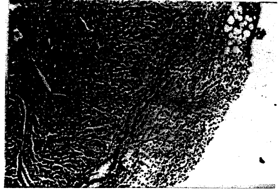
Resim 3. Yapışıklık bölgesi ve yoğun iltihap hücreleri görülmektedir

Grup 4'de ise iki ratta akciğer ödemi, bir ratta hemotoraks tesbit edildi. Akciğerde hasar (ödem, atelektazi veya akciğer içi kanama) oranları gruplarda sırasıyla % 60, 80, 67 ve 60 şeklindeydi. Yapışıklık tesbit edilen iki ratın mikroskopisinde yapışıklık bölgesinde fibrosis, yoğun iltihabi hücre infiltrasyonu ve subplevral bölgede köpüklü histiyositler izlendi (Resim 2 ve 3).