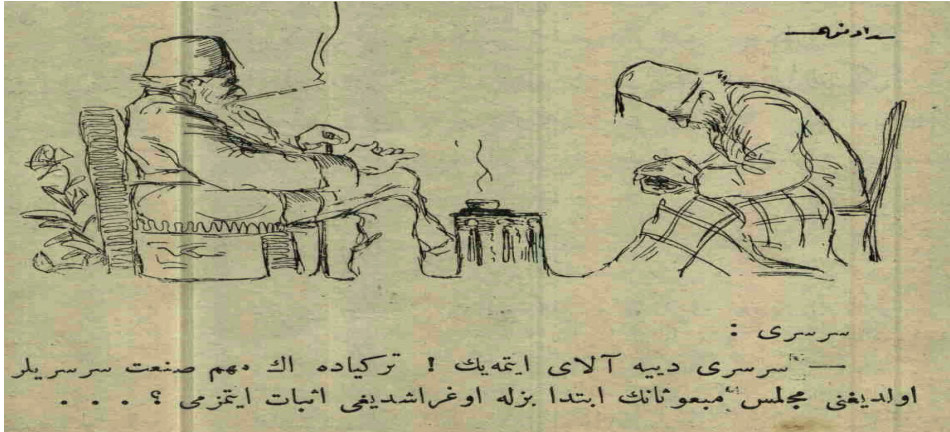
Resim 6: Serseri Diye Alay Etmeyin! 130

Özellikle 19. yüzyılın sonlarında netleşmeye başlayan “kamu düzeni polisliği ve suçun tanımı” nazariyesinde ve kamuoyunda serserilerin birer “potansiyel suçlu” olarak algılanmaya başlanması üzerine 18 Eylül 1890 tarihinde “Serseri ve Mazanne-i Sû’i Eşhas Hakkında Nizâm-nâme” 128 çıkarılmıştır. Söz konusu nizamnamede öncelik toplumun bu marjinal kesimlerinin ıslah edilmelerine verilmekle birlikte “şerr ve mazarratlarının defi” için cezai yaptırımlar düşünülmüştür. 129