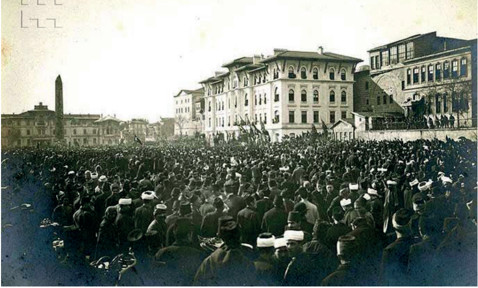
Resim 2: II. Meşrutiyet Döneminde Bir Miting Esnasında Sultanahmet Meydanı ve Hapishane-i Umumi (* ile işaretli yapı Hapishane-i Umumi) 97

Bu protesto eylemleri The Times Gazetesi'ne de konu olmuştur. 31 Temmuz 1908 tarihli The Times Gazetesi'nin "Suçluların Serbest Bırakılması" başlıklı haberinde meşrutiyetin ilanı sonrası ilan edilen genel affın akabinde yaşanan hadiseler şu şekilde aktarılmıştır: İlan olunan affla beraber suçları ne olursa olsun cezalarının 2/3'ünü tamamlayan bütün mahkûmların serbest bırakılmasını emreden bir irade yayımlanmış, ancak bu hüküm dışımda kalan diğer mahkûmlar genel afftan yararlanamadıkları için durumu protesto etmeye başlamışlardır. Bunun üzerine affın kapsamı genişletilmiş ve kısa sürede bütün hapishaneler boşalmıştır. Mahkûmların bu zamansız tahliyesi hem toplum nezdinde hem de toplumun ileri gelen çevrelerinde huzursuzluk meydana getirmiş ve 2000 kişiden oluşan bir grup ilan olunan affı protesto etmek için Bâb-ı Âli'ye giderek sadrazam ile görüşmek istemişlerdir. Ancak sadrazam tarafından kendilerine 'padişah iradesine karşı hiçbir şey yapılamayacağı' yanıtı verilmiştir. 98