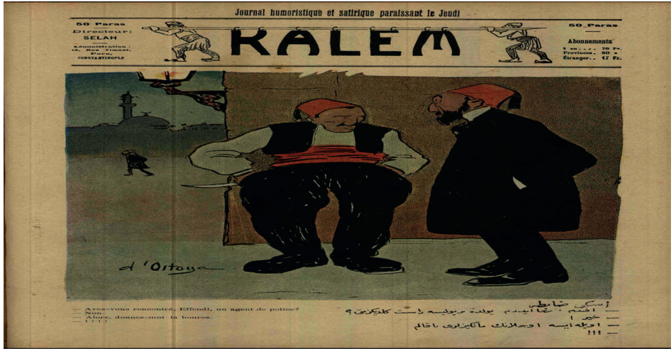
Resim 4: Eski Zabita 110

Genel aftan faydalanarak çıkmış ve memleketin her tarafına dağılmış olan hırsızlar, yankesiciler arı gibi işlemeye başlamış, özellikle de İstanbul'da asayiş sorunu ortaya çıkmıştır. Hata bu problemin çözümü için Selanik'ten polis getirilmesi dahi gündeme gelmiştir. 111 Fakat "...bizim tutup içeriye tıktıklarımızdan pek çoğu yakın zaman önce ilan olunan genel af gereği salıverildi... genel aftan yararlanarak çıkarlar, şimdi karşımıza geçip bacak bacak üstüne oturuyorlar..." 112 ve "...bugün memleketimiz her zamankinden ziyade asayişin sağlanmasına muhtaçtır..." 113 gibi yorumlarının yapıldığı II. Meşrutiyetin ilk zamanlarında, sadece İstanbul'da değil tüm Osmanlı topraklarında ciddi anlamda asayiş sorunları yaşanmıştır. 114 Nitekim gazetelerin vukuat sütunları genel af sonrası yaşanan adi suç hadiseleriyle dolup taşmaya başlamış ve bu olayların müsebbibi olarak ise kontrolsüz bir şekilde icra edilmiş olan genel af gösterilmiştir. Bu nedenle "Bir cemiyetin saadet ve selameti için sadece hürriyet yeterli olur mu?"