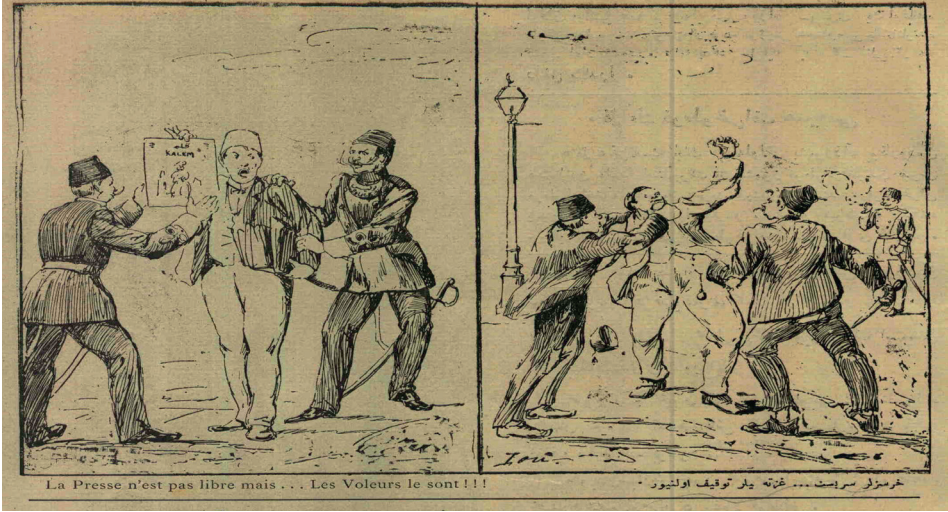
Resim 3: Hırsızlar Serbest 100

eşraftan oluşmadığı, gazeteci ve Genç Türklerden de eyleme katılanların olduğu bildirilmiştir. Ayrıca yaşanan gelişmelerden dolayı sadrazama karşı öfkeli olan protestocular, Sadrazam Mehmed Said Paşa'yı ziyaret ederek affın asıl amacının karışıklık çıkarmak ve henüz ilan edilmiş olan anayasal düzenin küçük düşürülmesi olduğunu ileri sürmüşlerdir. 99