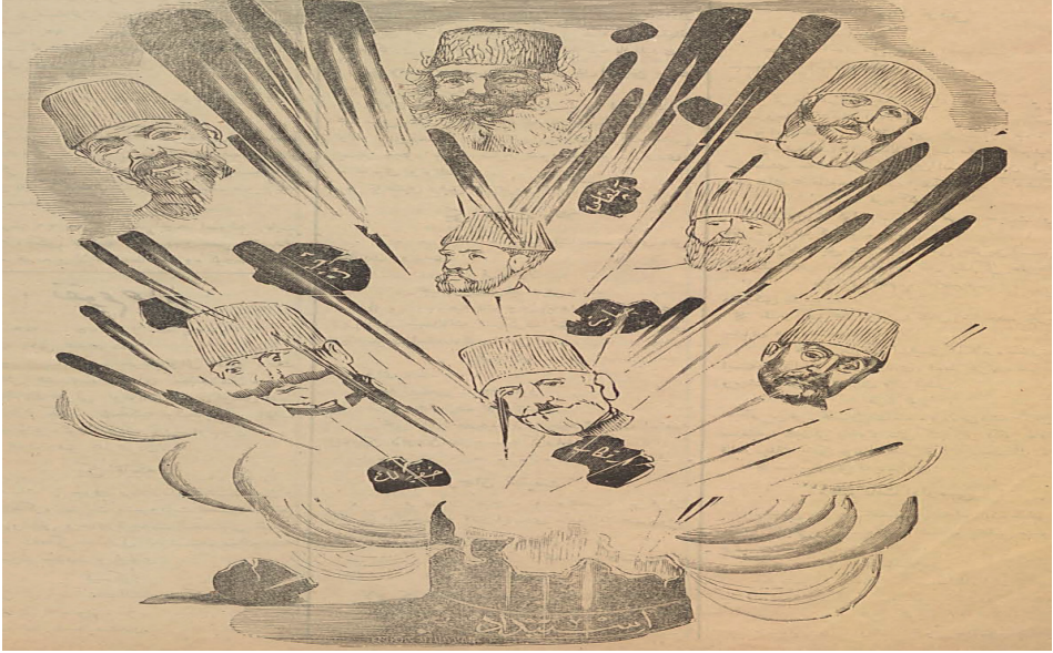
Resim 1: İstibdadın Patlaması 59

Bu telgrafla, Kânûn-ı Esâsî'nin maddelerine uygun olarak meşruti sistemin yeniden kurulması ve İstanbul'da bir millet meclisin toplanması istenilmiş, aksi halde ise harekete geçileceği bildirilmiştir. Bu telgrafi, Kosova, Selanik, Serez ve Priştine'den çekilen aynı minvaldeki telgraflar izlemiştir. İttihatçıların gerek yurt içinde ve gerekse yurt dışında verdiği özgürlük mücadelesi; 1908 yılının temmuz ayında amacına ulaşmış, yaklaşık 30 yıllık istibdat dönemi sona ermiştir. 23/24 Temmuz 1908 (10 Temmuz 1324) tarihinden itibaren II. Meşrutiyet Dönemi başlamıştır. 58