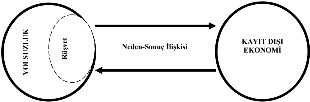
Tablo: 4 Kayıt Dışı Ekonomi, Yolsuzluk ve Rüşvet Arasındaki İlişki

Not: Tablo yazar tarafından oluşturulmuştur.