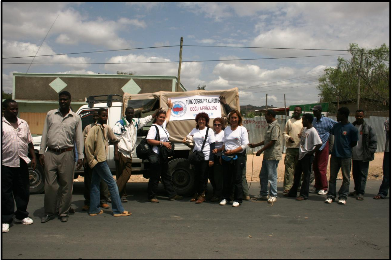
Doğu Afrika 2009 arazi çalışmasına katılan öğretmen grubumuz, ev sahipleri ile...